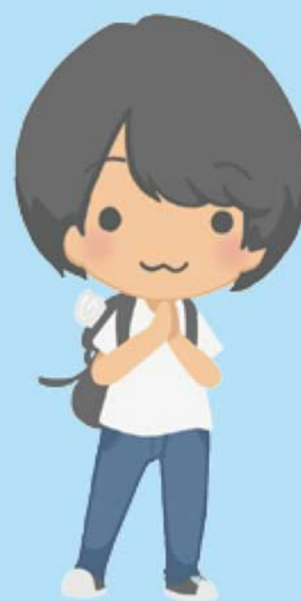
海外からのお客さま

タイの方は、笑顔が素敵で、優しいです。 日本人ががんばってタイ語を話してくれているのを知ると、とっても嬉しくなりますので、 あまり慣れない言語ですが、恥ずかしがらずに会話を楽しんでみましょう。 あいさつや簡単な単語だけでも、笑顔とともに気持ちが伝わっていきます！