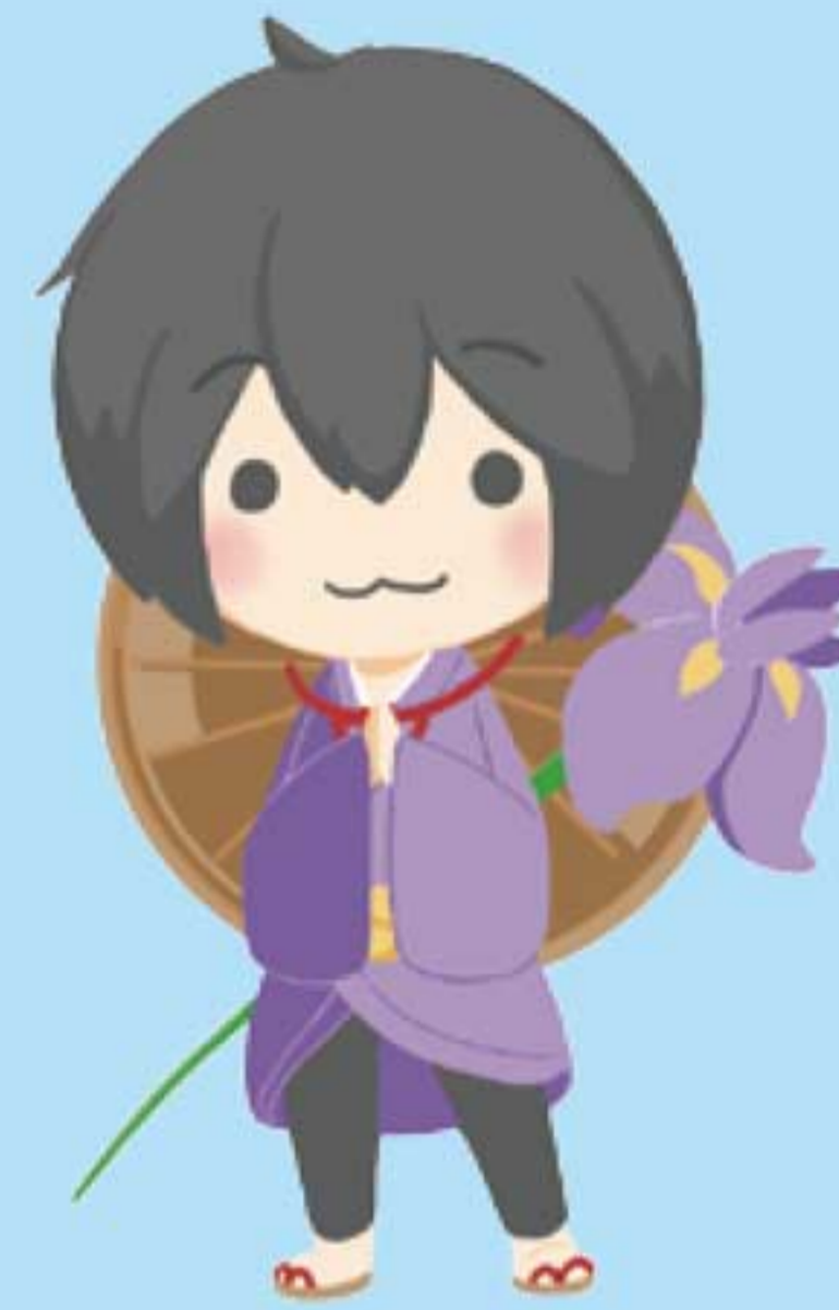
香取市外国人おもてなしBOOK 主人公 かとりあやめ