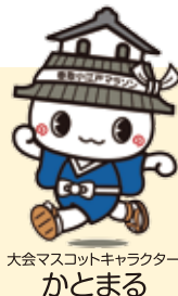
大会マスコットキャラクター かとまる