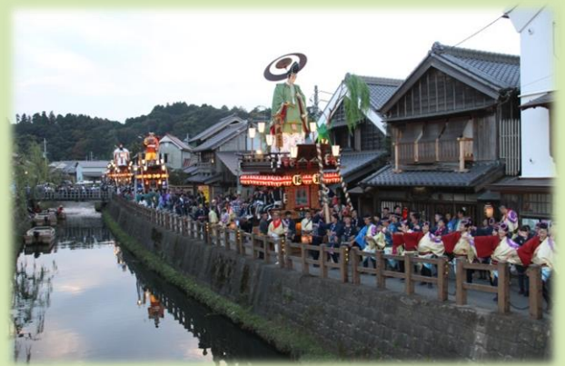
国指定重要無形民俗文化財に指定されている 佐原の大祭と情緒ある佐原の町並み