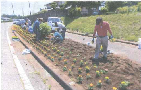
花苗は足りるかな？