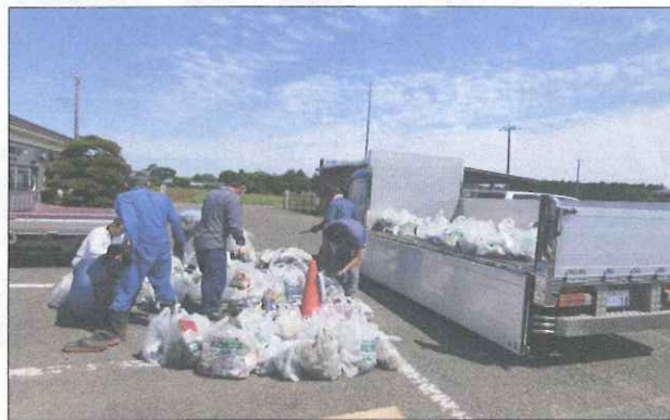
捨てる人の顔が見たいー 分別中の 上の台区