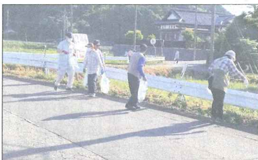
あーあそこにもある