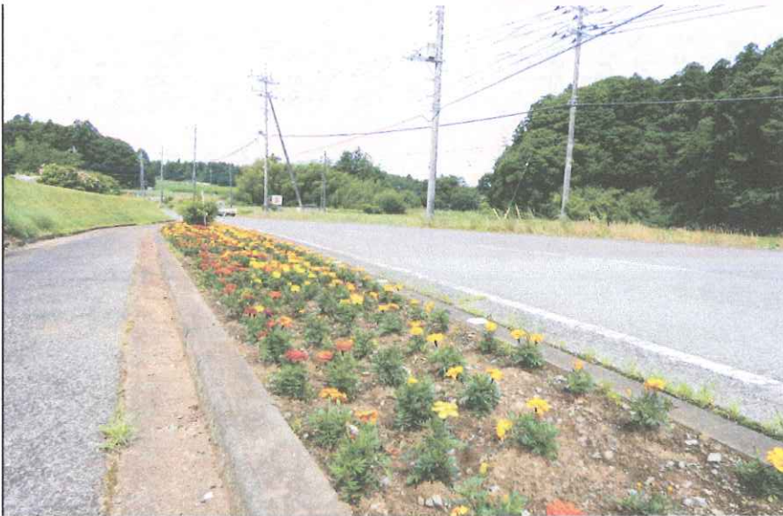
やっぱり花はきれいだなー

毎年、今頃になると、中峰区の入り口の道路脇花壇には、花が整然と植えられて、大変きれいです。その一角は、他にも花畑があり、ちょっとした観光名所になるかな！