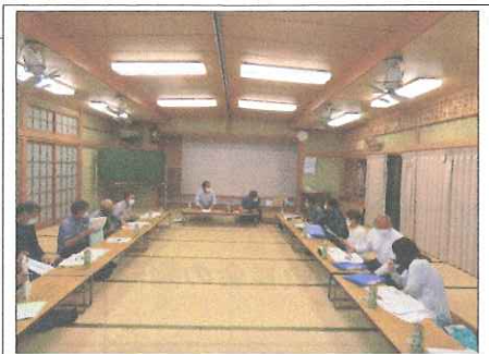
新区長を含む新旧4役員引継ぎ会議

総会が書面決議で終了しました。皆様のご協力に感謝いたします。令和4年度は、役員の変更期ということもあり、役員24名中、新たに13名の方が役員に就任されました。また今年から、副会長と会計が2名体制と地区周り番制の選出方法となりました。これにより、活発な事業運営になることが期待されます。さて、高萩地区住民自治協議会は平成23年11月に誕生し、本年度10年を過ぎ、事業の見直しを検討する時期に参りました。自治協議会の目的は、これから、予想される過疎化に対する町づくりにあります。地域を超えた、交流を目指し自治協議会ごとに、独自の祭りのなものがあられを中心にして活動しています。高萩地区住民自治協議会に行けば、芋煮会があると言われるように。