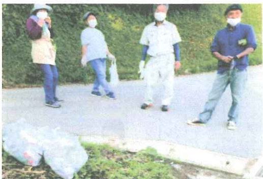
どうだ！ こんなにあったどー 高萩区

ごみゼロ運動と合わせて、各区長さんを中心に、ポイ捨て防止マップの作成と啓発看板の設置を行いました。また、各家庭のペットボトルキャップを集めて、小学校へのリサイクル支援を行いました。