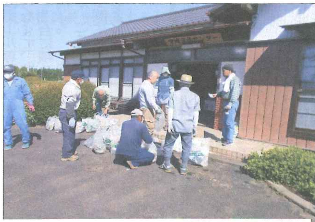
こんなにあったよ！