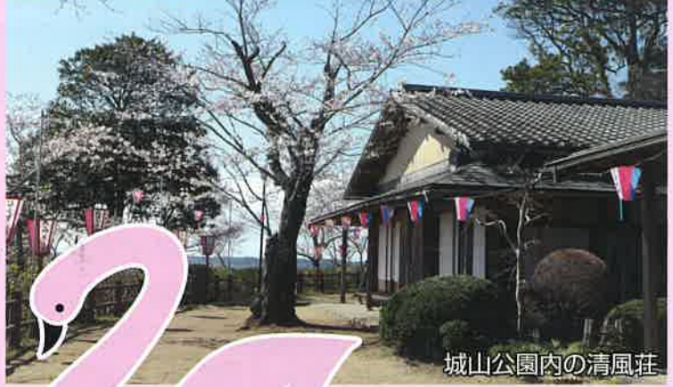
城山公園内の清風荘