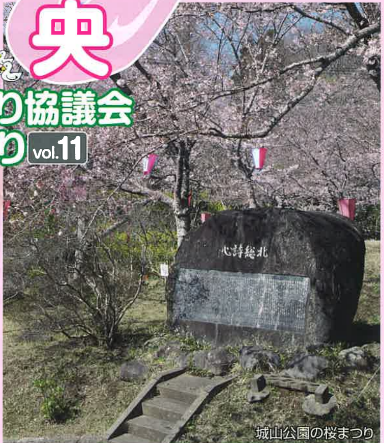
城山公園の桜まつり