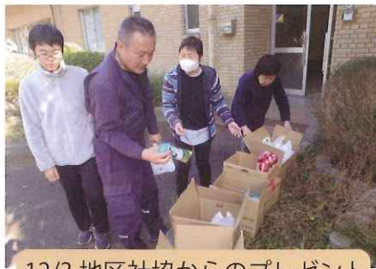
12/3 地区社協からのプレゼント