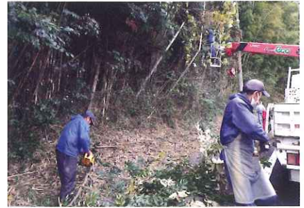
委員による、作業補助