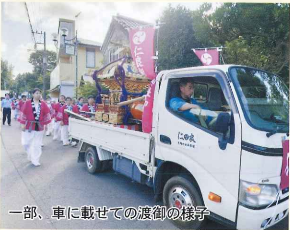
一部、車に載せての渡御の様子

本年、4年ぶりとなる仁良熊野神社ご祭礼を開催でき、まずはご協力いただきました神社総代をはじめ、仁良区の皆様にお礼申し上げます。