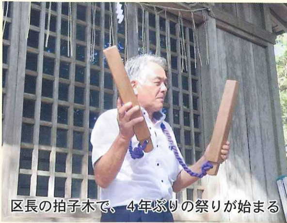
区長の拍子木で、4年ぶりの祭りが始まる