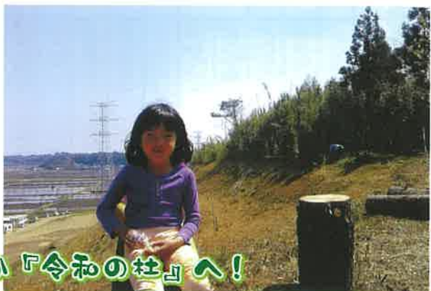
出かけてみませんか「令和の柱」へ!