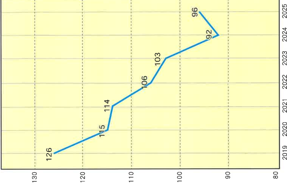
瑞穂小学校児童数