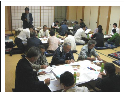
まちづくり座談会（長島会館）