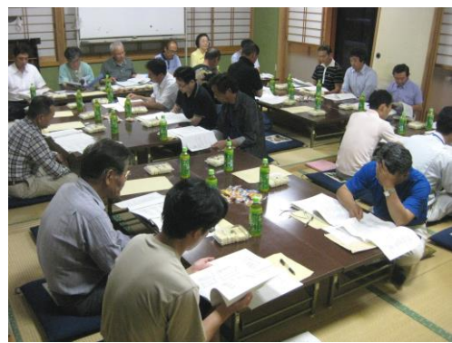
平成24年度第1回理事会