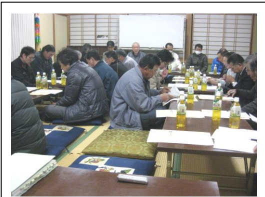
平成23年度第1回理事会