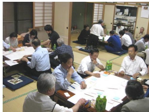
まちづくり座談会（荒川公会堂）