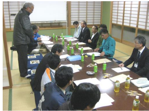
第1回計画策定委員会