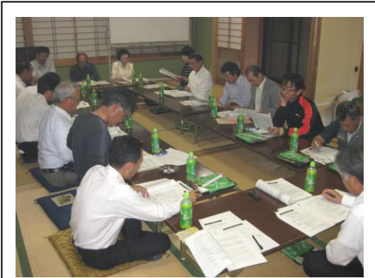
第2回計画策定委員会