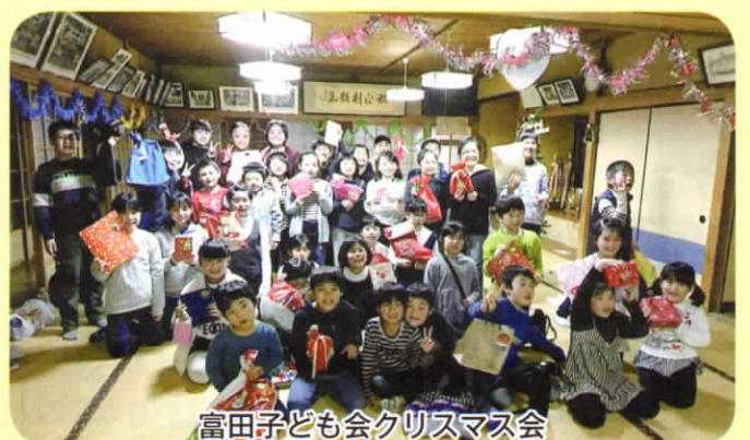
富田子ども会クリスマス会