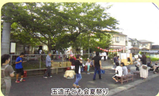
玉造子ども会夏祭り