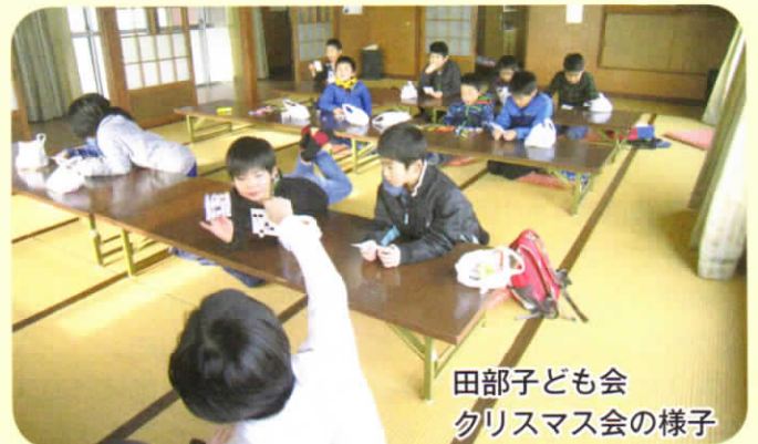
田部子ども会 クリスマス会の様子