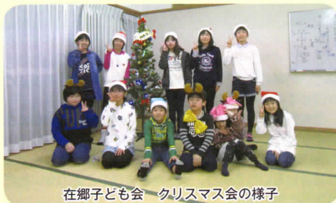
在郷子ども会 クリスマス会の様子