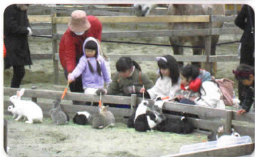
動物とのふれあい