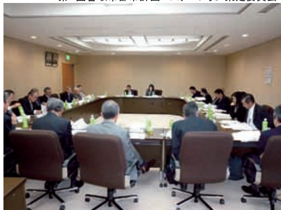
第2回香取市都市計画マスタープラン策定委員会