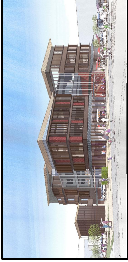
施設外観イメージ