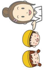
認定こども園とは？

認定こども園とは、教育・保育を一体的に行う施設で、いわば幼稚園と保育所の両方の良さを併せ持つ施設です。