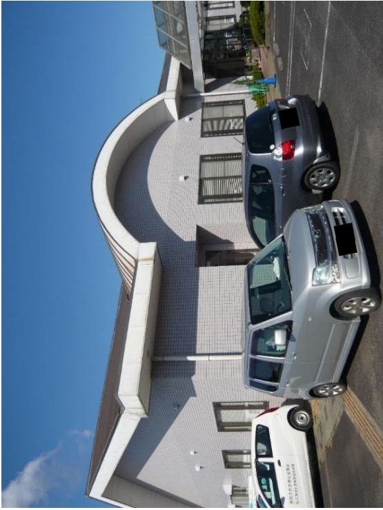
小見川社会福祉センター（さくら館）