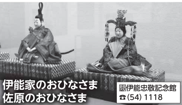
伊能家のおひなさま 佐原のおひなさま

江戸時代後期から続く十二座神楽の鑑賞や地域を支配した王や豪族の墓である古墳を探ります。 ■対象 市内在住・在勤の成人 ■日時・内容 3月3日(火)…木内神楽鑑賞、3月11日(水)…市内古墳巡り、3月20日(金)…新里の白川流十二座神楽鑑賞 ※いずれも午後