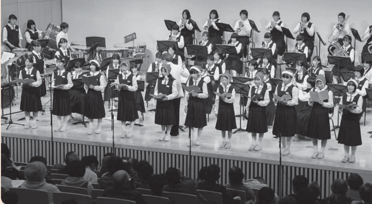
▲フィナーレは両部合同の「きよしこの夜」(小見川中学校合唱部・吹奏楽部クリスマスファミリーコンサート)