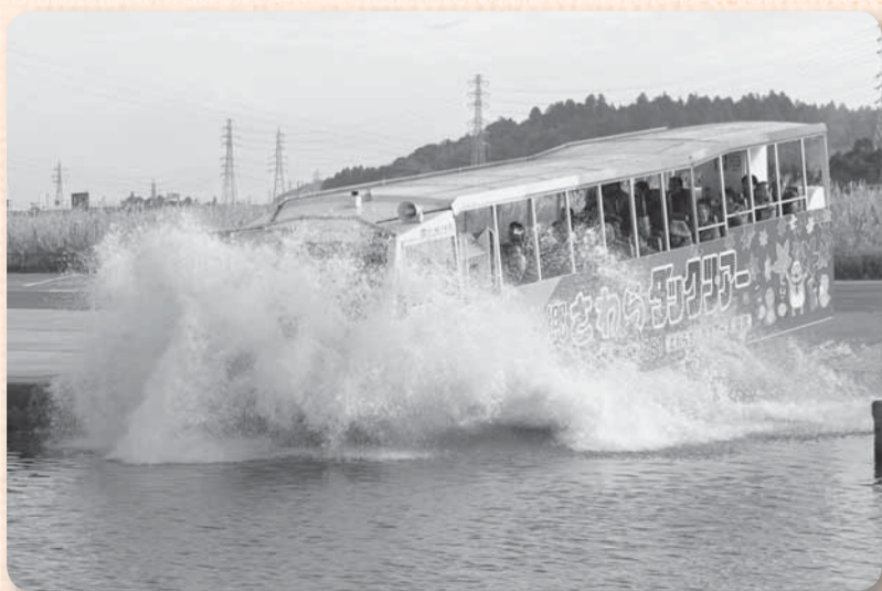
▲意外とバス内に水しぶきはかかりません

県内初の水陸両用バス運行ツアーである、日本水陸両用車協会主催の「水郷さわらダックツアー」オープニングセレモニーが、12月25日に水の郷さわらで行われました。