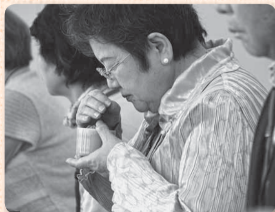
▲お香を聞くのは3回の決まり

華道や茶道と同じく、日本の伝統的な芸道である香道を学ぶ「香道教室」が12月17日に山田公民館で開かれました。