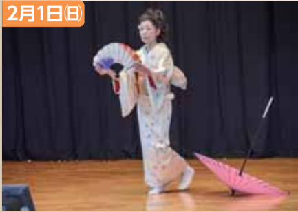
市民文化祭(栗源会場)