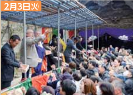
市内各地で節分祭