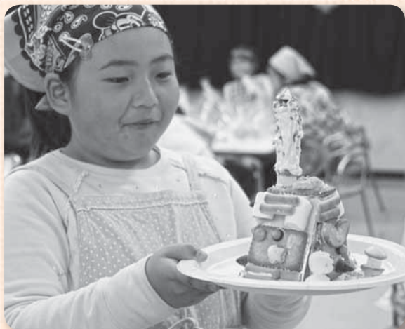
▲この長〜いえんとつがポイントなの！ (山田児童館クリスマス会)