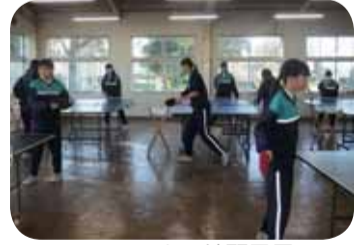
▲いつもの練習風景

部員12人で県大会出場を目標に日々練習に励んでいます。元の技術室を多くの人たちが整備してくださったおかげで安全で練習しやすい活動場所になりました。その気持ちに感謝しながら精一杯練習し、目標を達成できるよう頑張ります。