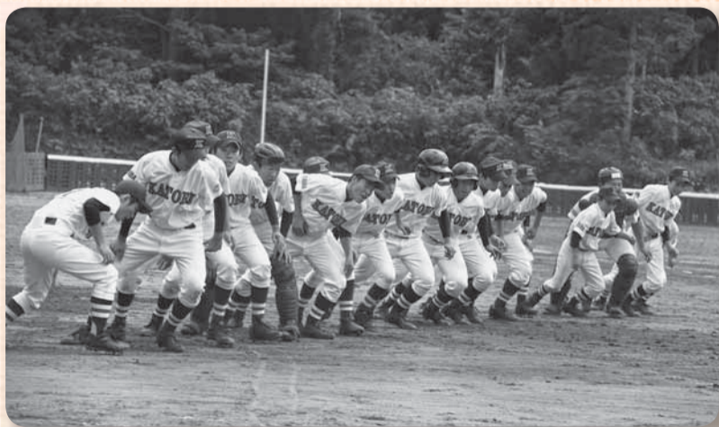
▲気合いを入れていざ出陣

硬式野球の関東大会「2014関東連盟秋季大会」に香取リトルシニアが創部5年目で初出場を果たし、10月12日に香取シニア球場（大倉）で1回戦を行いました。