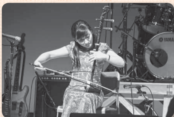
▲ライブ会場は幻想的な雰囲気（小見川：二胡の演奏）