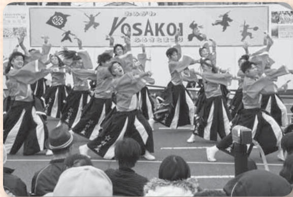
▲よさこいは3つの会場で演舞を披露（小見川）