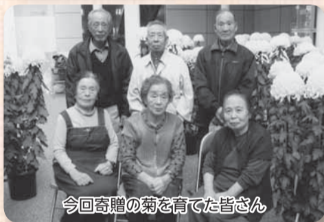
今回寄贈の菊を育てた皆さん