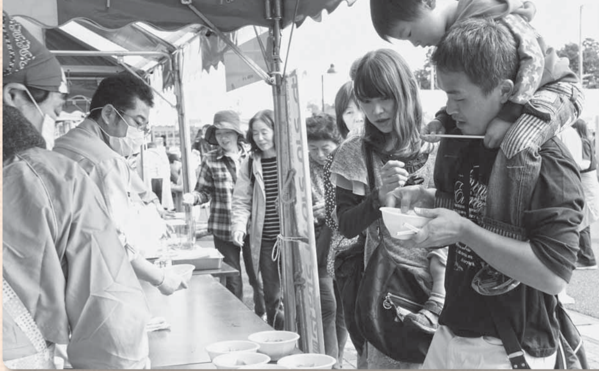
▲岩手山田復興祈念の募金に協力（山田：けんちんうどん配布）