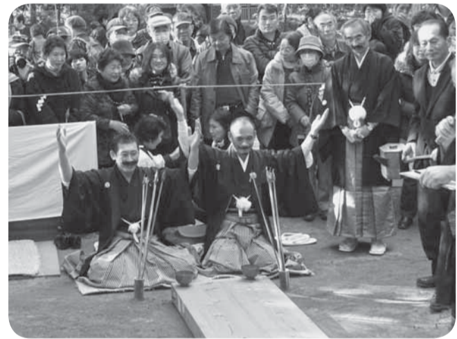
▲多くの見物客でにぎわいました

大倉地区の氏子の間で祭り当番を引き継ぐ儀式として鎌倉時代から約800年続く「ひげなで祭」が、側高神社で行われました。 祭り当番を引き継ぐ儀式では、ひげをなでる仕事をすると、請当番(新当番)は何杯でもお酒を飲まなければなりません。中にはお酒を20杯以上も豪快に飲み干した組もあり、多くの見物客でにぎわった境内は、歓声に包まれました。