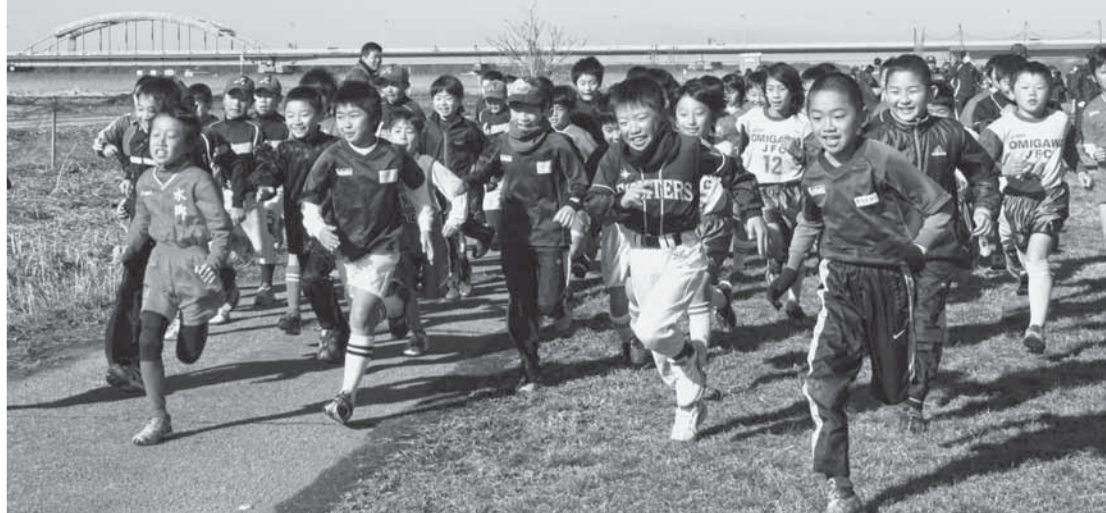
▲香取郡市スポーツ少年団地域交流大会で行われたミニマラソン(1月27日)

本市には、日本体育協会に登録されたスポーツ少年団があります。 各単位団が、青少年健全育成の一環として、スポーツを楽しむながら団員相互の調和と親睦を図ることを目的とし、活発な活動を行っています。 スポーツ少年団に入ると ●年間を通じて定期的・継続的にスポーツが楽しめます。 ●スポーツが好きになり、上手になり、得意になります。 ●全国組織なので、県内や全国の仲間との交流ができます。 ●異年齢集団でのグループ活動のため、子ども同士が互いに学び合います。 ●研修を受けた、優れた指導者が団運営と指導を行います。