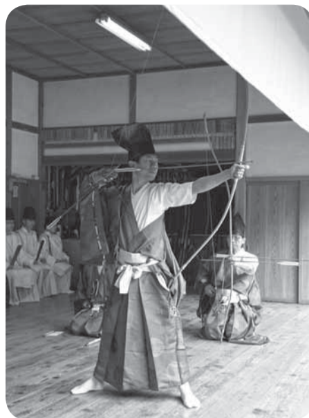
▲厳かな雰囲気の中、弓を構える射手