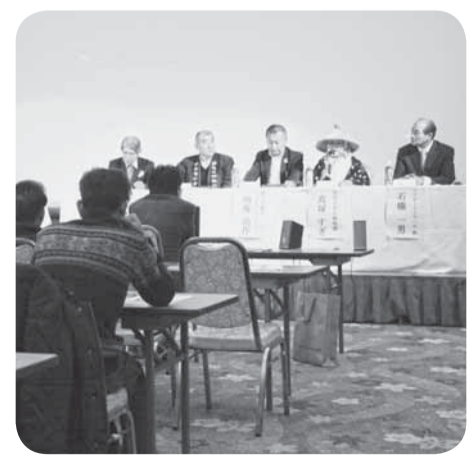
▲討論者の意見発表

利根川舟運・地域づくり協議会による公開シンポジウム「利根川下流域での観光舟運の魅力」が、開花亭(扇島)で開催されました。 パネラーとして参加した舟運業者や観光関係者は、それぞれの立場から利根川一帯の魅力や舟運の魅力などを話し合い、地域づくりや利益誘導へつなげる足掛かりとすべく、活発な意見交換を行いました。