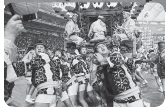
▲迫力あるの字廻し