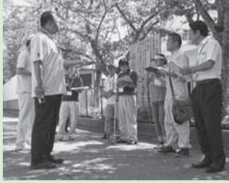
▲佐原小学校通学路点検

市では昨年8月に、県香取土木事務所、香取警察署、教育委員会および各学校職員や保護者の皆さんと連携し、市内小学校から報告があった通学路の危険箇所