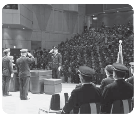
▲受賞者代表謝辞の様子

新春の恒例行事となっている消防団消防出初式が、佐原文化会館で行われ、消防署員・団員600人が参加しました。 式では市長の式辞や消防団長の訓示のほか、地域防災に貢献した団員らに表彰状の贈呈が行われました。 式終了後には和太鼓グループ「響」が演奏を披露。息の合った力強い太鼓の音色がホールに響き渡りました。