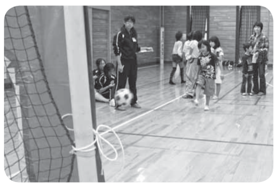
▲的に目掛けてシュート（キックターゲット）

親子で手をつないでゴールする親子マラソン、白熱のヘルスバレーボール、誰でも気軽に参加できるストラックアウト、キックターゲット、ダーツ、輪投げなど、大人から子どもまでスポーツの秋を楽しみました。