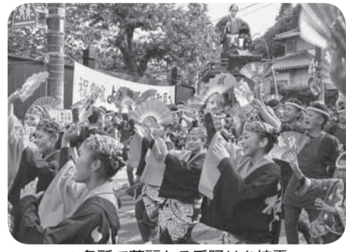
▲各所で華麗なる手踊りを披露

佐原の大祭秋祭りが新宿地区で行われ、各町内自慢の山車14台が勇壮に曳き廻されました。初日は、山車の乱曳ぎが行われ、地元町内を中心に佐原囃子の音色を響かせながら練り歩き、軽快な手踊りも披露されました。最大の見せ場である中日は、高さ約7mにもおよぶ絢爛豪華な山車14台が香取街道、上宿通り沿いに一堂に整列。佐原囃子の演奏とともに総踊りを披露したあとに、小野川沿いを連なつて巡行しました。