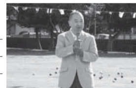
▲小見川幼稚園運動会