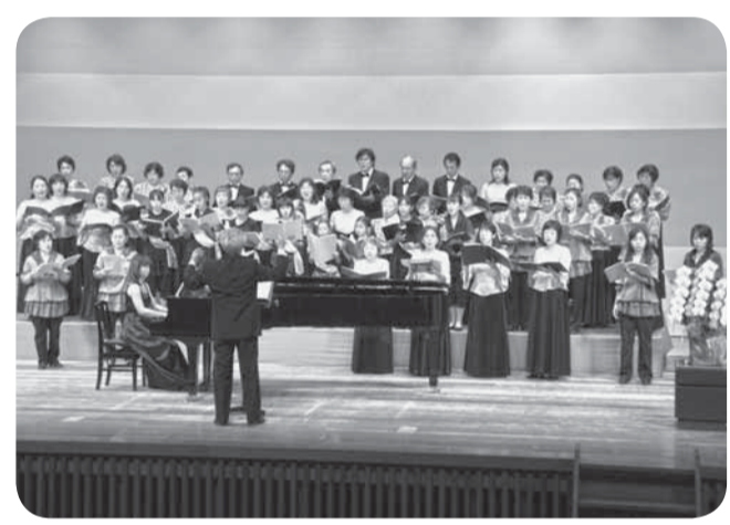
▲フィナーレは合同で演奏

市内の合唱団4団体（佐原グリーンハーモニー、芦笛、ammina、佐原混声合唱団）の合同演奏会「コーラスフェスタinさわら」が、佐原文化会館で開催されました。演奏会は各団体による単独での演奏ののち、4団体合同での演奏が披露され、フィナーレは小中学校の音楽の授業でも歌われる「Believe」を歌い、盛会のうちに幕を閉じました。邦人の作品を中心とした、素朴ながらも温かみのある、素敵なコンサートとなりました。