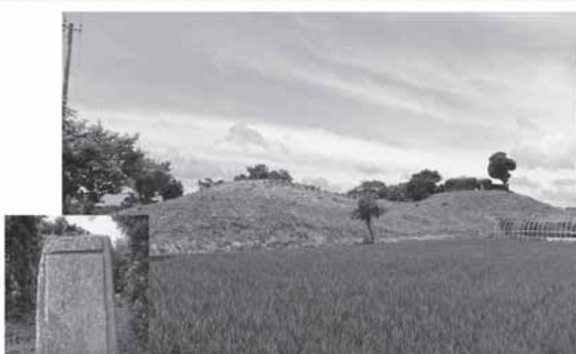
▲三ノ分目大塚山古墳