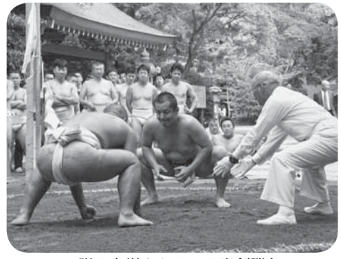
▲隊の名誉をかけての真剣勝負

大会は団体戦と個人戦がそれぞれ行われましたが、隊の名誉をかけての真剣勝負とあって、どの取り組みも熱戦が繰り広げられ、土俵際での逆転劇があると、大きな歓声が上がっていました。