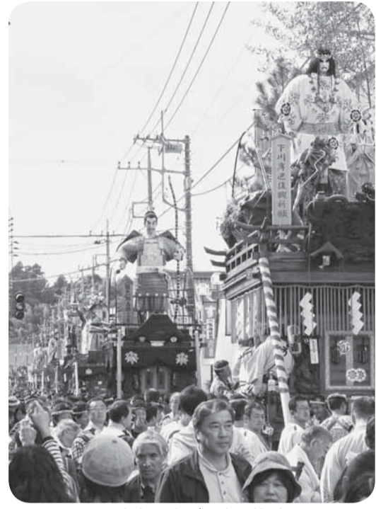
▲山車14台が一堂に整列

昨年東日本大震災の影響で山車を運行できなかった下川岸区、仲川岸区の2町も今年は完全復興を祈り、若衆の力強い掛け声とともに町内を曳き廻しました。