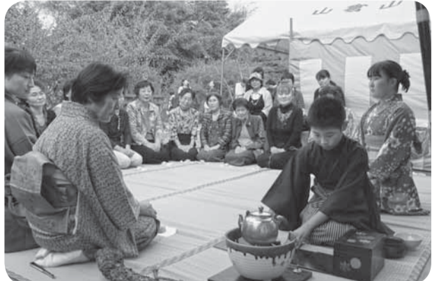
▲子どもたちからお茶が振る舞われました