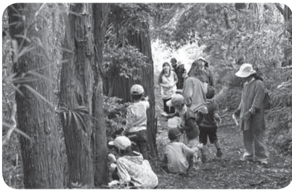
▲ごはんをつぶして五平餅作りに挑戦 ◀いろいろ見つけながら、山道を散策