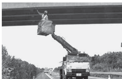
▲高所作業車を用いた点検