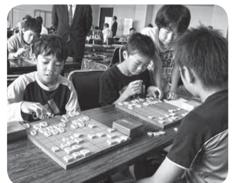
▲駒使いも鮮やかな豆棋士たち

個人戦では、小学生と大人が対局することもあり、大人顔負けの小学生棋士たちが奮闘しました。場内は最善手を打とうと緊迫した空気に包まれ、一手一手真剣な面持ちで駒が進められていきました。