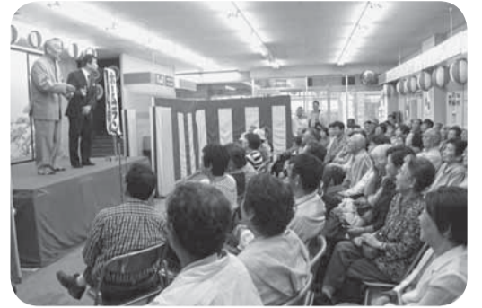
▲会場は大きな笑いに包まれました

さんが「小見川出前寄席に出演することが私の夢でした」と話されると、会場からは大きな拍手が沸き起こりました。