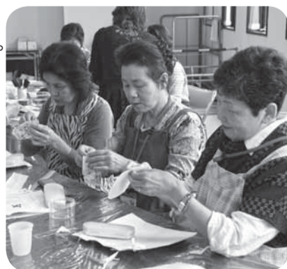
▲花柄のモチーフを張り付け、メガネケースを制作

今回は、初めての人でも取り組みやすいメガネケースに装飾し、個性豊かなデコパージュ作品を仕上げました。