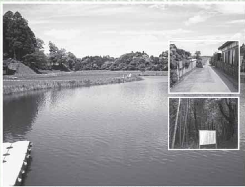
▲橋堰、土井の新堤(右上)、土井利勝植林指導地(右下)