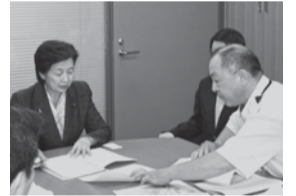
▲小宮山厚生労働大臣へ 近隣首長と要望書提出