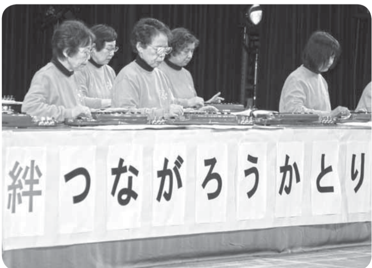
▲「絆」を胸に練習の成果を披露

文化会館では、大正琴などの楽器演奏や合唱、舞踊などの舞台発表が行われ、多くの人を訪れました。