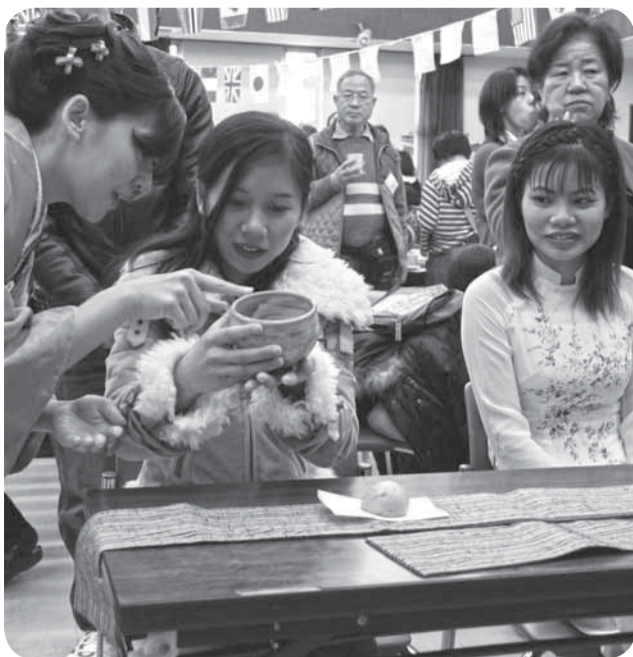
▲茶道の作法の奥深さに興味深く聞き入るベトナムからの研修生

市内に住む外国人の皆さんと、日本文化の体験をとおして交流を深めるKIFA国際交流パーティーが、佐原商工会議所で行われました。 また、餅つきやちぎり絵、茶道などを一緒に体験することで、ジェスチャーを交えて積極的な交流が図られました。 日本語スピーチコンテストでは、見事な日本語で日