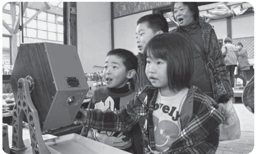
▲当たったかな?期待を込めて大抽選会にトライ(風土村)