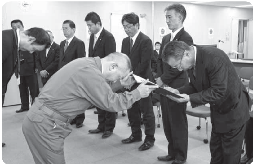
▲市長から感謝状を贈呈

東日本大震災で被災された人たちの支援と市の復旧・復興に貢献いただいた16団体への、感謝状贈呈式が市役所で行われました。地震発生時刻の14時46分には防災行政無線で追悼の意を込めたサイレンが鳴り、出席者は静かに目を閉じ、黙とうを捧げた後、市長から感謝状が贈呈されました。