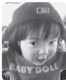
はな はな 巨 芭南ちゃん