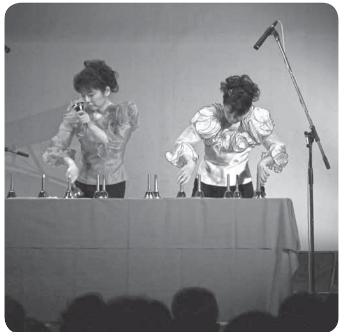
▲華麗な手さばきでハンドベルを奏でた「デュオアンダンテ」

日本を代表するミュージックベル演奏の姉妹ユニット「デュオアンダンテ」によるコンサートが、県立水郷小見川少年自然の家で行われました。演奏曲目は、「神田川」「冬のソナタ」。「世界に一つだけの花」などで、2人が奏でるハンドベルの華麗な手さばきと美しい音色に、会場の皆さんは心地よいひとときを過ごしました。