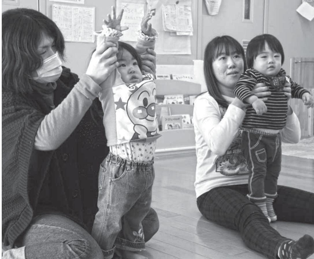
たまつくり保育所子育て支援センター