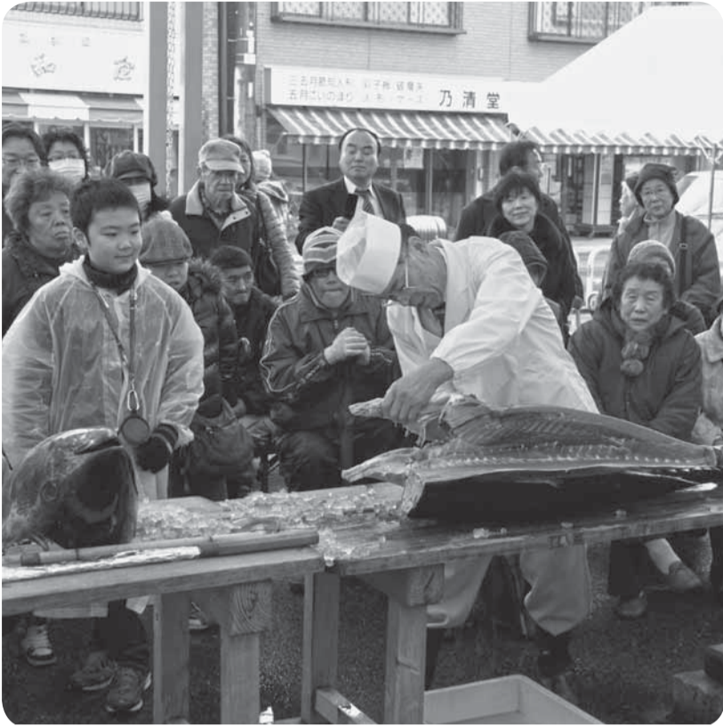
▲豪快なマグロの解体ショーに会場は賑わいました(佐原信用金庫本店駐車場)

佐原震災復興フェスタでは、佐原信用金庫本店周辺を会場に仲川岸商店会が中心となり、各商店が自慢の一品などで出店。特価で提供される絶品料理に舌鼓を打ちました。