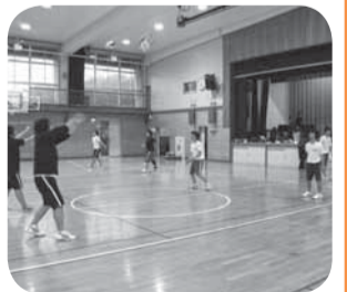
▲対人レシーブ練習

小見川高校男子バレーボール部は、選手13人、マネージャー1人、合計14人で活動しています。昨年度大会成績は、総体県大会2回戦敗退でしたが、常に全カプレーを目標に、日々の練習を頑張っています。勝負に一喜一憂するだけでなく、毎日どれだけ頑張ったか、どれだけ力がついたかを確かめながら部活動に参加し、良い仲間を増やして欲しいと思っています。