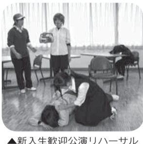
▲新入生歓迎公演リハーサル