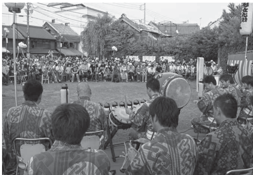
▲多くの聴衆を前に佐原囃子を披露する

震災により、伝統的な町並みに大きな被害を受けた佐原地区では、佐原囃子でまちを元気にしよう、復興を呼びかけるイベント「佐原ばやしGEZA」が5月21日に行われました。