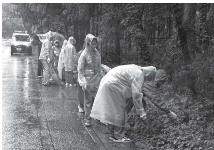
▲びしょ濡れになりながらも、ごみを拾うボーイスカウトの子どもたち