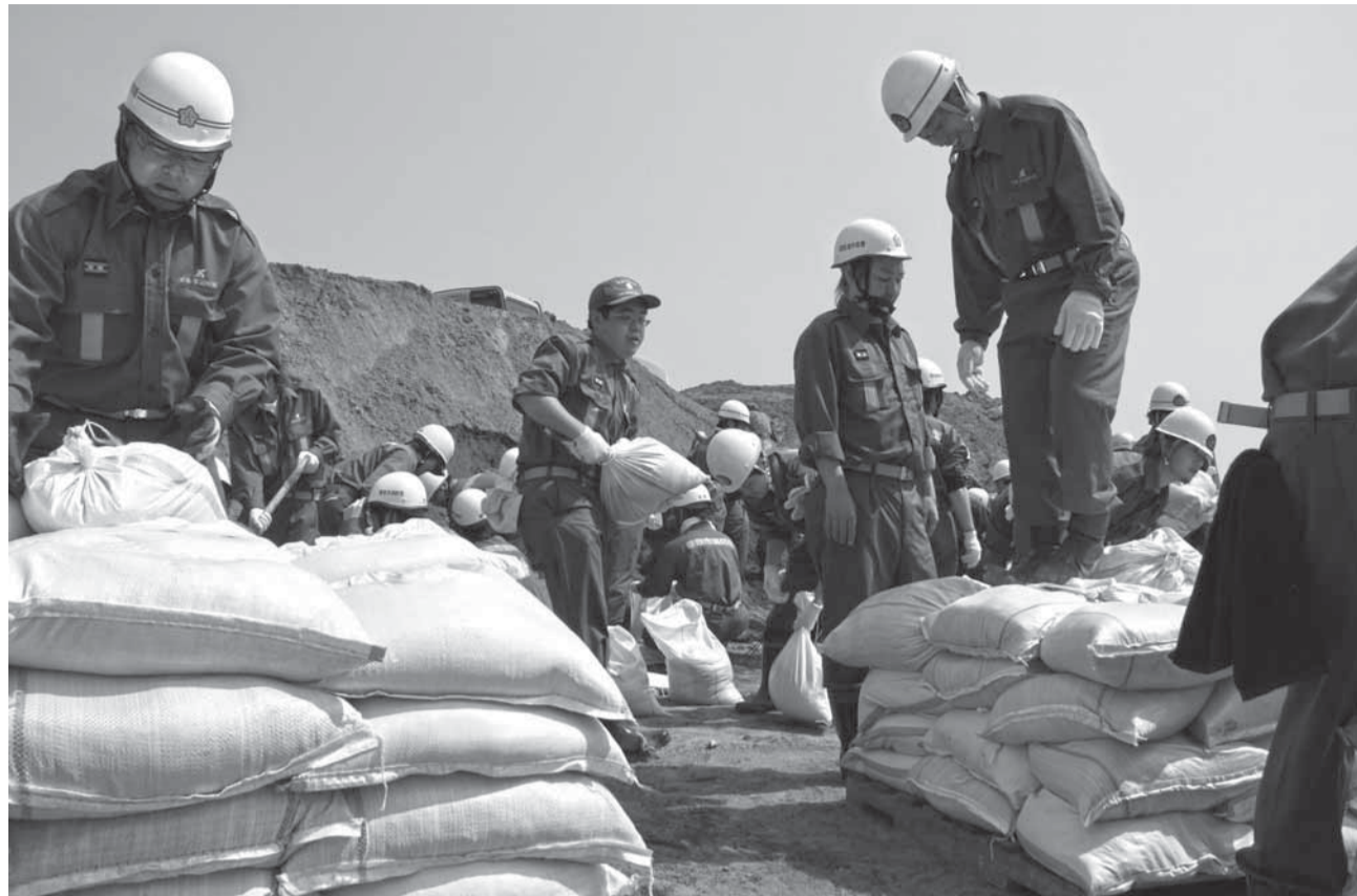
▲各地区で行われた消防団による土のう作り