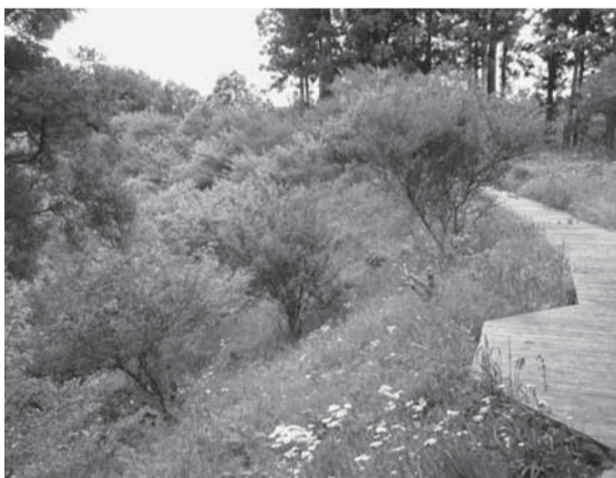
▲阿玉台貝塚近景(散策路と梅林)

市の北部を流れる利根川流域の台地上には、数多くの貝塚が残されています。明治時代以降、多くの研究者が当地を訪れて発掘調査を行い、その成果を学界で発表したこと、全国的に著名な貝塚も少なくありません。