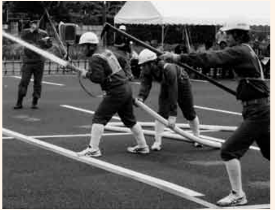
▲山田支団第3分団第1部(新里)による操法演技

財千葉県消防協会香取支部のポンプ操法大会が、6月27日に東庄町役場駐車場で開催され、香取郡市の各市町代表消防団が参加し、日ごろの訓練で培った操法技術を競い合いました。