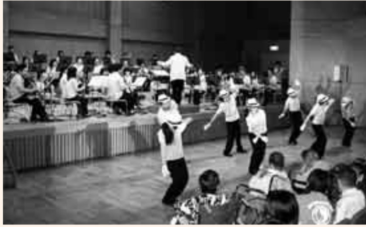
▲小見吹の熱血ダンスチーム「ブレス」による華麗(?)な舞いも披露

七夕にかけた夏の風物行事「サマーコンサート」が、7月4日に山田中学校吹奏楽部と小見川吹奏楽団のジョイントにより、山田公民館で開催されました。今年から、帰路における子どもたちの防犯面を考慮して、開催時間を夜から昼に移行し、サマーナイトをサマーコンサートに改名しての開催となりました。開催時間の変更により、当初は観客の大幅な減少も心配されましたが、コンサートの人気は根強く、来場された大勢の観客たちは、素晴らしい演奏に聞き入っていました。