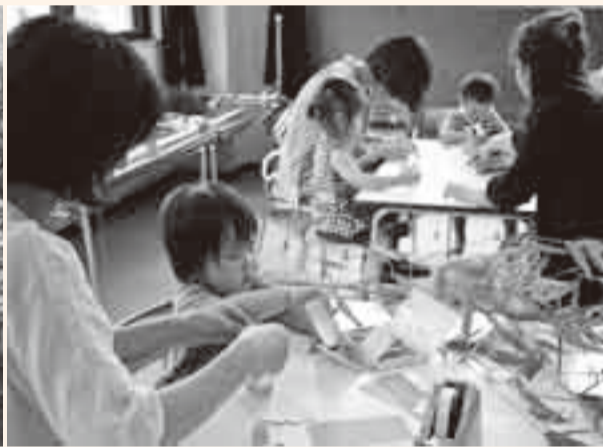
▲山田児童館の幼児教室では、7月7日の七夕当日に合わせ、親子で七夕飾り作りが行われました。この日の力作は、星に願いを込めて自宅に飾られました。