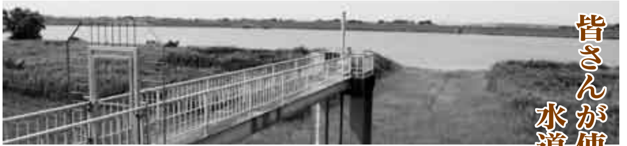
▲利根川から水を取り込む飯島取水場