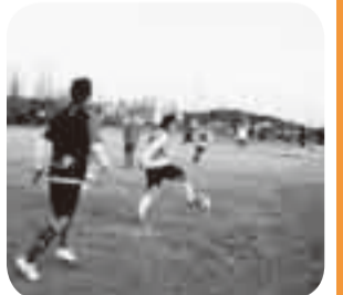
▲夕闇迫るサッカーグラウンド!