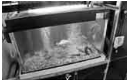
▲金魚の力も借りて確認

市には5カ所の浄水場があり、3カ所で川の水を取りこみ、2カ所で地下水を汲み上げて水道水をつくっています。この水道水のもとになる水に、体に害がある重金属や農薬などが含まれていないか検査し、更に、水の安全をチェックする方法として「パイオアッセイ法」を取り入れています。これは、川から取り入れる水で金魚を飼い、その動きを観察しているものです。もし生物に害がある物質が含まれていれば、金魚がいつもと変わった反応をします。金魚が暴れた場合には、取水を一時的に止めて、水質検査を行うなど、水道水の安全を確認しています。その他にも、川の水、地