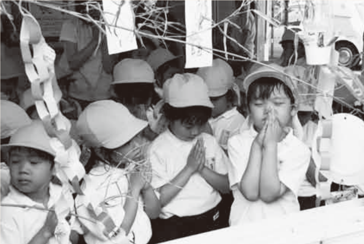
▲毎年恒例の小見川幼稚園園児によるJR小見川駅への七夕飾り設置が、7月2日に行われました。園児たちは「願いごとが叶いますように」と、星に願いを込めて手を合わせました。