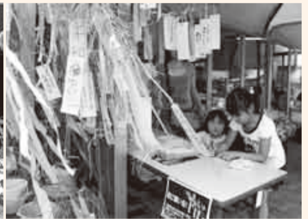
▲道の駅くりもとの七夕まつりが、7月3日・4日に開催され、願いが記された短冊が来場者を出迎え、天の川にちなんだ流しそめんなどでにぎわいました。