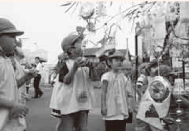
▲神道山ボランティアクラブの働きかけにより、津宮幼稚園、津宮小学校、香取中学校、津宮11区子供会の子どもたちによる七夕飾りが、6月30日にJR香取駅に飾られました。