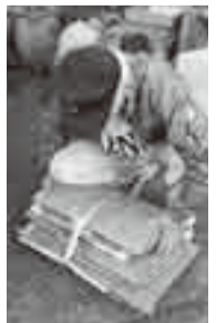
紙パック収集方法の変更

4月1日(木)から、資源物の取り扱いが市内統一されます。資源物の出し方は、ごみの収集日カレンダー・ごみの分け方(3月上旬回覧)を確認して排出してください。資源物は「ビン」「カン」「ペットボトル」「紙類」「ダンボール、紙パック、新聞」