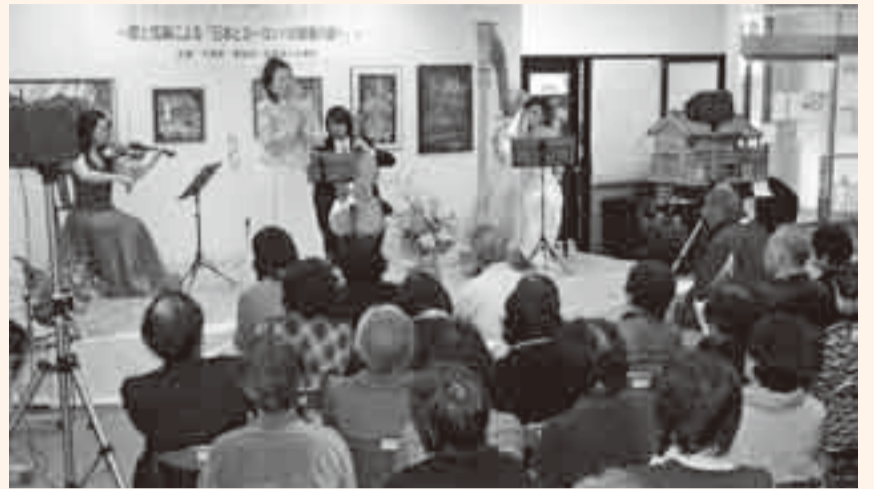
▲美しい歌声に時がたつのも忘れ聴き入る聴衆

「日本とヨーロッパの新春の調べ」と題し、1月30日に佐原町並み交流館で、ニューフィルハーモニーオーケストラ千葉による、歌と弦楽による「軒先コンサート」が開かれました。