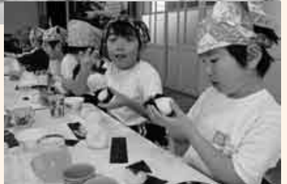
▲のりを巻いたらおにぎりの出来上がり！

園児たちは、バケツで育てた稲から収穫した米と、売れる米づくり研究会提供の米を使用して、米のとぎ方や、アツアツのご飯でのおにぎり作りを体験し、自分たちで収穫した米を自らの手でおにぎりにして食べることで食への関心を高め、ご飯のおいしさ、食べる楽しさを学びました。