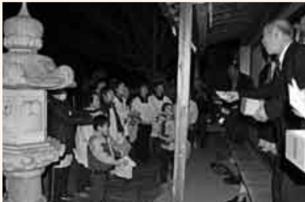
▲下小堀不動尊（下小堀）