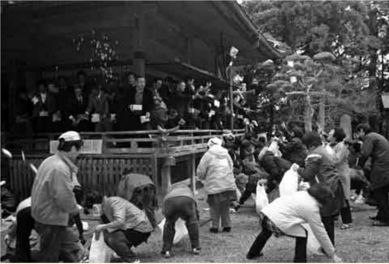
▲愛宕神社（府馬）の節分祭