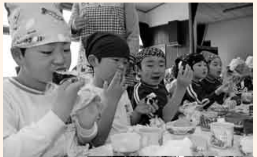
▲おにぎりのおいしさに思わずほお張る園児たち

米の消費拡大と食育の指導を兼ねた「おにぎり教室」が、1月28日に佐原幼稚園で開催されました。