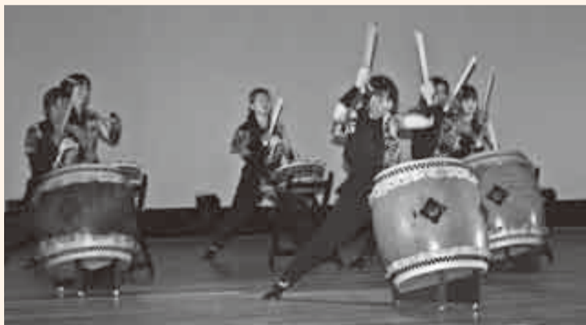
▲和太鼓「響」による体に響き力強い演奏

生涯学習への意欲を高め、誰もが参加できる場の提供として、2回目となる「生涯学習フェスティバル」が、2月7日に佐原文化会館を主会場に開催されました。ステージエリアでは、さまざまな団体が日ごろの練習の成果を発揮し、躍動感あふれる歌や踊りを披露しました。