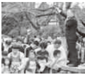
▲第1回香取小江戸マラソン(12月13日)