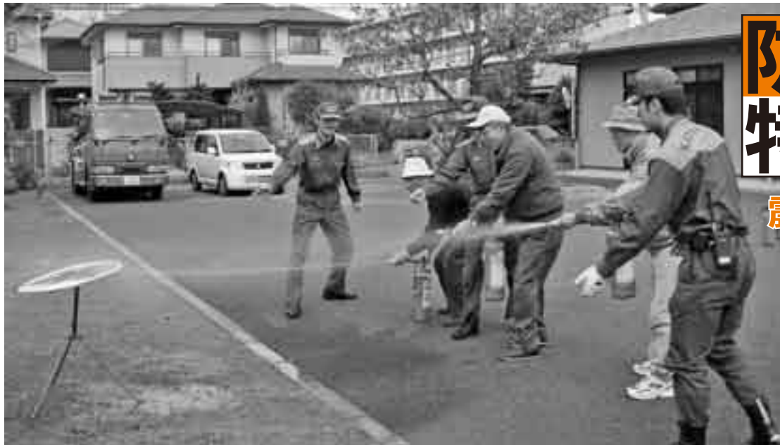
▲水郷町第1自主防災会で行われた防災訓練(平成21年12月5日)