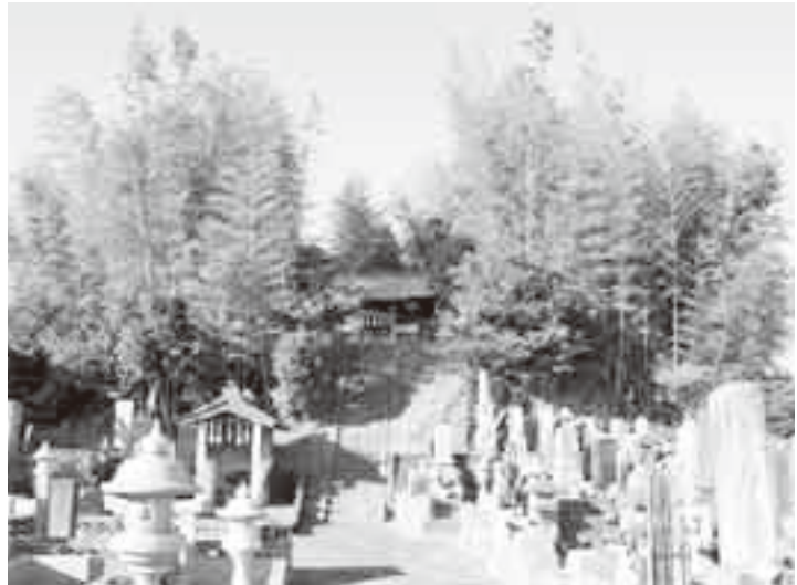
▲大法寺古墳(東から)

大法寺古墳は、大法寺の境内にあります。その頂には御堂が建立され、かなり高さのある円墳のようにみえますが、周辺の地形などの観察から、全長約60mの前方後円墳と考えられています。西側が前方部、東側が後円部で、主軸方向はほぼ東西です。