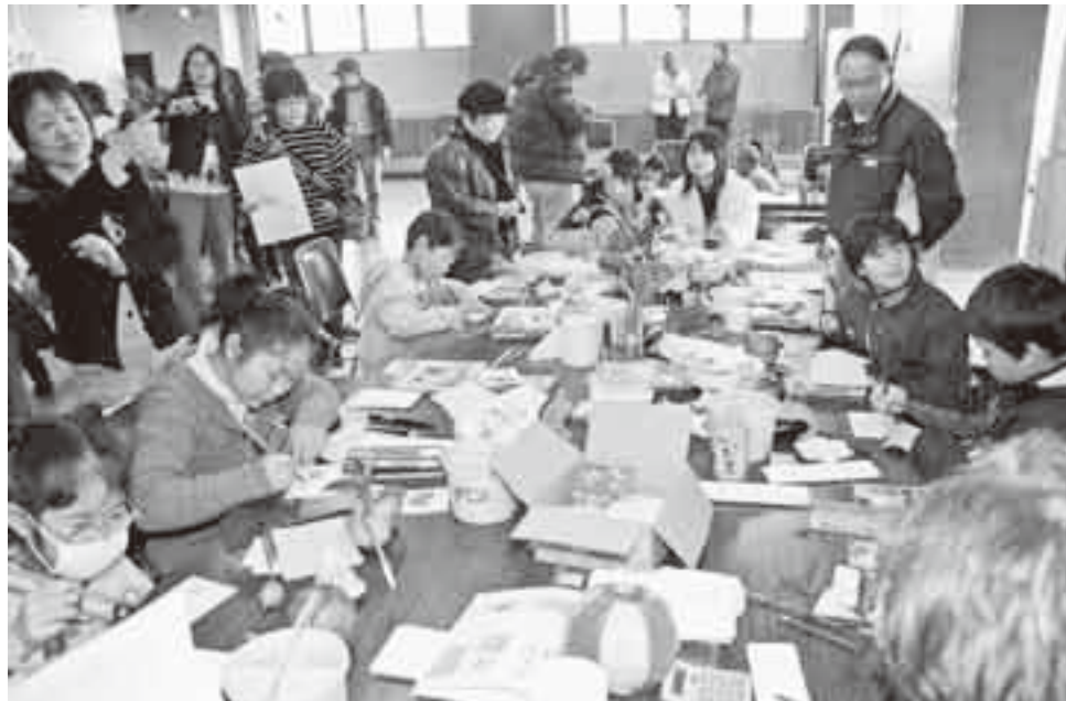
▲昨年行われた生涯学習フェスティバル