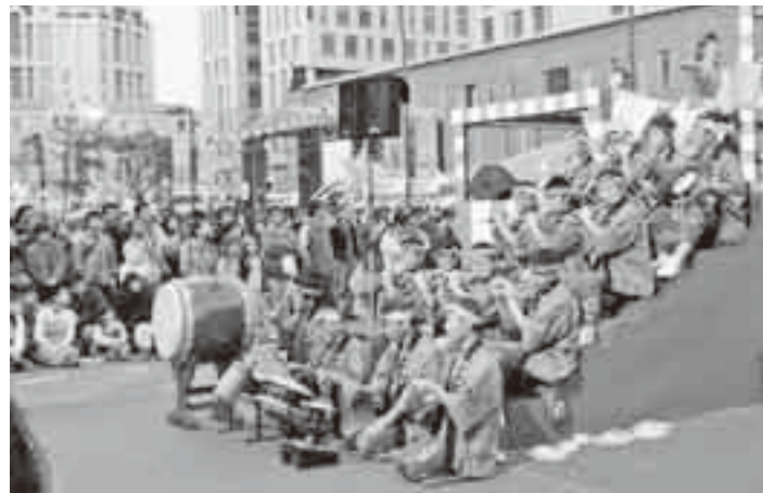
▲台北市民に披露された佐原囃子