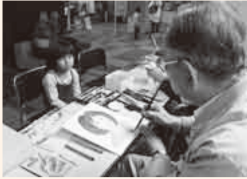
▲本物そっくり!?似顔絵コーナー