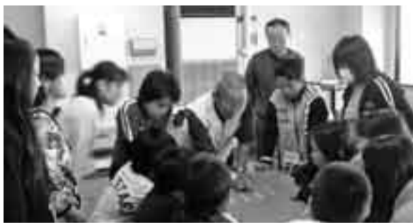
▲竹トンボ作り体験の様子