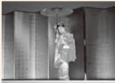
▲艶やかな着物姿でかわいらしく舞を披露