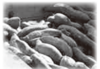
▲巨大せいろのふかしいも