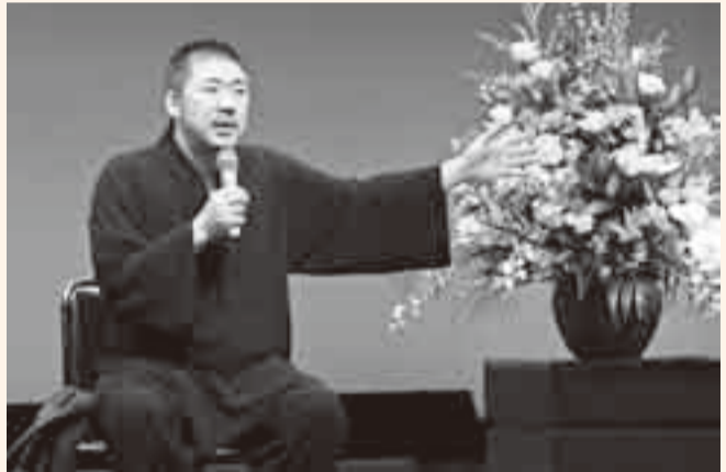
▲経験談を交えた軽快なトークで聴衆を惹きつけました

自慢のオリジナル曲でよさこい鳴子踊りを競う「おみがわYOSAKOI 2009」が、11月8日に小見川区事務所駐車場をメイン会場に開催されました。 県内外から25チーム約800人が参加し、観客からの威勢良い掛け声の中、華麗な演舞が披露されました。