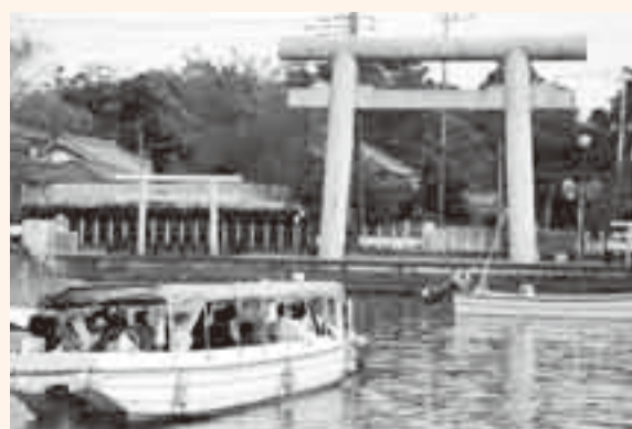
▲小見川から小舟に揺られ神栖市の息栖神社に到着

「小舟とバスで巡る東国三社詣モニタリングツアー」が、11月5日、応募者25人が参加して行われました。