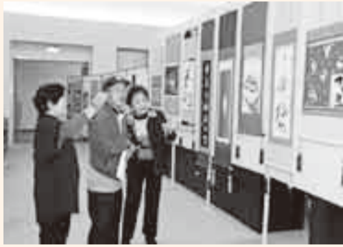
▲作品を引き立てる名脇役「表装」展示