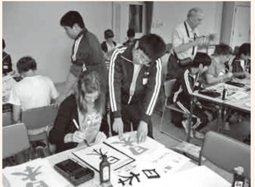
▲日本文化の書道をとおして交流を深めた栗源中学校生徒たち

オーストラリア・レイクマッコリー市のセントポールズ・ハイスクールの生徒ら20人が、10月19日から21日まで、香取市を訪れ、栗源中学校生徒との交流やホームステイ家族との友好を深めました。