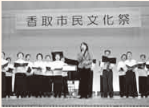
▲本格的な混声合唱団によるコーラス

第1回目となる「香取市民文化祭」が、文化の日を中心に開催されました。地域文化の特性を生かし、多くの市民が参加して鑑賞できるよう、各区の公民館などを会場に開催され、さまざまな芸術文化活動の成果が披露されました。 佐原文化会館では、かわいらしいバレエや舞踊、吟詠などの発表。小見川区事務所では、県内でも珍しい刻字や表装の展示。山田公民館では、苔玉が美しい山野草やパンの花が展示され、各会場特色ある発表や展示が行われました。 来場者は、多様な芸術文化に触れ、芸術の秋を満喫しました。