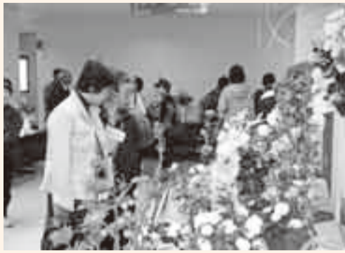
▲華やかな生け花の展示