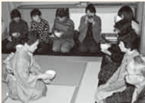
▲茶道をとおり日本文化のわびとさび体験