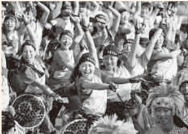
▲独創的な演舞で3年連続優勝を果たした「黒潮美遊」

自慢のオリジナル曲でよさこい鳴子踊りを競う「おみがわYOSAKOI 2009」が、11月8日に小見川区事務所駐車場をメイン会場に開催されました。 県内外から25チーム約800人が参加し、観客からの威勢良い掛け声の中、華麗な演舞が披露されました。