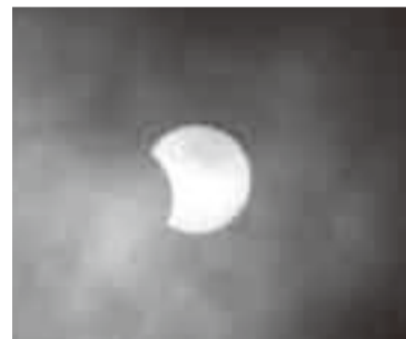
▲雲間から覗く太陽

6分を超える今世紀最長の皆既日食が、7月22日に観測されました。市内では部分日食の観測となり、水郷小見川少年自然の家では、この天体ショーを観測するイベントが行われました。