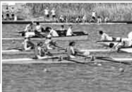
▲ウォーターマンとして活躍する高校生