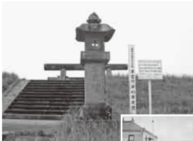
▲津宮河岸の常夜燈