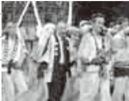
▲愛宕神社(府馬)夏まつり(7月18日)