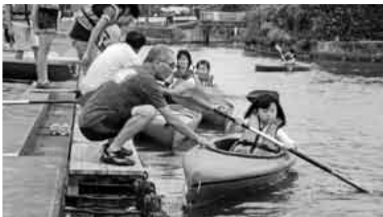
▲初めてのカヌーにドキドキ

ルーまで、熱漕戦が繰り広げられ、川岸からは「がんばれー!!」と熱い声援が選手たちに送られました。