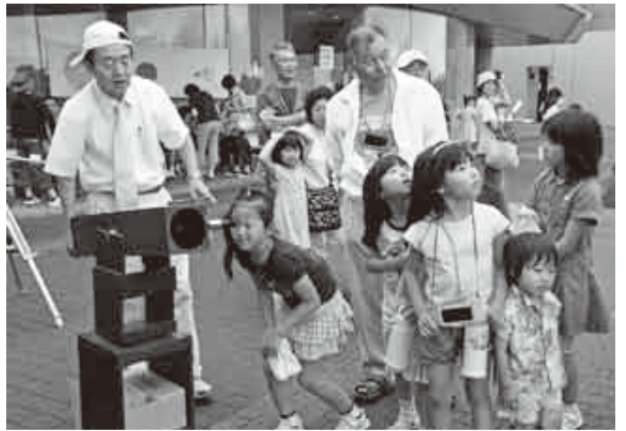
▲期待を胸に空を観察する子どもたち

6分を超える今世紀最長の皆既日食が、7月22日に観測されました。市内では部分日食の観測となり、水郷小見川少年自然の家では、この天体ショーを観測するイベントが行われました。