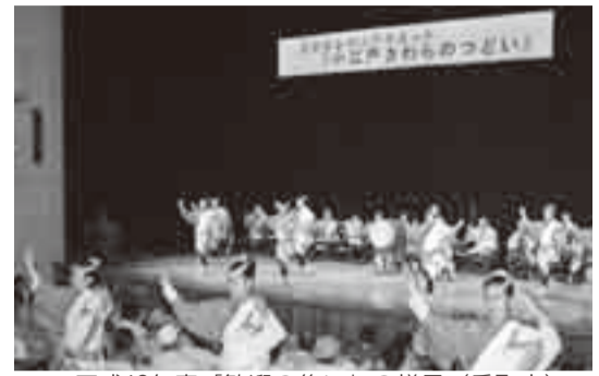
▲平成18年度「歓迎の集い」の様子(香取市)

佐原・川越・栃木は、江戸との舟運で栄え、今もなお当時の町並みや風習が残ることから「小江戸」と称されています。歴史的町並み山車祭りなど多くの共通点を持つ小江戸3市は、平成8年から毎年、持ち回りでサミットを開催し、交流を続けています。