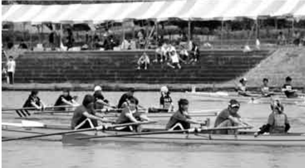
▲力いっぱいオールを漕ぐ選手たち