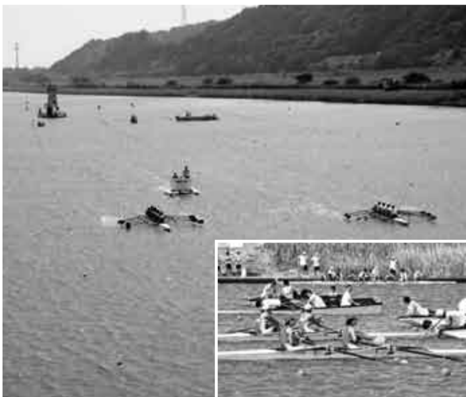
▲国体リハースル大会会場となった小見川ボート場

また、地元高校生たちが、ウォーターマン(スタート時の補助員)として大会運営のお手伝いをしました。