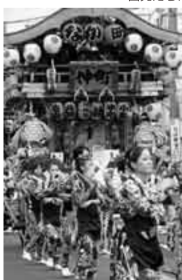
▲各町内による手踊りの披露

黒部川を灯す夏の風物詩、イルミネーションの点灯式が、7月18日に行われました。小見川幼稚園の園児たちがスイッチを押すと、子どもたちの願いが書かれたぼんぼりが灯り、黒部川の川面を美しく彩りました。また、点灯式では、フラダンスやよさこい鳴子踊り、小見川祇園祭の屋台4台が点灯式を盛り上げました。