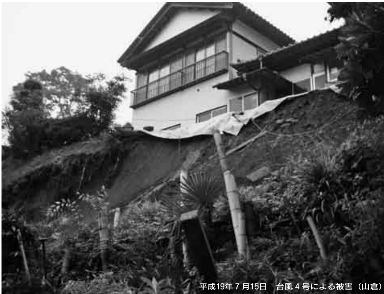
平成19年7月15日 台風4号による被害(山倉)