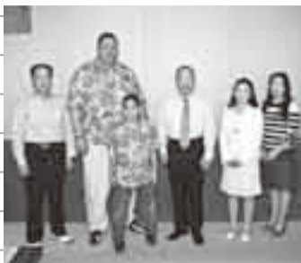
▲曙さんが表敬訪問(4月9日)