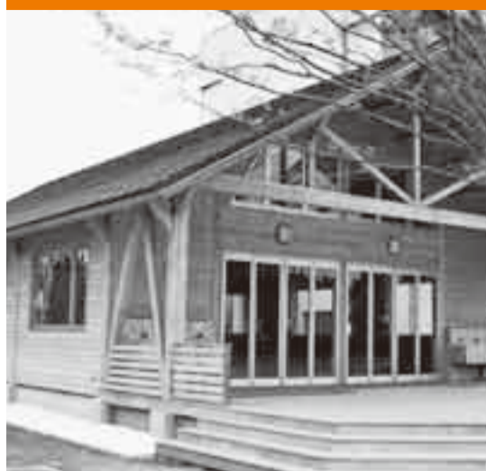
▲栗源小学校の図工教室棟

市では毎年5月と11月に、市民の皆さんが納めた税金、地方交付税、市債(歳入)がどのように使われたか(歳出)を知ってもらうため、市の財政事情を公表しています。今回は、平成20年度予算の平成21年3月末時点の執行状況をお知らせします。