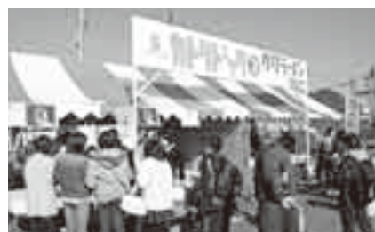
▲地元特産品を使った新名物カトリドックとサワラーメン