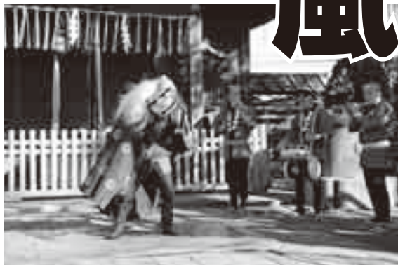
▲八坂神社で行われる奉納寿獅子舞