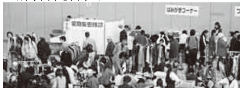
▲体育館で行われた健康づくり大会とフリーマーケット