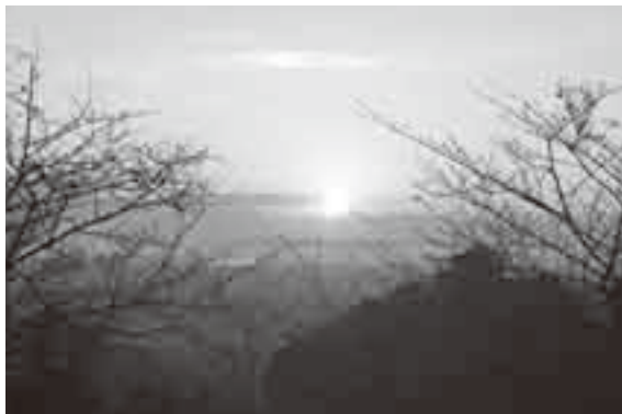
▲城山公園からながめる日の出