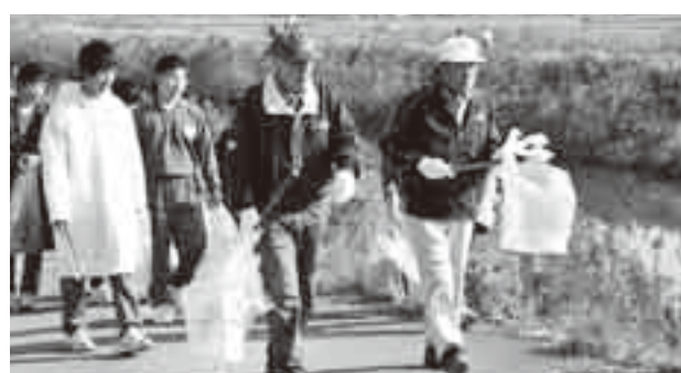
▲黒部川沿いをゴミを拾いながらのウォーキング

「黒部川をふるさとの川にする会」による「黒部川クリーンウォーキング」が11月15日に行われました。高齢者クラブの人たちや、日ごろ部活動で黒部川を利用している小中学生など、大勢の人が参加し、ゴミを拾いながらの河畔散策を楽しんでいました。このイベントは、毎年2〜3回実施されています。