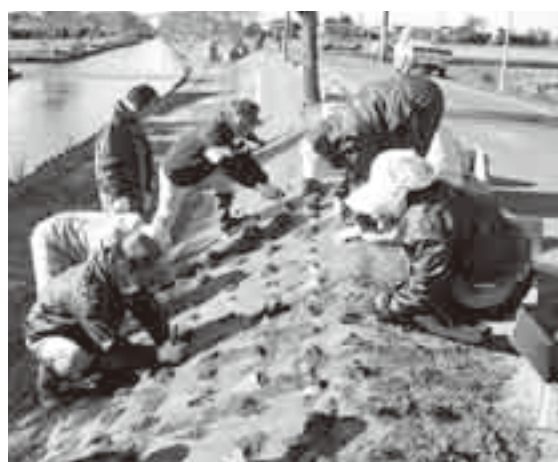
▲芝桜を植える加藤洲地区の人たち

与田浦を訪れる人たちに「あやめ」の時期以外にも花を楽しんでもらおうと、11月23日に加藤洲十二橋水路周辺で、芝桜の植栽が地元市民の協力により行われました。芝桜を植栽することにより、花の美しさを楽しむだけでなく、雑草の繁殖も抑えることができます。今後の新たな観光スポットとして期待されます。