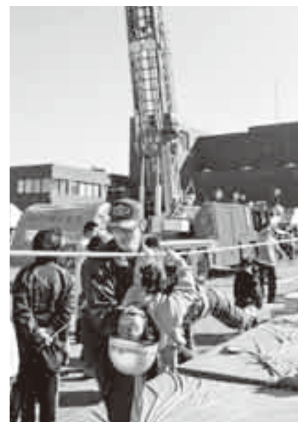
▲消防士とロープ渡過体験