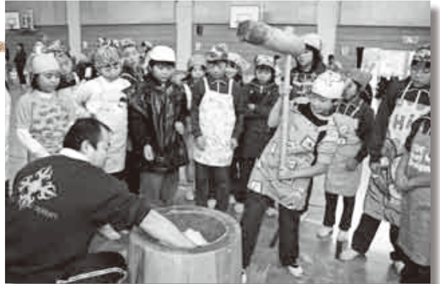
▲各地で行われるもちつき大会