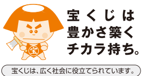
宝くじは、広く社会に役立てられています。

同財団では、宝くじの普及広報を目的として、コミュニティ助成事業やシンポジウム等助成事業などの各種事業を実施、支援しています。