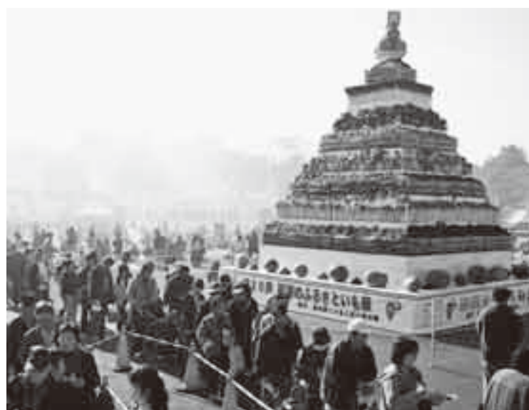
▲第20回を記念し制作した超巨大野菜タワー

また、「ふるさとフェスタさわら」でも地元特産品の販売や無料配布が行われ、大勢の人が列をつくっていました。