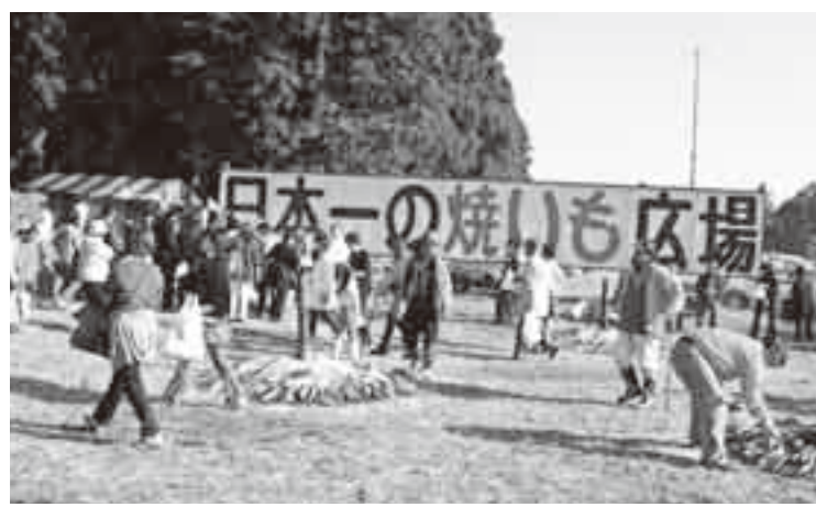
▲大勢の人で賑わった日本一の焼きいも広場 栗源産ポークを使った大なべ豚汁 ▲ 焼きいもを販売する中学生にインタビューする堂本知事 ▶