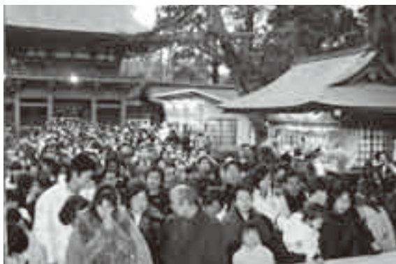
▲初詣客でにぎわう香取神宮