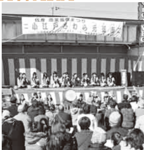
▲郷土芸能を披露する子どもたち