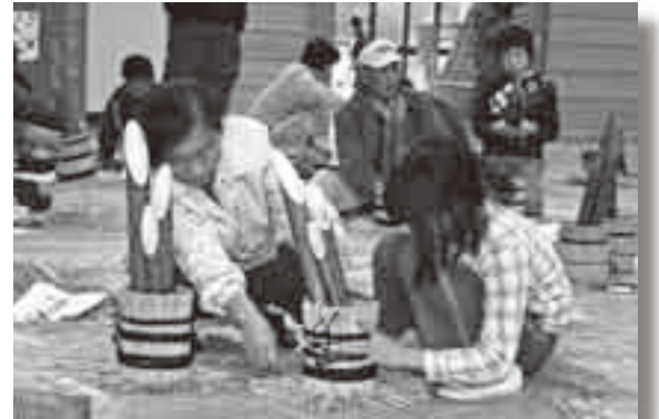
▲小学校で行われるミニ門松づくり

市内のさまざまな場所でイルミネーションを見ることができます。皆さんも新たなスポットを探してロマンチックな夜を過ごしませんか？