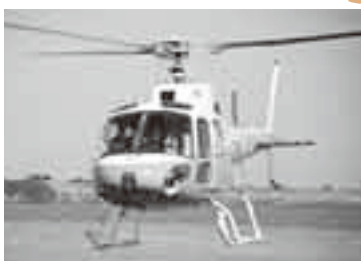
▲ヘリに乗って大空遊覧