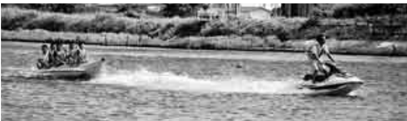
▲スリルが味わえるバナナボートは子どもたちに大人気

また、ミニレース終了後は参加者待望のバナナボート試乗会が行われ、参加者を乗せたボートが急カーブを描くと、歓声や悲鳴とともに川に投げ出される子どもや、最後までしがみついていた子どもたちの姿が見られました。