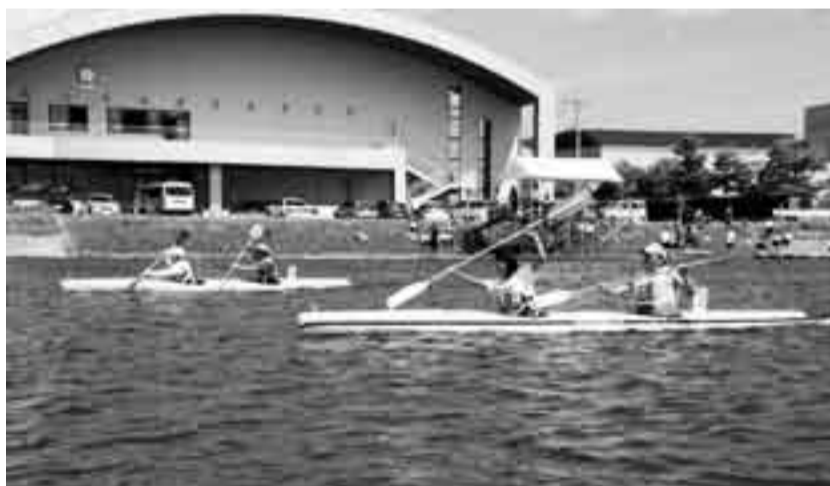
▲息のあったパドルさばきでゴールを目指す

黒部川水上スポーツフェスティバル2007が9月16日に黒部川特設カヌーコースで開催されました。