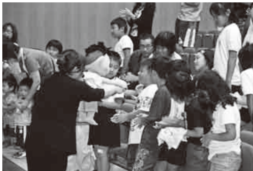
▲人形劇に参加する子どもたち

人とのふれあいや思いやりの気持ちを育ててほしいとの願いから行われている「TEPCOおはなしキャラバン」人形劇が9月19日に、山田公民館で開催されました。この人形劇は、子どもたちと作り上げていく参加型の人形劇で、今回の公演は、田んぼをテーマに米づくりの大変さと自然のめぐみへ感謝する気持ちを持ってくれるようにとメッセージが込められたものでした。