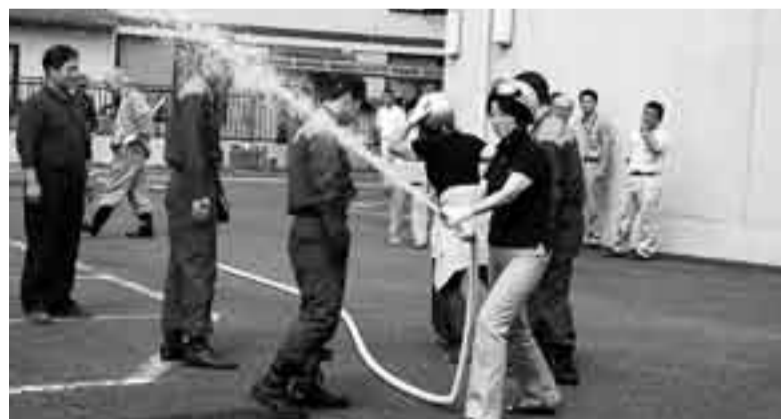
▲消火栓を使用した訓練

残暑の厳しい中、参加者は黄金色になった稲を一株ずつ、鎌を使って稲刈り体験を楽しんでいました。