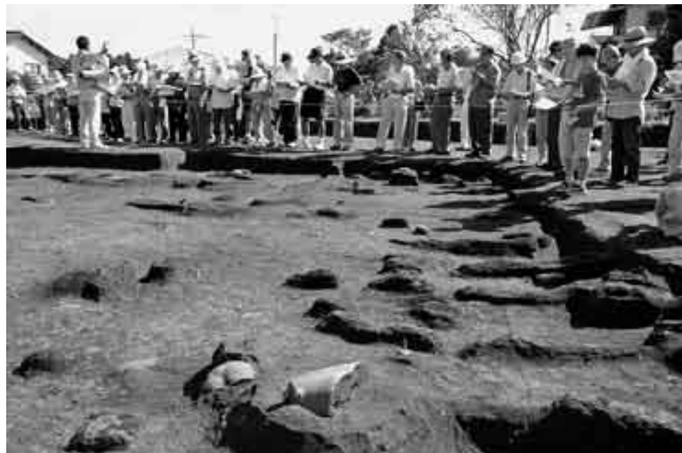
▲発掘現場の説明を聞く参加者たち