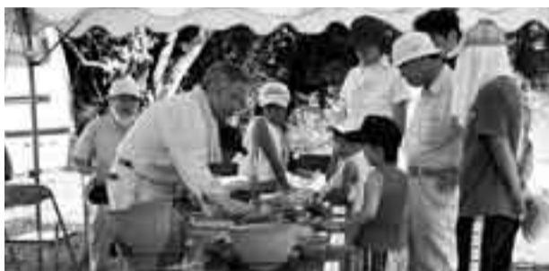
▲出土した土器を見る子どもたち

普段見る機会のない遺跡発掘現場では、参加者たちが写真を撮ったり、説明をメモしたりする姿が見られました。子どもたちは出土した土器に興味津々で、熱心に説明を聞いていました。