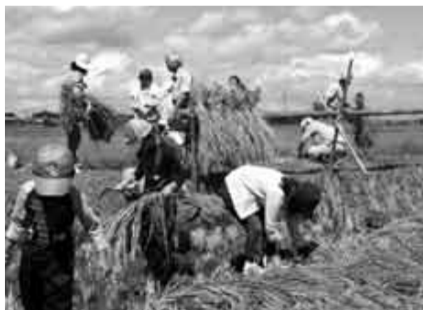
▲初めて稲刈りを体験する子どもたち

小見川スポーツコミュニティセンター近くの水田で、9月15日に「ふれあい田んぼ教室」が開催されました。これはJAが主催しているもので、東京や神奈川など首都圏の親子が、春に自分たちで田植えをして、秋に稲刈りをするというイベントです。