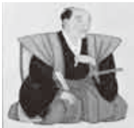
▲間重富肖像画 (大阪歴史博物館所蔵)

には彼が使用した器具の製作にも関わっていました。また、大阪と江戸で天体観測を行い、数多くの観測記録を残しています。 忠敬は文化2年(1805)に西日本測量に出発しますが、重富は忠敬より前に、大阪から長崎までの道を測量していました。忠敬が緯度1度の距離を求め、忠敬の全国測量のとき