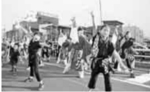
▲華麗な演舞のおみが和よさこい会和気蒭々