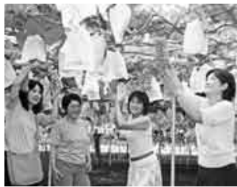
▲くだもの狩りの魅力はその場で食べられること

8月も残り2週間、しかし、香取市の夏はまだまだ終わりません。市の特産品でもある「ぶどう」や「なし」は旬をむかえており、夏休み期間中は、市内でぶどう狩りやなし狩りを楽しむ人たちが訪れ、旬の味を堪能しています。なし狩りやぶどう狩りは9月中旬ころまで楽しめるそうです。