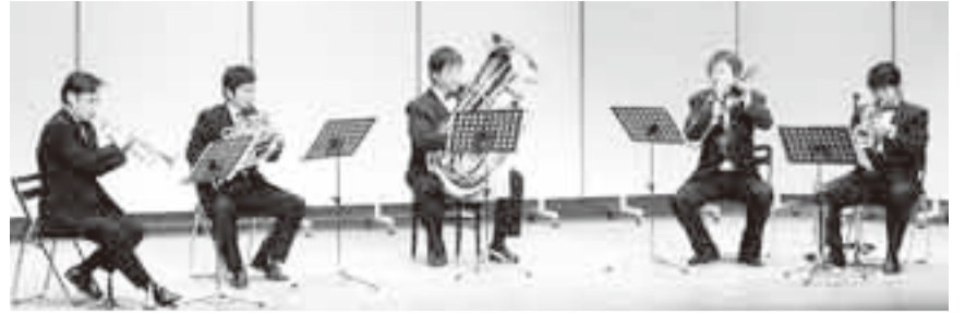
▲「らっぱのがっそう」サンク・エトワールの皆さん