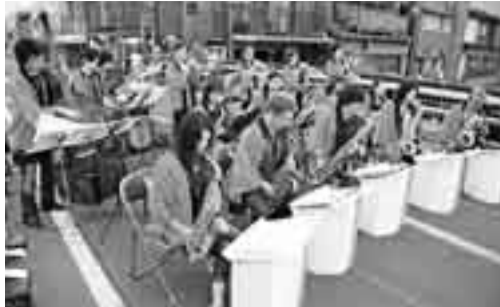
▲ Amazing Brass によるジャズコンサート