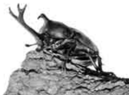
▲園には体の大きなカブトムシがたくさん

また、道の駅くりもとにある「かぶとむし園」からは、多くの子どもたちの声が聞こえます。子どもたちは、今も昔もかぶとむしが大好き。自分たちで山から採ることにおおはしゃぎで、採ってきたかぶとむしの大きさを競い合う姿が見られました。