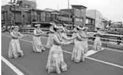
▲オミガワ・フラ・サークルのハワイアンダンス