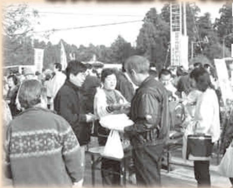
▲山田区事務所前で開催している「元氣市」

朝市って、かなり、相当…面白いです。朝とつたばかりの野菜や、できたての農産加工食品など美味しいものがいっぱい。値段はというと、これがまた安い。そんな市内の朝市(夕市)を探検してみたいか、がでしょうか?。