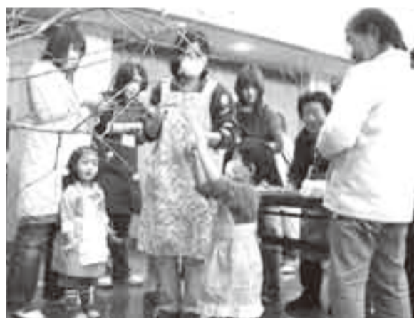
▲願いを込めて飾り付けをする参加者

1年の農作物の豊作や家族の幸せと健康を願う伝統行事「だんごならし」が、栗源公民館で1月12日に行われました。