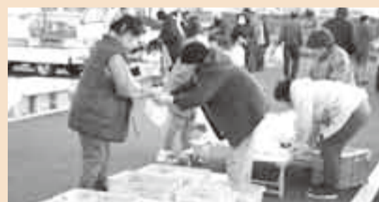
▲佐原朝市は佐原コミュニティセンターで開催

開催、第4日曜日 10時〜15時 佐原町並み交流館 園農政課 ☎(50)1258 第2・4土曜日 9時〜11時30分 薬師堂境内(佐原イ) 園東通り商店会 大川 ☎(52)2351