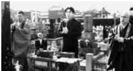
▲善光寺を訪れ墓参りする九代目松本幸四郎

役でめきめきと頭角をあらわします。元禄16年に森田座「23番柱磨」に平親王役、寶永3年(1706)に中村座「宇治源氏弓張月」の早大役、寶永6年に市村座「出世太平記」に篠塚五郎役、正徳3年(1713)には立役の上上吉に昇進。享保2年(1717)に中村座「鉢木豊年市」で青砥左衛門役で大当たり、享保4年、森田座「傾城紫手綱」で荒岡源太役。享保8年中村座「鉢木女御教書」で青砥左衛門役、同年に20年ぶりに舞台で2代目市川團十郎と対面し口上を述べます。享保11年初代市川團十郎の23回追善興行の中村座「門松四天王」に坂田公時役、享保14