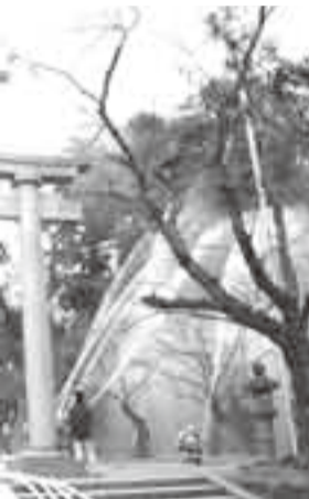
▲山林火災の消火訓練

香取市には、楽しいイベントや出来事が盛りだくさん。ここでは、そんなホットなまちの話題をご紹介します。