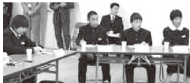
▲意見などを書き取る生徒

香取市って どんなところ? ▼自然が豊かで、農産物が豊富▼文化や伝統など自慢できるものがある▼緑が多くゆったりと過ごせるところ▼季節の移り変わりがよくわかる▼花火や水上スポーツが盛ん▼各地区で祭りが盛ん 香取市に 課題はある? ▼香取市として各地区の理解が足りないと思う▼働く場所が少ない▼香取市内に産科がない