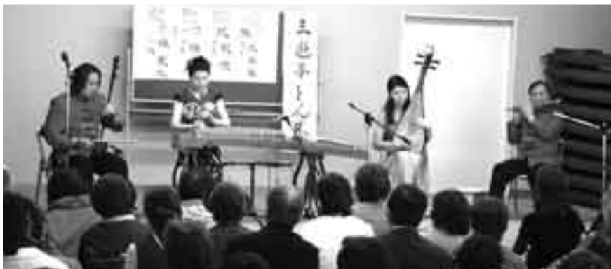
▲独特な音色で演奏を披露するグループ風雅

二胡、古箏、琵琶、笛子の4人からなる「グループ風雅」による、中国音楽鑑賞会が1月21日に、小見川福祉センターさくら館で開催されました。