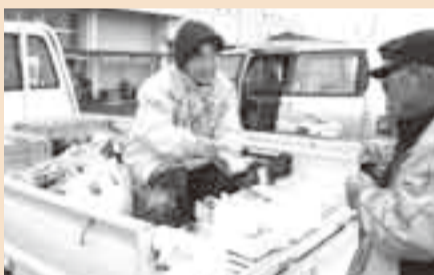
▲小見川朝市にも多くの農産物・特産品が並び

毎週日曜日 6時30分〜7時30分 小見川B&G海洋センター駐車場 園④農政課内小見川朝市会事務局 ☎(82)1116