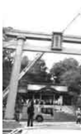
▲はしご車を使用し

文化財防火デー(1月26日)にさきがけて1月20日に、香取神宮で文化財防衛演習が行われました。香取神宮には、国宝、国の重要文化財、県指定文化財など200点を超える文化財があり、これらを災害から守るため、消防署、香取神宮自衛消防隊、地元消防団が参加、協力し、放水訓練や救助訓練、消防車を出動させた本格的な訓練となりました。「文化財防火デー」って? 昭和24年(1949)1月26日、修理中だった奈良の法隆寺金堂で、火災が起き、金堂初層内部の柱と、日本最古のものと思われる壁画を焼損してしまいました。こうした残念な出来事を二度と起こすまいと、昭和30年に文化財防火デーが定められました。