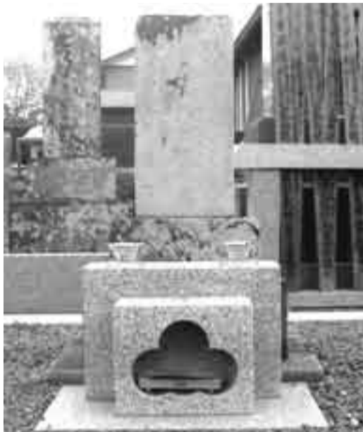
▲善光寺にある初代松本幸四郎の墓石

初代松本幸四郎は、延宝2年(1674)に香取市外浜の嶋田家(屋号は菱倉)に生まれ、幼名を小四郎と名乗っています。元禄元年(1688)江戸に出て、久松多四郎の門下となり、舞台初名は久松小四郎の名で