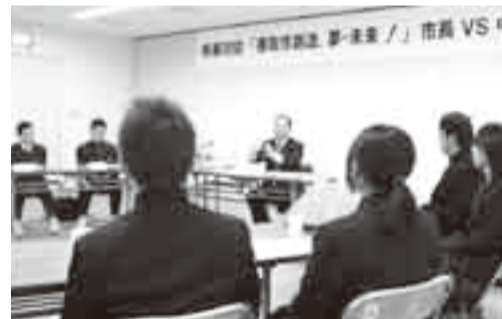
▲市長の話を熱心に聞く生徒たち