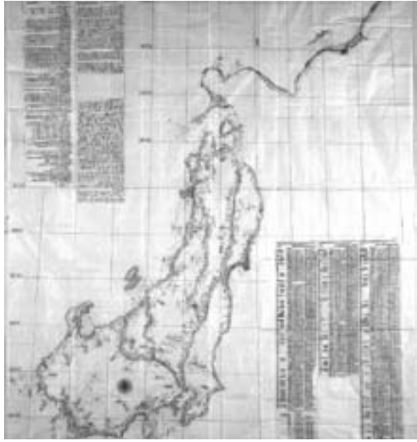
▲鷹見泉石が書き写した伊能凶