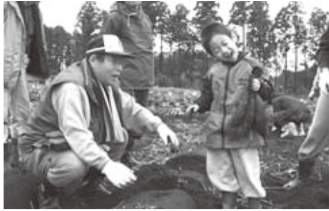
▲道の駅くりもとでイモ堀り体験

近くても意外と知らない、行ったことがない所への旅。香取のさまざまな顔と出会うバスツアーの第2弾は、秋の味覚、サツマイモ堀り体験と、県内外から集まる約1000人の踊り手による「よさこい鳴子踊り」の見学です。香取の秋の風物詩をお楽しみください。 ■対象 香取市民 ■期日 11月12日(日) ■集合場所と時間 市役所前8時50分 栗源区事務所前9時10分 ■日程と見どころ ◇9時 市役所出発 ◇9時20分 栗源区事務所経由 ◇9時30分～10時40分 道の駅くりもと「紅小町の郷」でイモ堀り体験 掘ったイモは5kg箱詰め放題でお土産に。畑から徒歩5分の道の駅