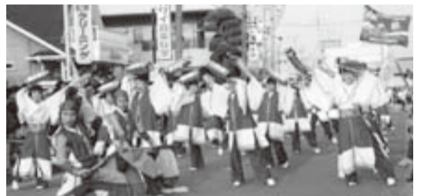
▲各チームの躍動感ある踊りを見学

物産交流館には、全国の道の駅の銘産品が勢ぞろい。 ※雨天時は簡単な炭アクトに挑戦 ◇11時～12時20分 農産物直売所・レストラン「風土村」 新鮮野菜盛りだくさんのランチバイキング ◇12時40分～15時40分 「おみがわYOSAKOI」見学 小見川区事務所着。「香取市菊花大会」観賞後、歩いて10分の駅前通り会場へ。大賞を競う華やかなパレードを見ながら、小見川の街を自由散策。※小雨決行。荒天時は小見川文化会館