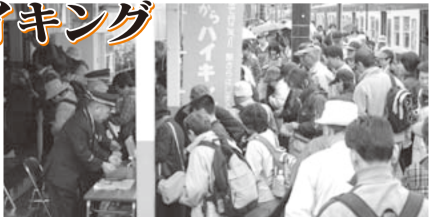
▲ハイキングはJR香取駅からスタート

香取駅→神道山古墳→香取神宮→観福寺→伊能忠敬記念館→水郷佐原山車会館→忠敬茶屋→東薫酒造→ふるさとフェスタさわら会場(コミュニティセンターおよび佐原駅北駐車場)