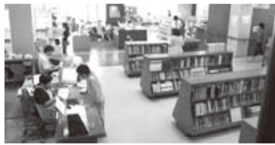
▲佐原中央図書館館内

図書館カウンターに備え付けの『予約・リクエストカード』に必要事項を記入し、申し込みください。問い合わせ 佐原中央図書館 ☎(55)1343 小見川図書館 ☎(80)0511