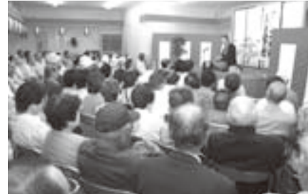
▲身近に落語を楽しめる寄席会場