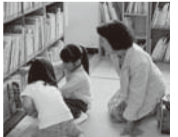
▲畳コーナーがある小見川図書館

農業委員会委員選挙の立候補予定者説明会 任期満了に伴う農業委員会委員選挙が9月24日(日)に行われる予定です。この立候補予定者説明会を次のとおり行います。 立候補に必要な書類を配布し、各種届出書の記載方法や、選挙運動などの説明を行います。 ■日時 8月7日(月) 14時～ ■場所 香取市役所5階大会議室 ■持ち物 印鑑 問い合わせ 香取市選挙管理委員会 ☎(50)1227