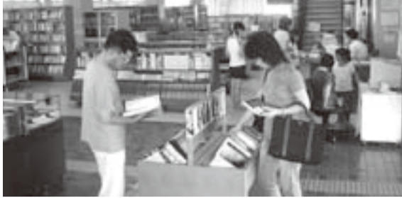
▲佐原中央図書館内

いよいよ夏休みが始まります。子どもとじっくり付き合える時です。この機会に子どもを本好きにしてあげてください。本は子どもの心を豊かにします。なるべく早い時期から本を楽しむ習慣を持ち、本好きの子どもに育てるためのコツを教えます。