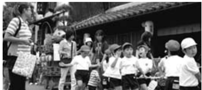
▲元気な掛け声で山車を引っ張る園児たち

佐原幼稚園と佐原保育所の園児とその保護者約160人が、6月13日にミニ山車の引き廻しを行いました。 園児たちは各園に寄贈されたミニ山車を、出発の合図とともに綱を握り、小野川沿いを「わっしょい、わっしょい」と元気よく、大きな掛け声で練り歩きました。 小野川沿いを散策していた観光客たちからは「かわいい」「ちびつこのお祭りが見れてよかった」などの声がかれました。