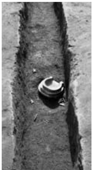
▲大戸宮作古墳から出土した石枕と立花

香取市域では、約4000年で500基ほどの古墳が造営されましたが、特徴的なこととしては、5世紀前半から6世紀前半にかけて、遺骸の埋葬時に石枕と立花を使用する葬送儀礼の盛行があります。 また、埴輪を樹立する葬送儀礼は5世紀中ごろの三ノ分目大塚山古墳が最古と