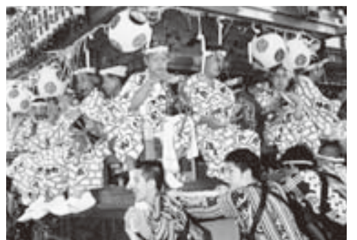
▲内野芸座連の乗る仲町の屋台(小見川祇園祭)