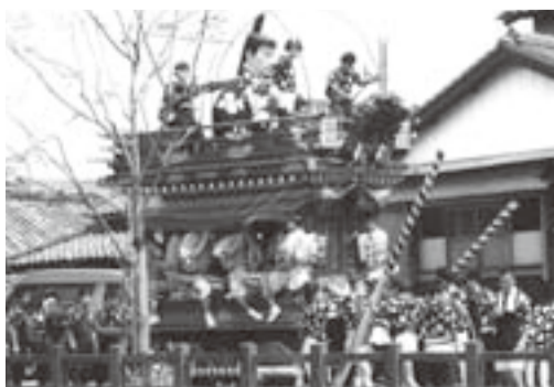
▲如月会が乗る下仲町の山車(佐原の夏祭り)

香川 下座を始められ たきっかけは何だった んですか。 多田 集落のオビシャ など、いろいろな行事 に参加するうちに自然 に覚えたんですよ。20 歳くらいから始めたん じゃないかな。約60年 続けていますよ。 香川 私は子どものこ ろから山車行事には参 加していたんですが、 お囃子にも興味があつ て、25歳くらいのとき に先輩に誘われて本格 的に始めたんです。楽 器は何を担当している んですか。 多田 大鼓です。小鼓 や笛も試したことがあ りますが、大鼓一筋で す。死ぬまで続けます よ。 香川 私も大鼓をやつ ているんですよ。大鼓 は一人でやらないとい けないから大変ですよ ね。 多田 大鼓は下座のテ ンポを早くしたり、遅 くしたりするのが自在 だから面白いんだよ ね。 香川 私もそう思いま すね。それだけ重要な 役割だということなん ですよ。 多田 それと掛け声が 重要だと教えられた よ。昔から牧野下座連 の掛け声は有名だった んだ。「毛成下座連の 笛、牧野下座連の掛け 声、内野芸座連のツケ (附縮小太鼓)」と言わ れていたんだよ。 香川 その話はよく聞 きますね。掛け声に よって笛が鳴りますか らね。 多田 気持ちこそろつ ていなければいい下座 にはならないんだ。い い下座を聞くと涙がで てくるよ(笑)。60年 やってるが仕上がら ないんだ。やればやる ほど難しくなる。とに かく稽古することしか ないよ。稽古さえしつ かりやっていけば、祭 りの本番でも疲れない んだよ。だから私たち は週2回稽古している んですよ。 香川 そうですね、練 習している人たちには かないませんね。しか し稽古したくても、ど の下座連も練習場所に は困っているみたいで すね。せっかく若い子 たちが入ってきてても、 近所の人たちに迷惑も かけられないから大変 みたいですよ。内野芸座 連も同じですか。 多田 場所よ りも内野流の 下座連は同じ 流派が少ない から下座連同 士で助け合う ことができな いところか な。今は牧野 流が多いからね。もつ と若い人たちに入つて もらいたいよ。 香川 祭りが好きと、 下座が好きなのは少し 違ふところがあるのか な。祭りが好きで下 座連に入ってきてても、 やめてしまう人も多い ですよ。本当に好きで ないと長くは続けられ ないんですよ。伝統 の灯を消さないように したいですね。内野芸 座連は歴史があると聞 いています。実際に 起源はいつごろなん ですか。 多田 詳しく調べては いませんが、2000年以 上前の大神楽が始まり だと聞いたこ とがあります。 そのころのお 囃子が今の下 座につながつ てきているん だと思いま すよ。今なら覚 えている人た