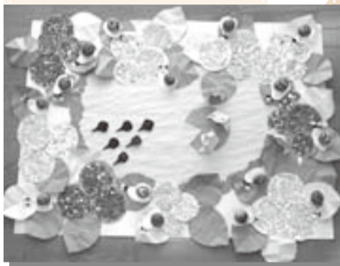
みんなで作った壁面製作