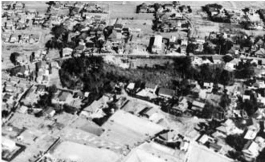
▲三ノ分目大塚山古墳（航空写真）

「古墳時代」という名称は、古代の高く盛り上げられた豪族のお墓から名付けられたものです。古墳時代は3世紀末から4世紀初頭に開始され、7世紀後半には終わりを告げます。時期の区分には諸説ありますが、ここでは4世紀代を前期、5世紀代を中期、6・7世紀を後期とします。