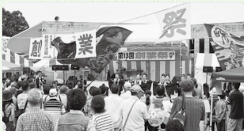
▲ステージイベントも大盛況

創業13周年を迎えた道の駅くりもとで創業祭が行われました。9月12日、13日は普段の人出に加え、この催しを楽しみに来場した人たちににぎわい、駐車場に入るのも順番待ち。新米おにぎり、新米もち、新サツマイモの試食は今年も好評で次々と手が伸びました。