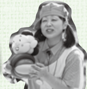
バルーンアートで 忠敬さんを表現