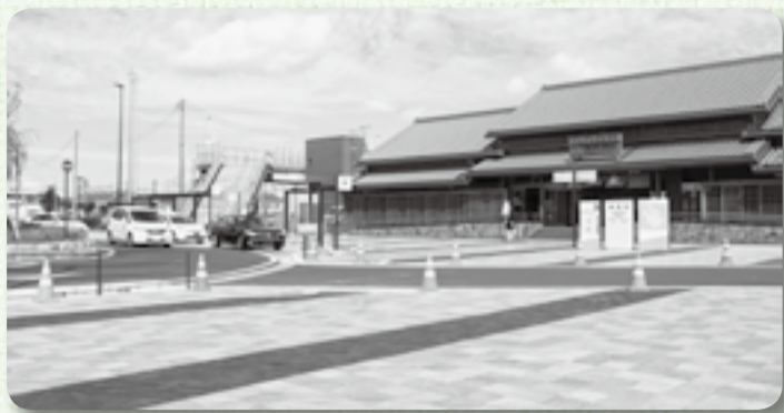
▲すっきりした駅前には真新しい案内看板が立ち並ぶ