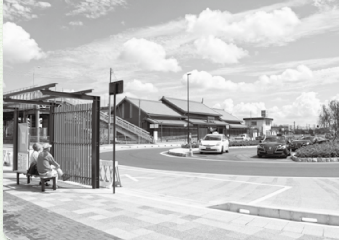
▲歩道やバス停も整備され利便性も向上