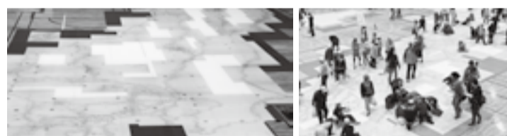
※写真は平成24年に開催された「完全復元伊能大図展」の様子