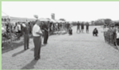
▲ジュニアサッカー交流大会