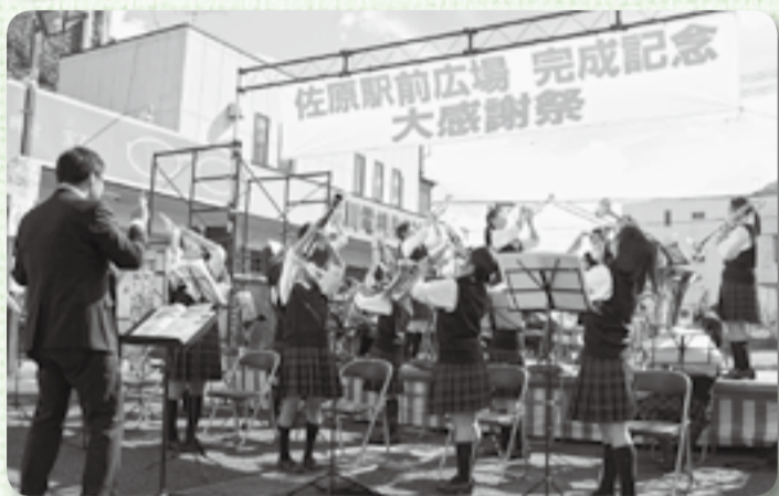
▲躍動感あふれる演奏で完成をお祝い