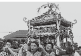
▲南小川の妙剣神社(7月25日)