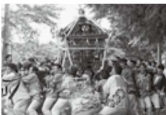
▲府馬の愛宕神社(7月18日)