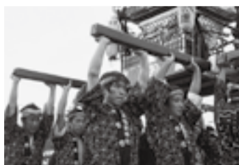
▲大角の稲荷大神(7月25日)