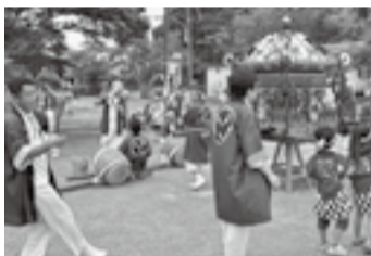
▲五郷内の阿夫利神社(7月4日) 南原地新田の稲荷神社(7月4日)

■無料シャトルバス運行 ◇運行日時 18日(土)・19日(日) 13時~21時 ■交通規制 18日(土)・19日(日)は、15時から22時まで小見川市街地で交通規制が行われます。 ■黒部川イルミネーション 7月18日(土)から8月20日(木)まで、黒部川の水上に約400個のポンボリが灯ります。 ■イルミネーション点灯式 ■日時 7月18日(土) 18時30分 ■場所 おまつり広場