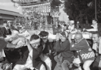
▲阿玉川の八坂神社(7月11日)