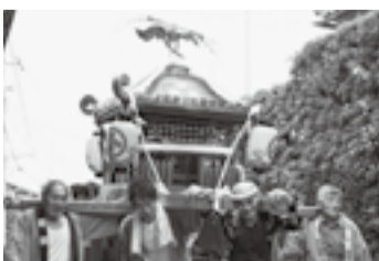
▲上小川の皇産霊神社(7月25日)