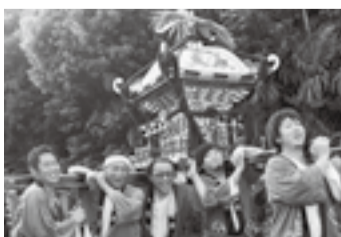
▲仁良の熊野神社(7月25日)