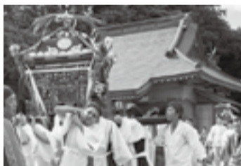
▲新里の八重垣神社(7月18日)