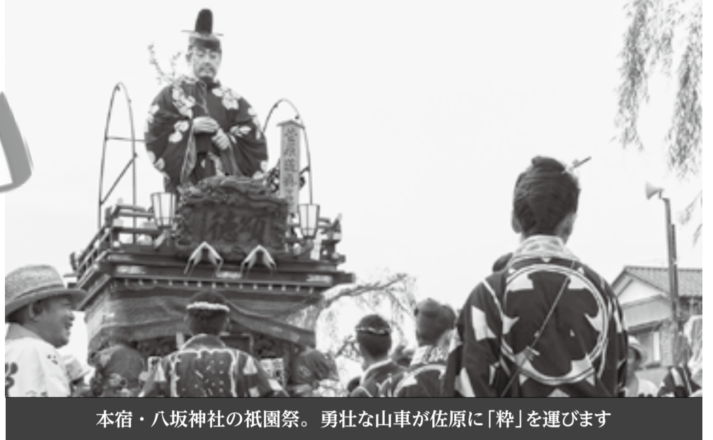
本宿・八坂神社の祇園祭。勇壮な山車が佐原に「粹」を運びます

今年3年に一度の本祭 山車10台が整列し巡行 11日(土)の9時に山車10台が船戸川岸通りに整列し、小野川沿いなどを練り歩きます。また、17時には年番引継ぎ行事のため、忠敬橋を先頭に香取街道に山車が整列します。 各種物産販売広場を特設 飲食物の販売や他市町からの実演、販売コーナーなど ◇わくわく広場 ◇ふるさとお土産テント村 ◇にぎわい広場小江戸茶屋