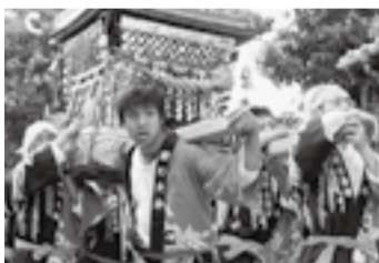
▲高野の駒形神社(7月19日)