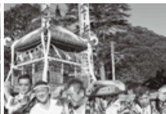
▲原宿の八坂大神(7月18日)