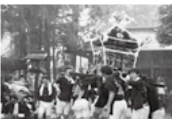
▲森戸の八幡神社(8月3日)