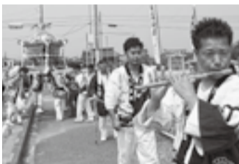
▲川上の須賀神社(7月11日)