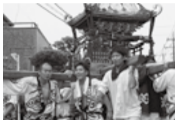
▲小見の琴平神社(7月11日)