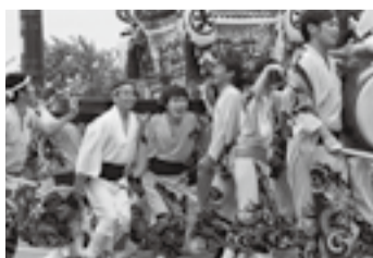
▲大戸川の八坂神社(7月25日)