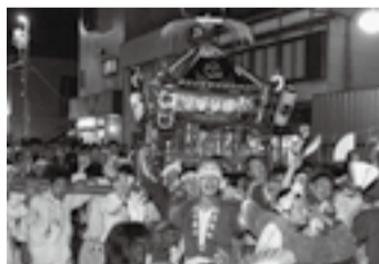
▲大根塚の金比羅神社(7月18日)