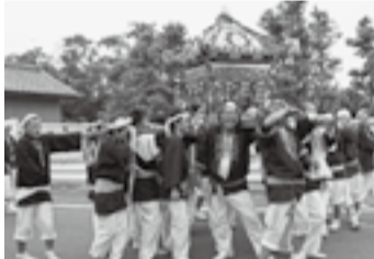
▲長岡の稲葉山神社(7月11日)