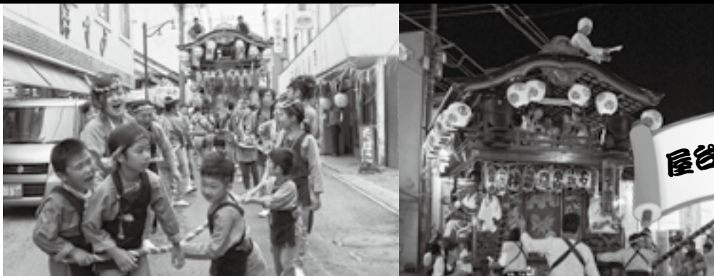
利根川水運の港町として栄えた小見川の須賀神社の祇園祭