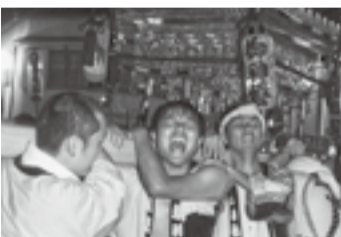
▲八日市場の八坂神社(7月18日)