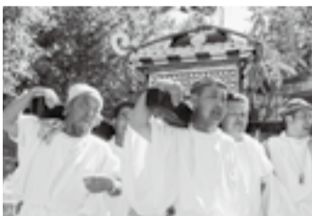
▲篠原本田の八坂神社(7月19日)