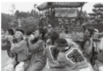
▲竹之内の子安神社(7月11日)