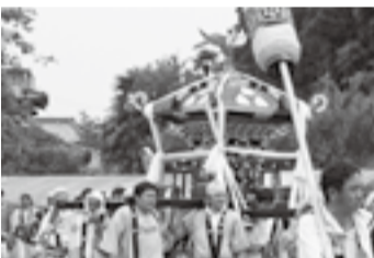
▲田部の日宮神社(7月11日)