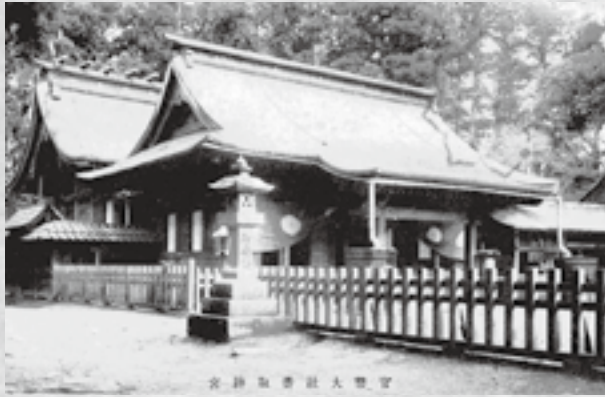
▲大正期の香取神宮