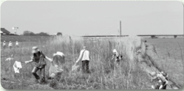
▲佐原河川敷緑地での清掃活動

市内の環境保全活動団体である、かとり市民環境ネットワークを中心とするボランティアによる佐原地区の利根川河川敷の清掃活動が、3月18日と4月22日に行われました。