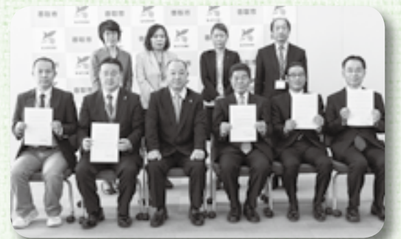
▲平成26年度新規協力団体の皆さん

4月15日、「香取市見守りネットワーク事業」に平成26年度新たに加わった7団体のうち、5団体が出席して合同締結式が行われました。平成20年度から開始した本事業の協力団体は57団体となり、