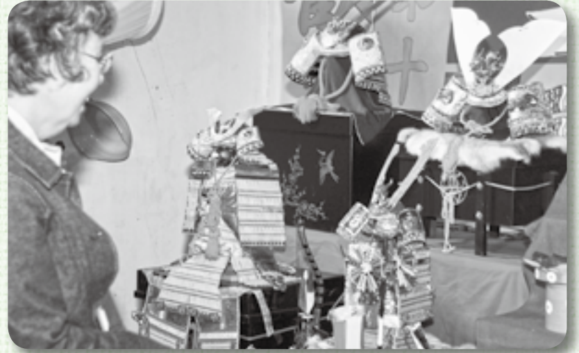
▲兜飾り、鎧飾りに見入る（東薫酒造様にて）

五月人形といえば、屋外に飾る「外飾り」として鯉のぼりが定番ですが、家の中に飾る「内飾り」には鎧または兜飾りがあります。5月17日まで佐原地区の商家で展示されている五月人形は、男の子の誕生を祝うとともに、無事な成長を祈るための内飾りです。中には見たこともない巨大な鯉のぼりなど特例もありますが、訪れた観光客は商家を巡り、情緒ある町並みの中に飾られた人形の前で足を止め、興味深そうに眺めてはカメラを向けるなど、散策を楽しんでいました。