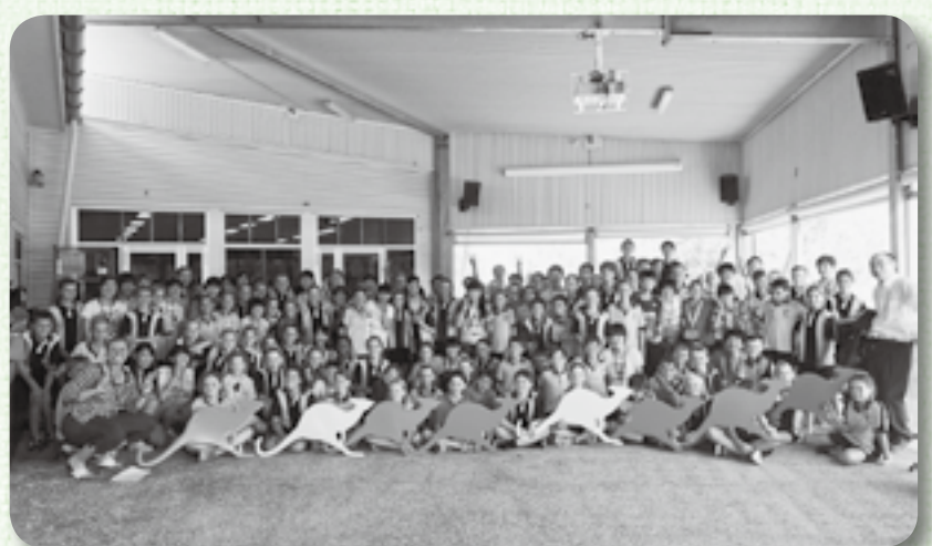
▲プルーンバール・ステイト校の生徒との記念撮影

3月12日から20日まで、オーストラリアのブリスベン市にあるプルーンバール・ステイト・スクールを、市内中学校の代表生徒34人が訪問しました。生徒たちは、プルーンバール・ステイト・スクールとの交流やホームステイを通じて、異文化への理解を深め、また、日本を紹介する中で自国の文化を再認識するなど、すばらしい機会を得ました。今後は、参加者一人一人がこの経験を各学校に持ち帰り、その成果を広めるとともに、この経験がそれぞれの人生の大きな糧となることでしょう。