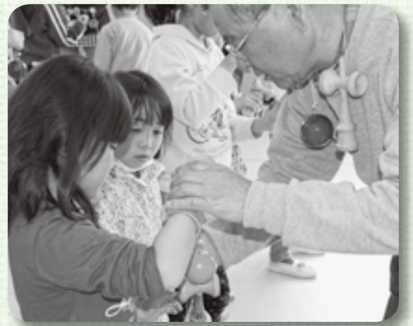
▲真剣なまなざしで教わる子どもたち

今回は先生に基礎を教わった後、けん玉を使ったさまざまな遊びを対戦形式で行い、楽しい時間を過ごしました。また、けん玉検定では飛び入りで参加した女の子が8級に合格し、先生を驚かせていました。