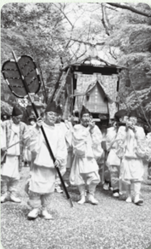
▲春風の中を進みます

4月15日、香取神宮で神幸祭が行われました。年に一度、香取神宮の経津主神（武道の神様）が里に降りられる大祭で、装束を身にまとった氏子が約200人の行列をなしてお供します。一行は、木々が青々と葉をつけた参道を練り歩いたのち、香取神宮の大駐車場で駐輦祭を行いました。駐輦祭では氏子地区の下小野の神楽などが奉納され、訪れた見物客は見事な獅子舞に見入っていました。