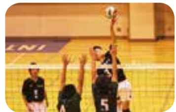
▲県新人戦での一コマ

現在部員13人で、県大会で活躍できることを目標に活動しています。昨夏より体育館改修工事があり十分な練習を行うことができませんでしたが、2月中旬に工事も終わり、毎日体育館が使えるようになりました。一人一人の技術を向上させ、目標が達成できるように頑張ります。