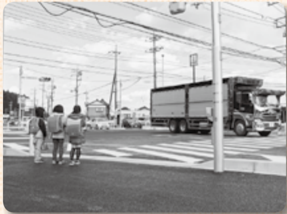
▲歩道も広く整備されました