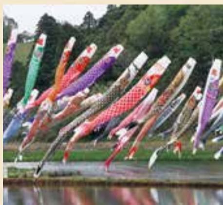
■日時 5月2日(土) 10時~15時 ※雨天時3日(祝)に順延 ■場所 橘ふれあい公園