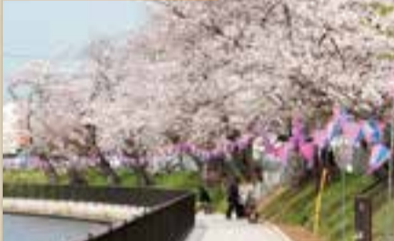
佐原のさくら祭り