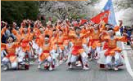
水郷おみがわ桜つつじまつり