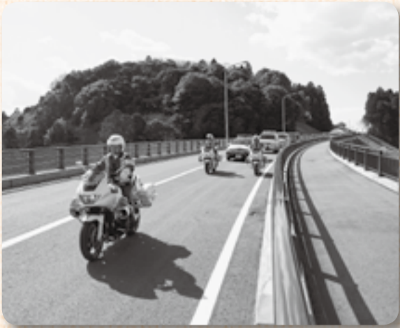
▲警察車両を先頭に関係者による通り初め