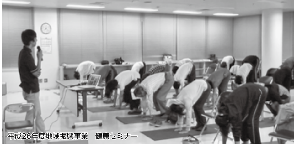
平成26年度地域振興事業 健康セミナー