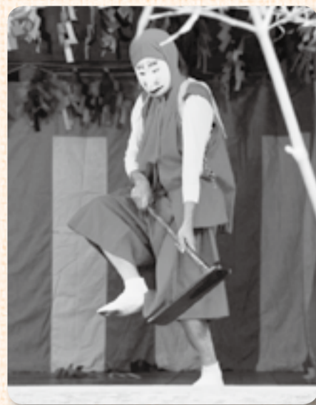
▲舞には くわ 鎌を振り下ろす様子も

この神楽は木内神楽保存会によって傳承されている12演目が演じられます。稻荷大明神は軽快に、恵比寿はユーモラスに、素戔嗚命 すさのおのみこと は厳かにと、それぞれの神様の衣装と舞に性格や個性が表れます。また、縁起物の鯛やお餅を投げると、それを取ろうと子どもたちは大はしゃぎ。袋いっぱいにお餅をつめて神楽を楽しんでいました。