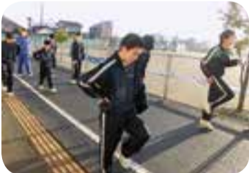
▲動きづくりの基礎練習

私たち、香取中陸上競技部は、県大会出場を目標に、日頃より鍛錬に励んでいます。冬場は下校時刻が早く、練習時間が確保できませんでしたが、少しでも時間を縮められるよう練習時間を大切に取り組んできました。目標達成を目指し、頑張っていきたいです。