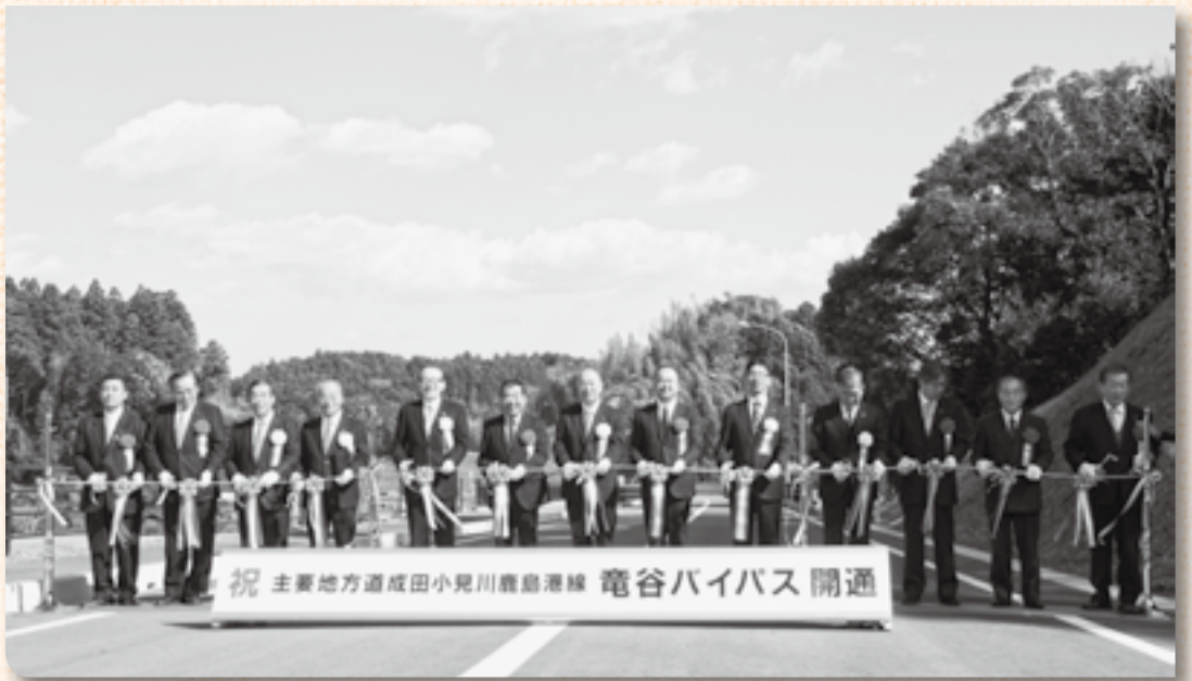
▲完成を祝うテープカット