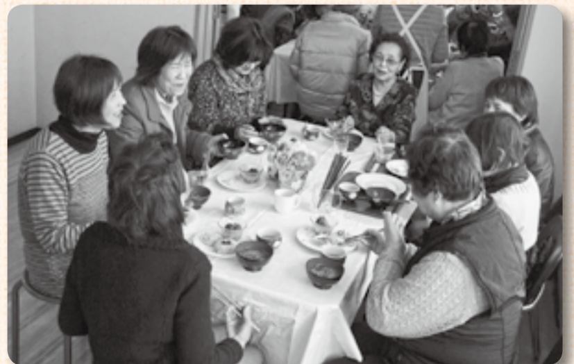
▲おいしい料理に会話も弾む

文化会館の改修のため2年ぶりとなった舞台の部では、演奏やフラダンスなどが披露され、また、公民館では作品の展示やさまざまな体験が催されました。とりわけ、お昼時の料理教室の試食には長い行列ができるほどの盛況ぶり。炊き込みご飯にきのこの汁物、デザートと彩りも鮮やかなメニューに来訪者は大満足でした。