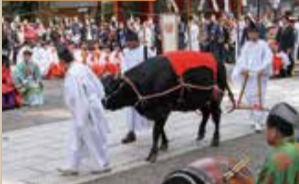
香取神宮御田植祭