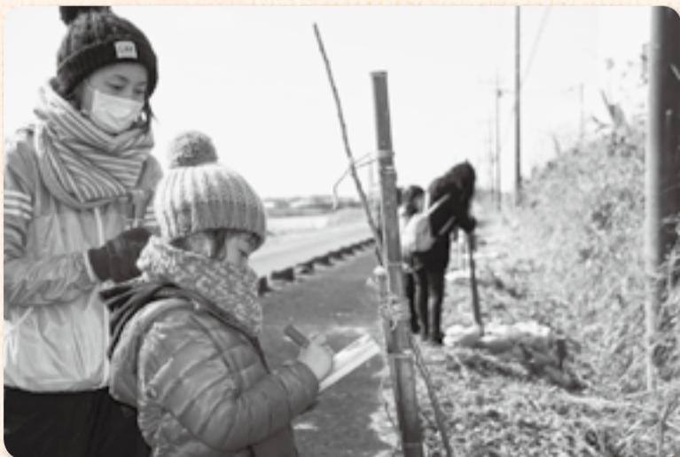
▲苗木1本1本に思いの込められたメッセージを添えて

継続的に桜を植樹し、魅力あるふるさとづくりに貢献したいと2年前に発足した「おみがわ桜プロジェクト」。故郷に残る思い出づくりにとの願いから、会員の母校である小見川中央小に呼びかけ、小学1年生14人とその家族も参加しての植樹会が2月14日に阿玉川水門近くで行われました。12月から草刈りなどの準備を進めてきた会員の手を借り、親子で植えた「思川」20本。名前を書いた木札には将来の夢や「元気に育てて」といった言葉も添えられ、子どもたちの成長とともに開花の待たれる桜並木が、また一つ増えました。