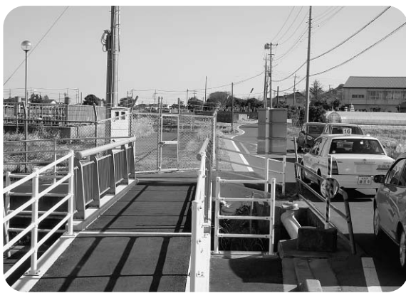
小見川東小学校付近通学路

答 学校では、従前から交通法規どおり路側帯の有無にかかわらず、自転車は道路の左側を走行するように指導しています。各学校では毎年入学時に、自転車通学者に対して、児童生徒個々の通学路の通行の仕方も指導しています。