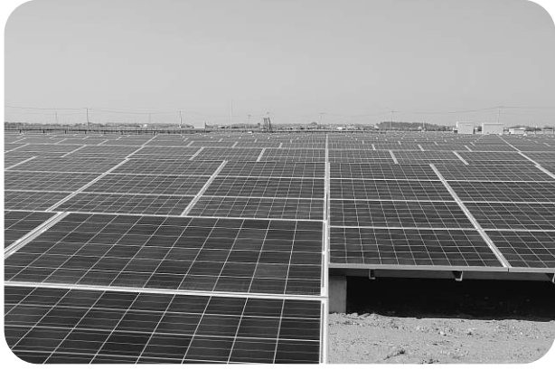
与田浦太陽光発電所