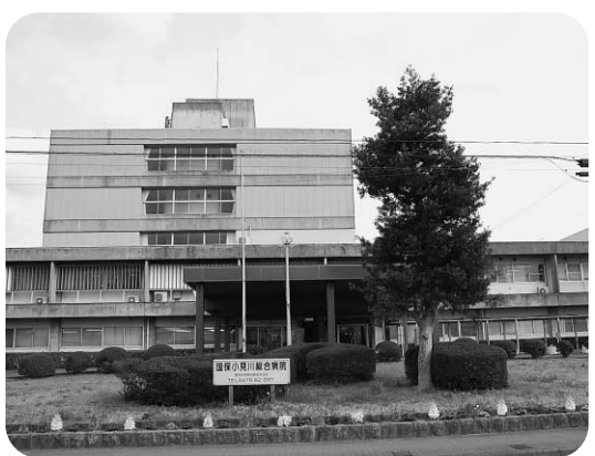
国保小見川総合病院

答 今後設置される予定の検討委員会等の協議の中で決められていくことになると考えます。