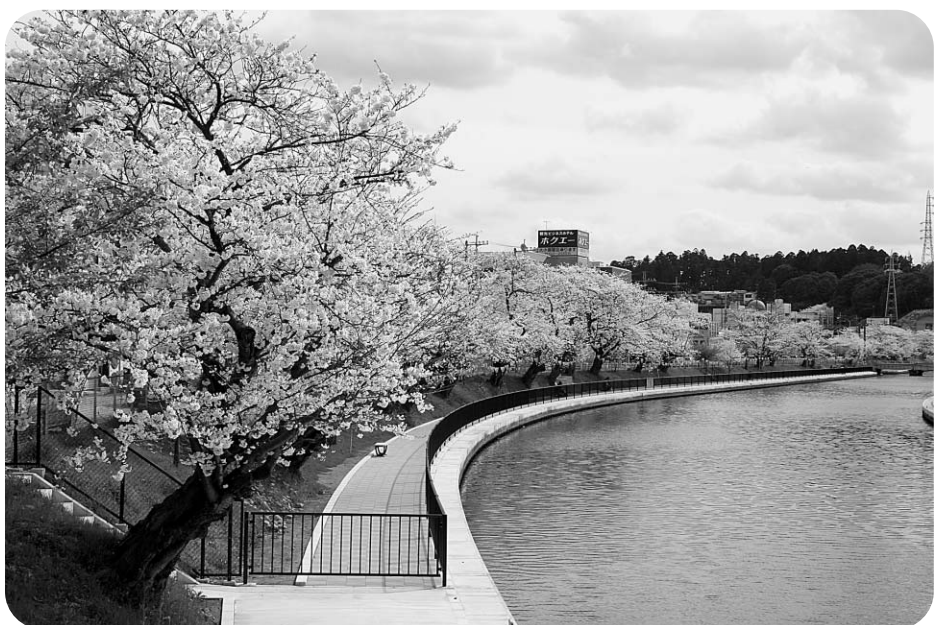
出逢いの小路 (両総用水付近)