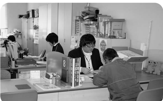
佐原地域包括支援センター (香取市役所1階)

手数料の見直しに関する基本方針を策定したところで、消費税については、税率の引き上げに伴う公共料金等の取り扱いについての総務省からの通知により、施設の維持管理及び運営に係る経費について適切に対処してまいります。 問 水痘、成人用肺炎球菌ワクチンの定期接種化で市の取り組みは。成人用肺炎球菌ワクチンについては、65歳以上の希望者という現行制度を維持し、補助の増額を求める。 答 平成26年10月の定期接種化に向け、対象者の接種状況を検証して、より良い方向で検討します。補助については現行額を継続していきたい。 問 それぞれの道の駅の売り上げを増加させるための方策は。 答 水の郷さわらは、より多くの方が何年度でも立ち寄っていただけるよう、国や指定管理者と連携し施設のグレードアップを図り、来客者の高評価が継続するように努めます。紅小町の郷は、平成25年2月に地元農産物を活用した数多くの体験教室、イベント等が開催できる加工体験施設、紅小町の郷体験工房がオープンしました。この影響もあり、集客も引き続き好調で、今後も都市農村