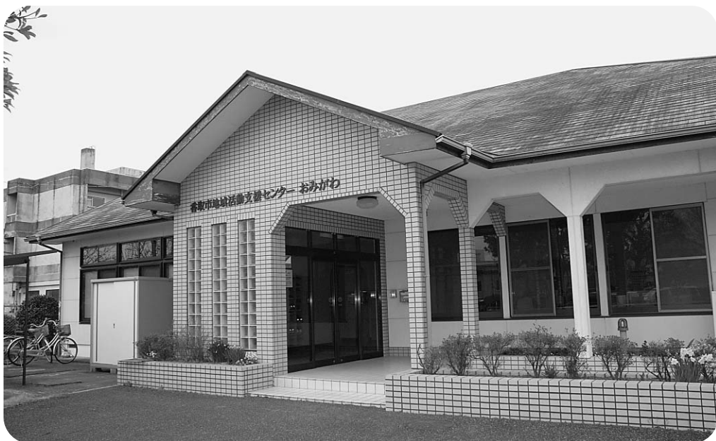
地域活動支援センターおみがわ (南原地新田)

答 財源は、一般財源です。基金2億円の使途は、決まっています。工事費等は、できるだけ復興交付金を活用しますが、合意形成に係る経費や事務費に、基金を使う場合も考えられます。