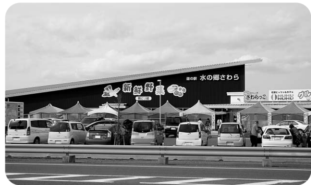
道の駅水の郷さわら