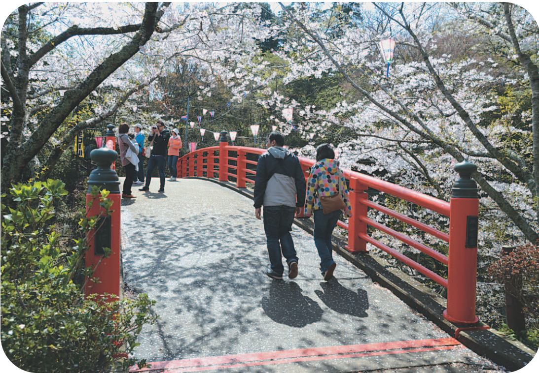
4月6日、「水郷おみがわ桜つつじまつり」が城山公園において開催され、小見川駅から出発した「駅からハイキング」の参加者は楽しみながら園内を歩きました。

次に市長より先議の申し出があった補正予算案9件を議題とし、2人の議員から質疑の後、委員会付託を省略し採決を行った結果、いずれも可決されました。