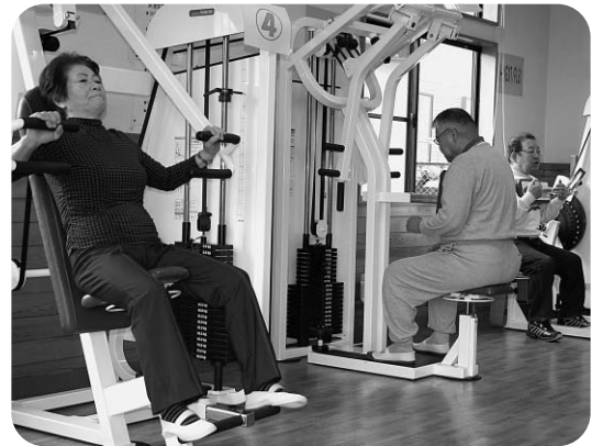
シニア健康プラザ (佐原口)

答 政府は病気になるっても、介護が必要になっても、住み慣れた自宅や地域で暮らし続けられるように「地域包括ケアシステム」の構築に本格的に乗り出すとしていきます。この「地