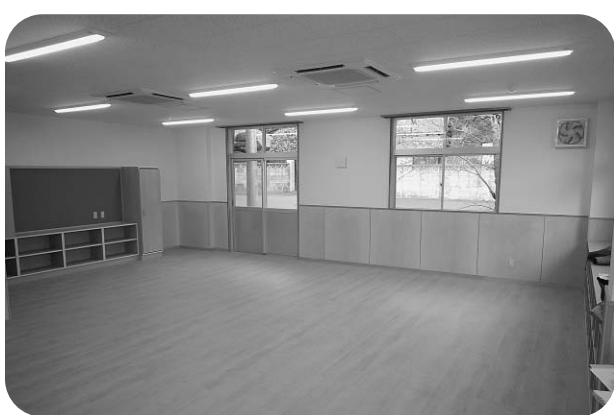
東大戸児童クラブ(東大戸小学校内)

問 子育て世帯臨時特例給付金支給事業8246万4千円の内、対象者またはその人数は。