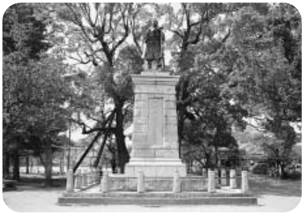
佐原公園の伊能忠敬翁の銅像

答 昭和8年に当時の佐原町議会において、伊能忠敬の命日にあたる5月17日に「忠敬祭」を行うことが決議されています。昭和23年に没130年祭を実施後、10年ごとに墓前祭を実施し、平成10年から平成19年までは市が主催し毎年実施してきましたが、墓