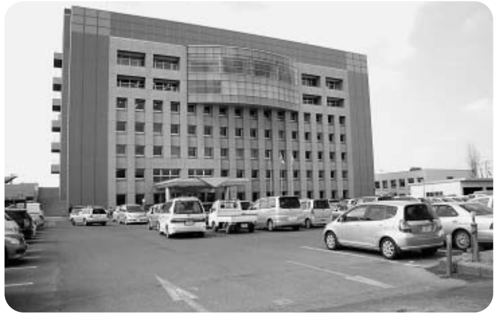
香取市役所本庁舎