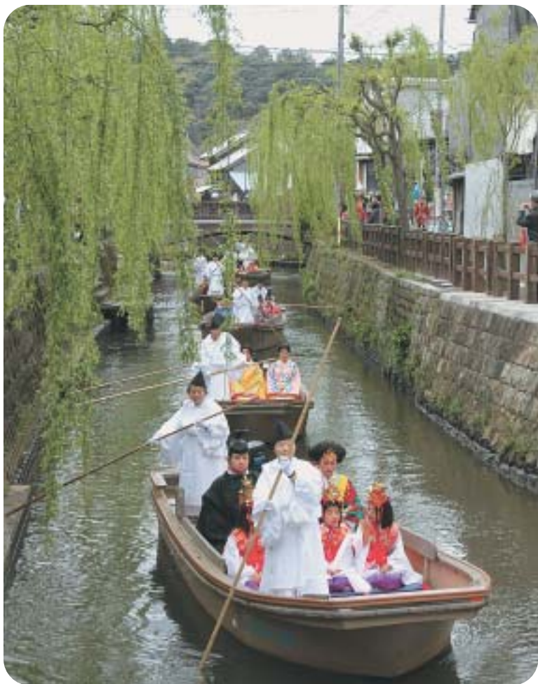
さわら雛舟 小野川周辺 (撮影日: 4月6日)

議員から討論の後、採決の結果、それぞれ可決されました。次に発議案第5号、第6号を議題とし、提案理由説明を行った後、採決を行った結果、いずれも原案のとおり可決、次に千葉県後期高齢者医療広域連合議会議員、香取広域市町村圏事務組合議会議員の選挙、香取市東庄町病院組合議会議員の補欠選挙が行われ(9頁の結果を掲載していません)全日程を終了しました。