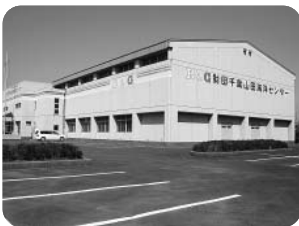
現在のB & G千葉山田海洋センター

問 学校の現場における取り組み方針について。 答 昨年の9月いじめ問題への取り組み状況に関する緊急調査で、小学校51件、中学校36件の報告があり、今年2月末までの保護者等からの相談件数と学校からの支援要請件数が小学校2件、中学校10件、合計12件でした。取り組みとして、1 いじめ対策危機管理マニュアルを各学校に配布、2 学校に対して定期的な悩みアンケートや教育相談の実施及び電話による相談窓口であるホットダイヤルの実施、3 人権標語の作成、いじめ根絶に向けてのルールづくり等の実施に取り組んでいます。 問 ペットボトル処理業者は、4点の違法性が明らかになり指導を受けているが依然として搬入を続けている。厳しい指導が求められるが、現状はどうか。 答 当該処理業者の計画は、千葉県宅地開発事業の基準に関する条例の対象となる開発となることから、今後はこの条例に基づき業者を指導していきます。市としても、県との連絡を密にして適切に対応していきます。