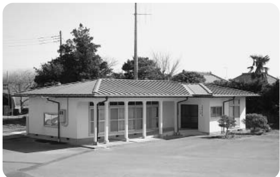
北佐原区長連合会に無償譲渡された香取市農村広場(北佐原地区)

意見 現在、建築基準法等によりアスベスト被害の拡大の根絶対策として、アスベスト等の使用が規制されていること、また、労働安全衛生防止法で石綿等の製造も禁止されており、対策が十分にとられている。