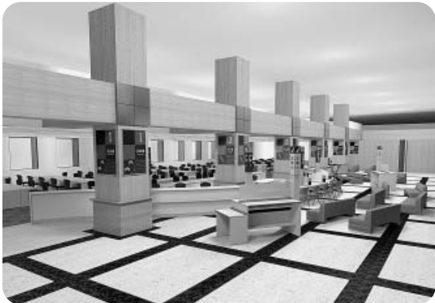
市役所1階 総合窓口のイメージ図

答 阿玉台地区と久保地区の環境保全会に、除草委託料として、各々24万8千円と15万2千円を交