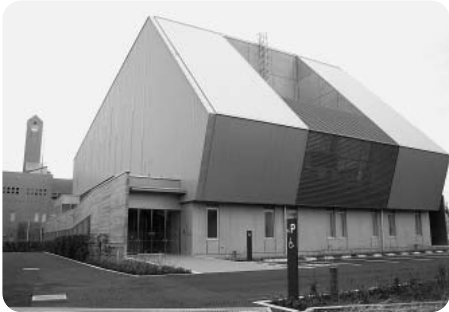
完成した小見川市民センター「いぶき館」