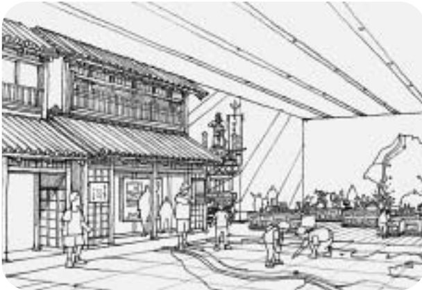
おこしまち(仮称)拠点活性化地区周辺 佐原駅前地区活性化拠点・(仮称)おこしまちイメージの施設内部展示ゾーンの中心

答 避難所における情報収集手段としては、本年度、防災行政無線のデジタル移動系設備を新たに整備しており、本庁、支所、上下水道事務所及び各避難所における無線通信可能な環境整備を進めています。WiFiスポットの整備につきましても、一般利用者向けにWiFiスポットを整備することとなる、情報セキュリティ確保の観点から業務系ネットワークとは別に回線を設ける必要があり、現時点では整備の検討は困難と考えています。