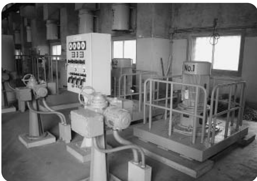
現在の佐原浄化センターの合流汚水ポンプ