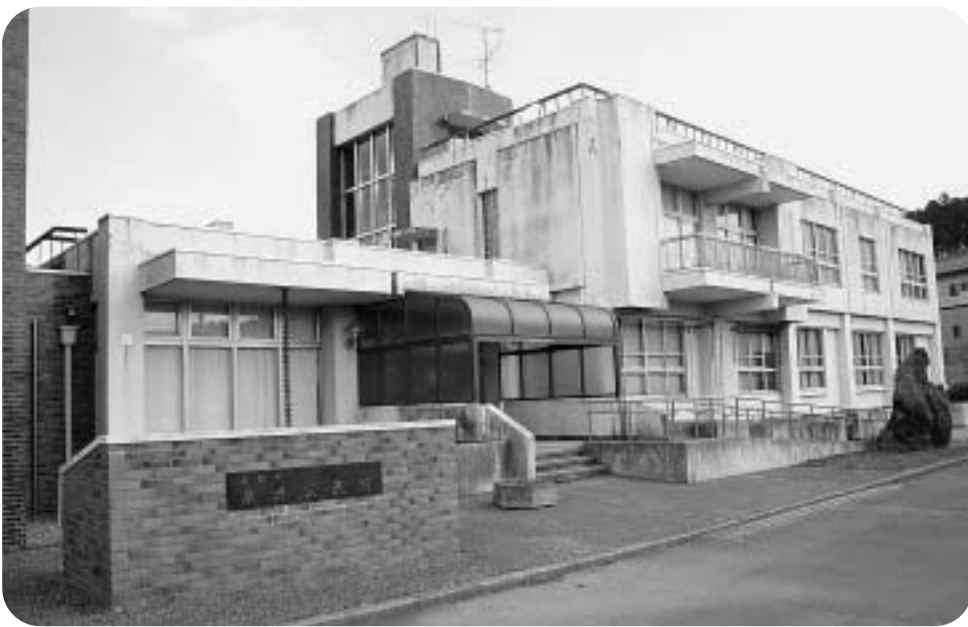
震災被害により休館中の栗源公民館

現在は、栗源保健センターを活動の場として利用しており、各種教室・講座などをこれまでと同様に開催しています。また、今後において、栗源公民館を新設する考えはありませんが、栗源市民センター完成後は、この施設を利用