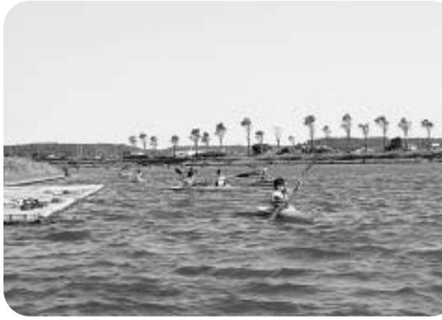
黒部川で開催されたわくわくカヌー体験教室

再編に関する自治会は37あり、うち27の自治会で住民説明会を開催し、合計で846名の参加がありました。