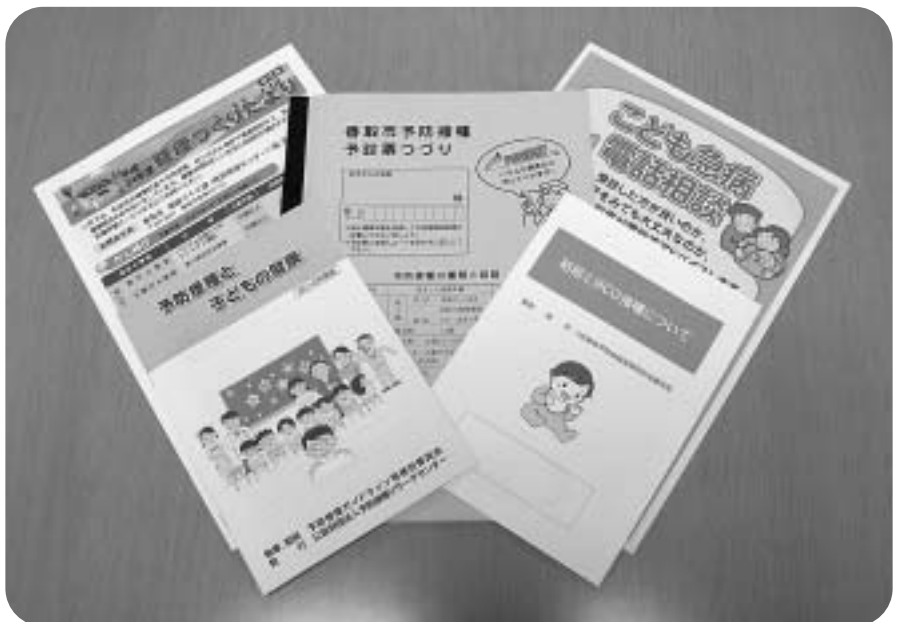
香取市予防接種用パンフレットなど

要望 子育て世帯に対して、さまざまな周知の手段を活用して、情報発信を行うと共に、各種予防接種