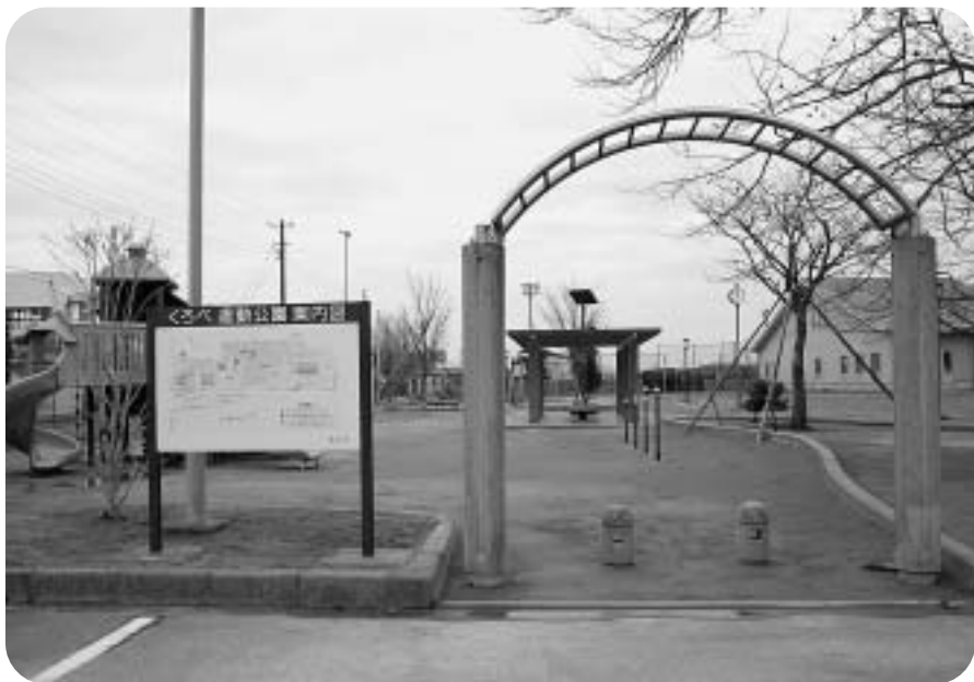
維持管理を委託している「くろべ運動公園」

答 この道路については、道路改良拡幅工事ではなく、維持的に舗装修繕工事を行いました。また、幅員が狭いため、注意看板を設置します。