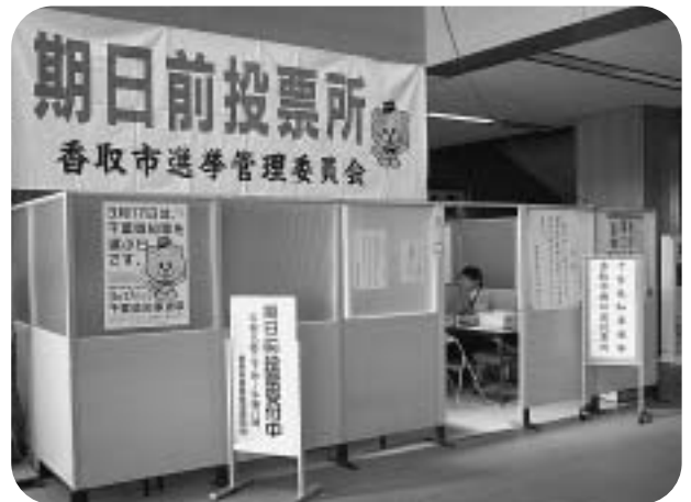
本庁の千葉県知事選挙の期日前投票所