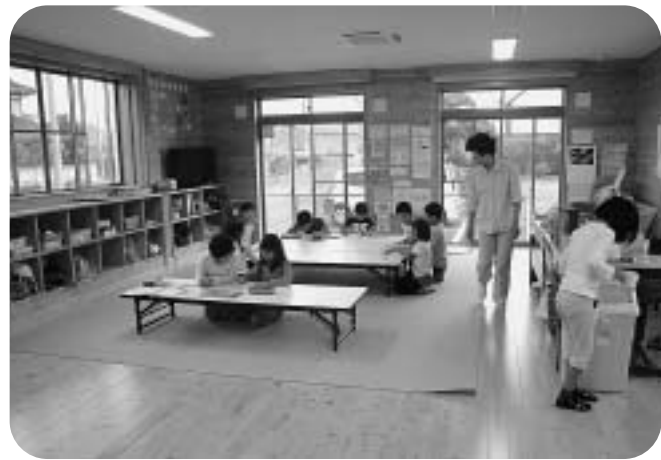
新島小学校放課後児童クラブ