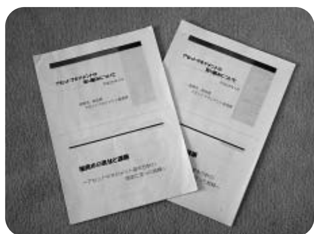
福岡県福岡市のアセットマネジメントに関する資料