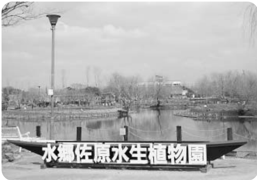
現在の水郷佐原水生植物園

合計画・後期基本計画において、活力に満ち、魅力ある農林畜産業の実現を目指しています。