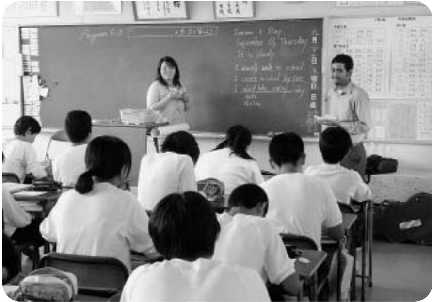
外国語指導助手を活用した英語の授業 (小見川中学校)

答 今回の施設は、小学校体育館の一部を活用して設置するものです。今後も各小学校の空き教室は増えてくるものと考えており、学校ごとにあることが望ましいと考えています。今後におきましても、空き教室を活用していきたいと考えています。