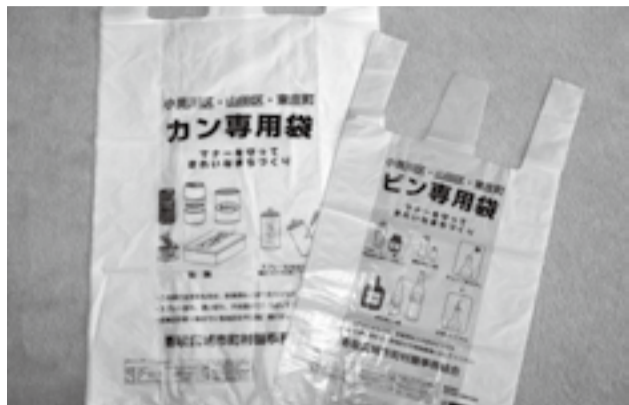
ビン、カン専用袋 (小見川区、山田区)

【図】 これまでの経過としては、事業予定者が平成20年7月と9月にボーリング調査を実施したことに伴い、10月に近隣住民、九美上三区役員会、九美上区長会が計画に反対を決定。11月7日に地元から市長及び千葉県知事に対し計画反対の陳情を提出。12月22日に市長が現地を視察し、地元の見解を尊重する旨を伝える。本年5月に事業予定者が県に土砂採取の業者登録を行う。10月4日に九美上三区臨時総会が開催され、市の担当者も出席し、今後の対応について話し合いを行う。11月末に北総県民センター香取事務所にて土砂採取計画の有無を確認したところ、申請は無いとの回答を得ている。