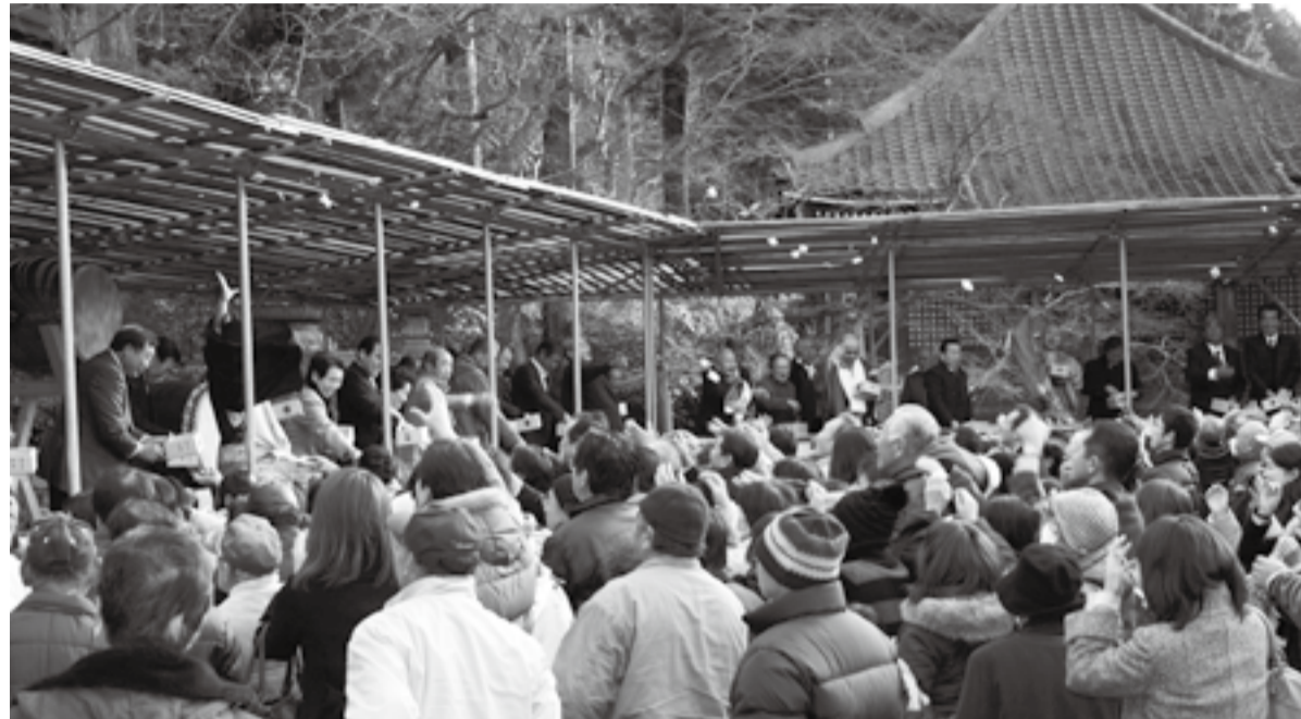
節分祭 (2月3日 佐原区牧野・観福寺)

11月27日は、市長より、一般会計補正予算、水の郷さわらの設置及び管理に関する条例の制定、特別職市職員の給与等に関する条例の一部改正、指定管理者の指定(たまつくり保育所、香西保育所、水の郷さわら)、工事請負契約の締結(香取市民体育館耐震補強及び改修工事)、工事請負契約の変更(香取市立佐原中学校屋内運動場建築工事)など議案第1号から議案第14号についての提案理由が述べられました。