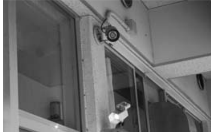
防犯カメラシステム (佐原第5中学校玄関)