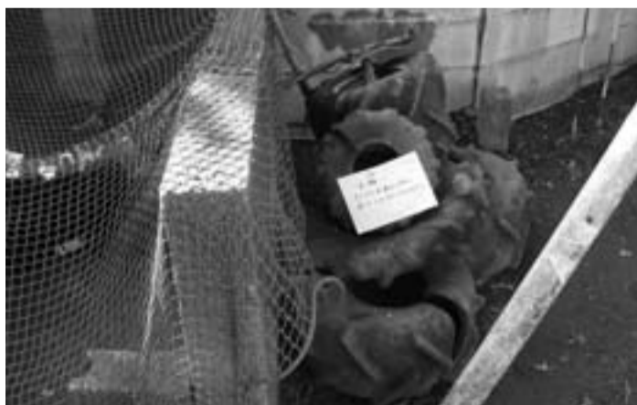
ごみステーションに不法投棄されたタイヤ

が交差する場所に新築建物が建てられて見通しが悪いので、道路管理者としての安全配慮義務を履行された。業務上過失傷害に注意されたし。