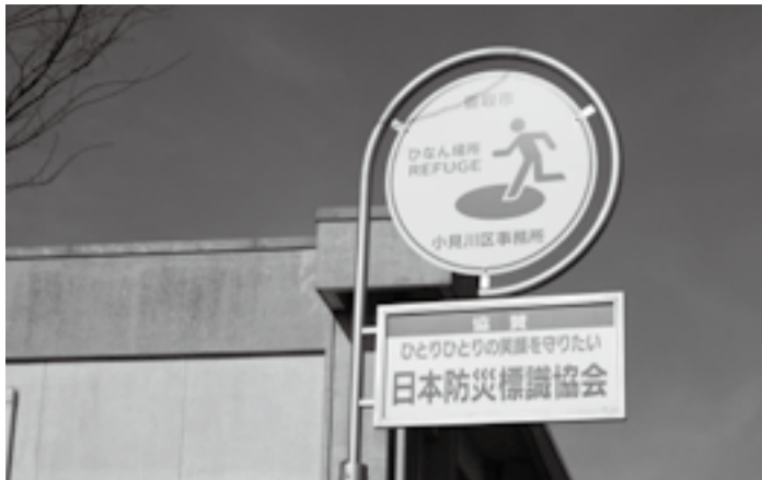
避難場所標識塔 (小見川区事務所)

を進めている。この事業を有効に活用し、誘導標識を組み込んだ複合看板の設置を考えている。なお、実際の避難では消防団等の協力を得ながら安全に行うこととなる。