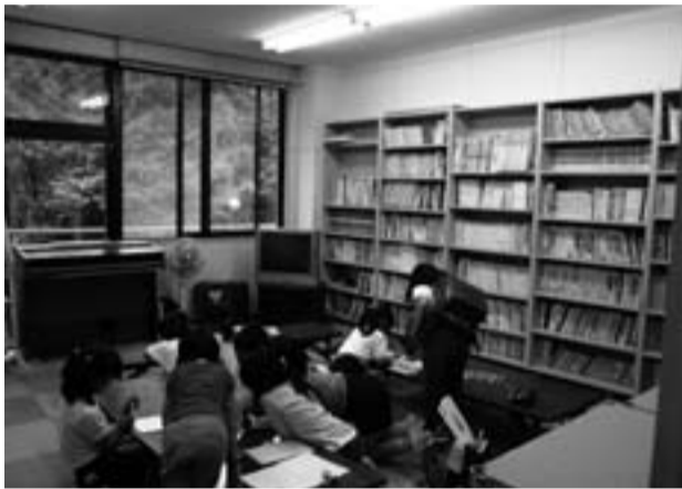
放課後児童クラブ (山田児童館)