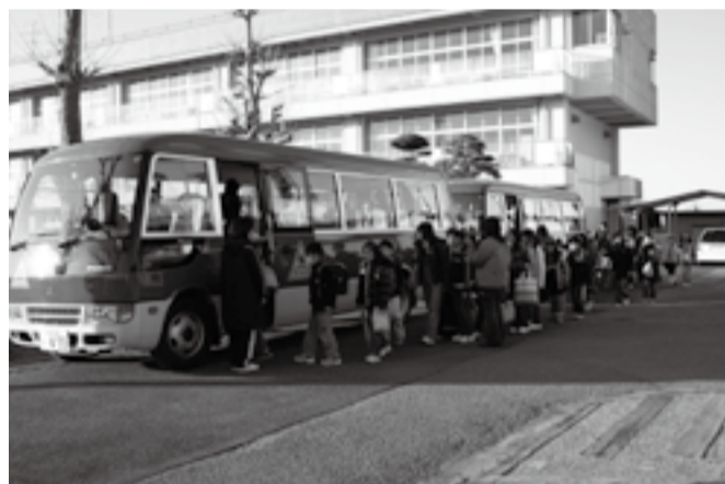
栗源小学校スクールバス