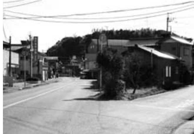
府馬商店街(県道旭小見川線沿い)