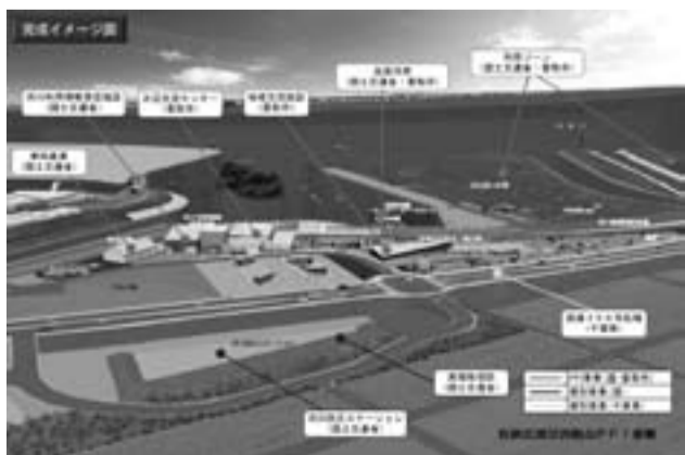
水の郷さわらイメージ図

図 水の郷さわらの指定管理者の指定については、東洋建設、前田建設工業、常総開発工業、大和興産、ファイブ、麺屋桃太郎が出資をして、施設建設から維持管理までの事業を行う目的で組織した会社である。また、事業の担当区分は、東洋建設、前田建設工業、常総開発工業が施設建設を、大和興産は維持管理を、ファイブは物販を、麺屋桃太郎は飲食をそれぞれ統括している。