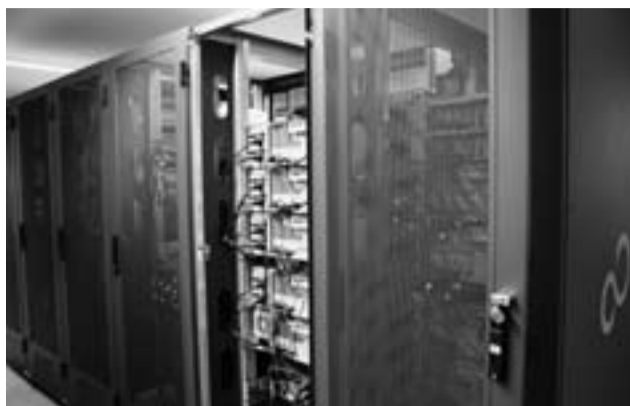
電算室サーバー群 (市民情報管理サーバー)

図 今回は、本庁5階の電算機室に設置してある住民情報システムを新規に入れ替えるものであり、本庁及び各区事務所で使用している端末等の機器の変更を行うものではない。