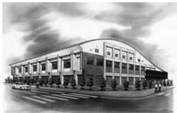
佐原中学校屋内運動場完成イメージ図

また、既存杭の引き抜き変更については、市の保管図面により新設杭の施行箇所を計画したが、資料が不十分であったため、既存浄化槽の埋設杭50カ所のうち2カ所が新設杭の施工に支障が生じたため、既存杭を引き抜くこととなった。