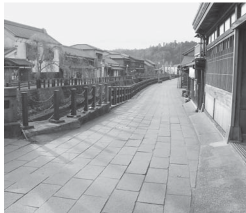
コロナ禍の影響を受ける観光地

A 5人の予定です。業務内容は、例として新型コロナウイルス感染症の感染防止に関する専門家からのアドバイスやポストコロナを見据えての冷え込んだ観光事業の回復、農産物等のブランド化などに対して適切な助言、アドバイスをいただくことを想定しています。