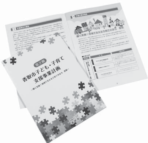
地域で支える子育てのまちを目指して

A これまで大きな問題はなく、おおむね順調に運行しています。学校と運転手、添乗員や運行委託業者との連絡を密にするとともに、定期的に担当者会議を開催するなどして安全な運行に努めています。