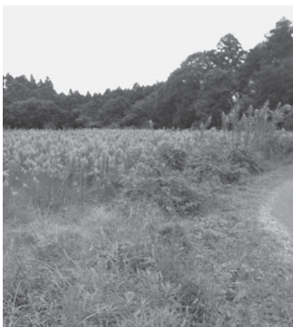
花粉によるアレルギーも問題となっている耕作放棄地

A 周辺住民から問い合わせがあった場合は、必要に応じて所有者等へ適正管理を指導しています。