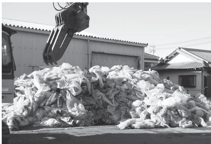
処理料金が値上げされた農業用廃プラスチック

Q 農業用廃プラスチック処理料が25円から66円となり41円値上げされたが、値上げ分は全額農家負担となっている。市の助成を検討すべきではないか。