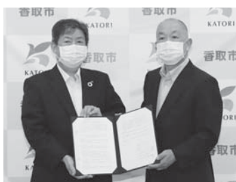
東京電力パワーグリッド(株)成田支社と災害協定を締結