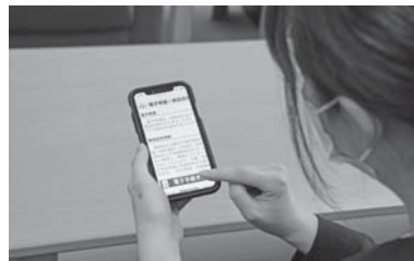
DX推進で電子申請化も進む

A 国から市町村へ交付される補助金の補助率が2分の1のため、市は交付額の2分の1を負担することになります。さらに、