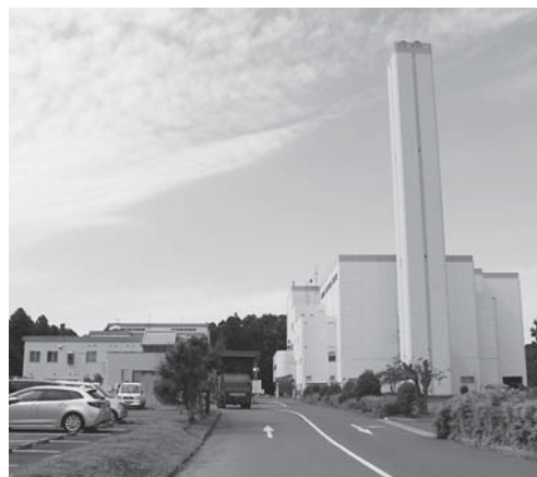
共同処理を行う 伊地山クリーンセンター

A 匝瑳市ほか二町環境衛生組合のごみ処理業務等は終了しますが、一般廃棄物最終処分場の浸出水の水質等が廃止基準に適合し廃止できるまでは継続して施設の管理が必要であり、また、火葬場に関する事務も共同処理をしているため、引き続き加入することになります。