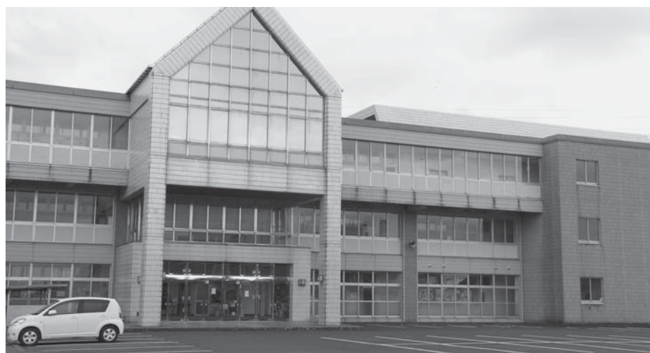
大規模改修が必要とされている校舎