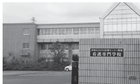
香取おみがわ医療センター附属看護専門学校