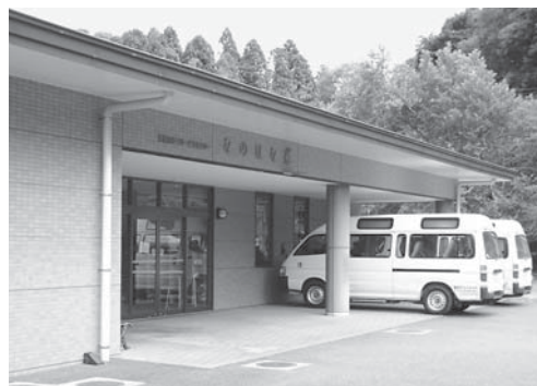
移譲が決まった なのはな苑デイサービスセンター

A 法的根拠はありませんが、施設の事業内容等を検討し20年間としました。新たな事業の実施は、事業者との協議となります。