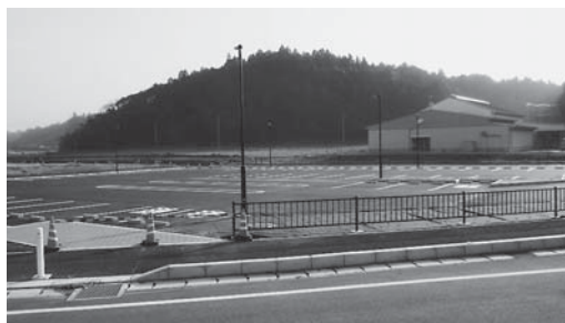
整備が進む橘ふれあい公園

A 市民の利用はもちろん、交流人口の幅広い利用を想定しています。パークゴルフ場については、市民の健康増進やレジャー目的と併せ、大会を行えるコースとしても考えています。