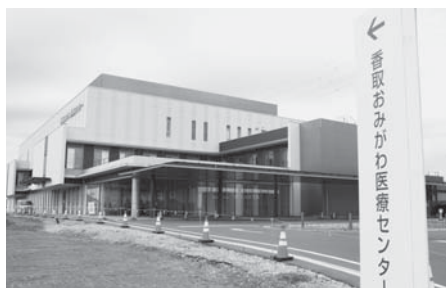
令和4年度から独立行政法人化される

と香取おみがわ医療センターで、十分な話し合いをし、理解を深めながら協力し合い、病院の経営、香取地域の医療提