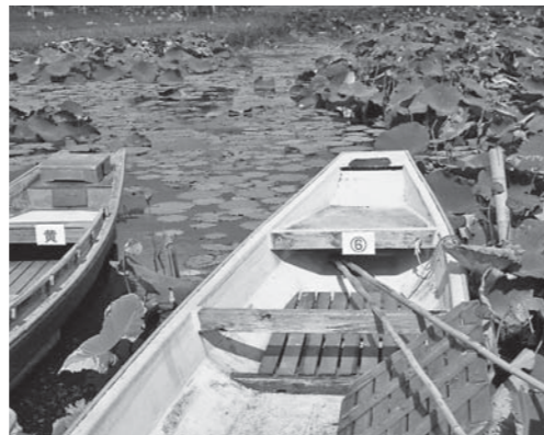
遊覧船の座席改修で密を避ける

A 感染予防対策に資する環境整備のうち、管理運営に係るものを指定管理者に委託するものです。具体的には、休憩所の増設や園内遊覧船の座席の改修等で密を回避する対策のほか、園内案内板の増設などとなります。