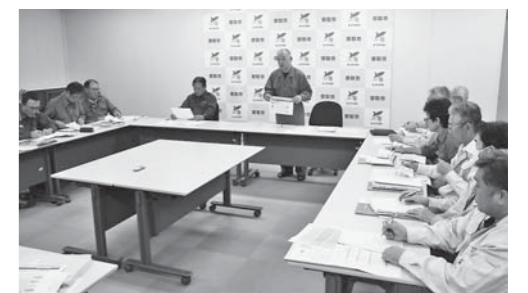
避難所のリアルタイムな情報を必要とする災害対策本部(令和元年台風15号)

A 災害対策本部と避難所との情報連携をリアルタイムで行い、市民に適切な情報を提供できるよう、ノートパソコン45台を整備します。