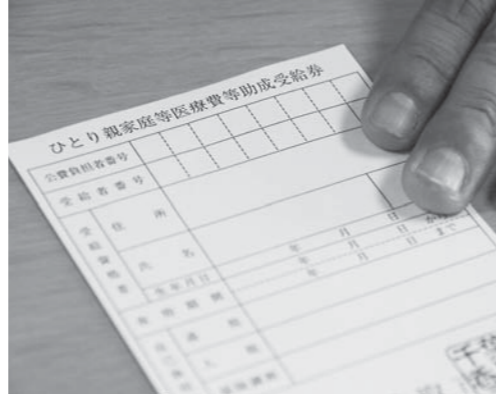
ひとり親家庭等医療費等助成受給券で支払いが便利に

A 受給券の発行と医療費の支払い方法が同じになりますが、ひとり親家庭等の医療費は、子どもだけでなく保護者も対象となります。9月1日現在、保護者が480人、子どもが697人、合計1,177人を見込んでいます。