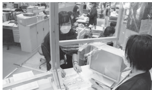
マイナポイント等の特典でマイナンバーカード取得が進む

A 平成27年度の制度開始から令和2年度の通知カードの廃止まで、合計2,182件です。