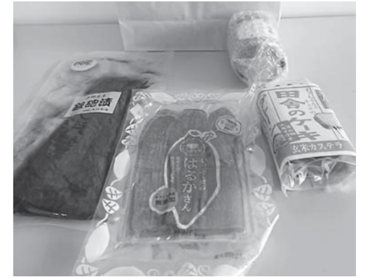
香取の特産品で宿泊客をおもてなし

A 新型コロナウイルス感染症の影響で落ち込んだ観光需要を回復するため、県のウエルカム・トゥ・千葉観光キャンペーン事業を活用し、地域特産品を宿泊客に提供するなど、再訪や特産品の購買を促進する取り組みを支援します。