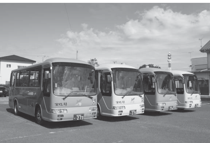
高齢者の交通手段となる循環バス

栗源成田空港線では「ザ・ファーム」付近までの路線延長を、上の台線では山田支所を経由するよう一部路線変更を協議しています。また、循環バスは、鉄道との接続環境向上や路線の大規模な見直し等を令和3年度に実施するため、準備しているところです。