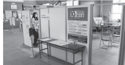
特別定額給付金特設相談窓口(市役所1階ロビー)

A 5月22日から開始し、週1回のペースで行う予定で、5月28日までで、689件の給付を行いました。また、6月4日に