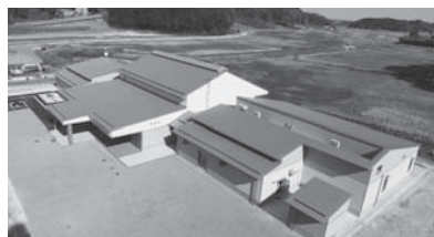
整備中の橋ふれあい公園 (テラス・サンサンと第1工区)

A 橋ふれあい公園整備事業は、平成30年度に行った民間活力導入可能性調査のなかで検討を行い、その結果、DBO方式が有用であると採用しました。事業方式を見直す考えはありません。