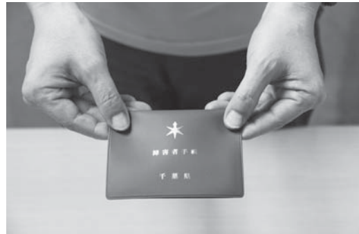
県発行の障害者手帳(見本)