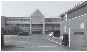
存続が望まれる看護専門学校

改修に伴う財源確保が運営上の課題となっていることから、「香取おみがわ医療センター附属看護専門学校あり方検討委員会」を立ち上げ、検討しているところです。