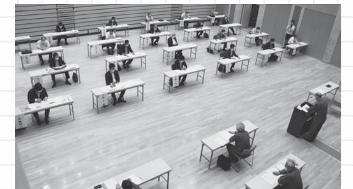
コロナ禍での6月定例会

新型コロナウイルス感染症拡大防止対策として3密を避けるため、会期日程を一部変更し、本会議も小見川市民センター多目的ホールで開催しました。また、一般質問は、香取市議会では初の試みとなる書面質問で取り扱いました。