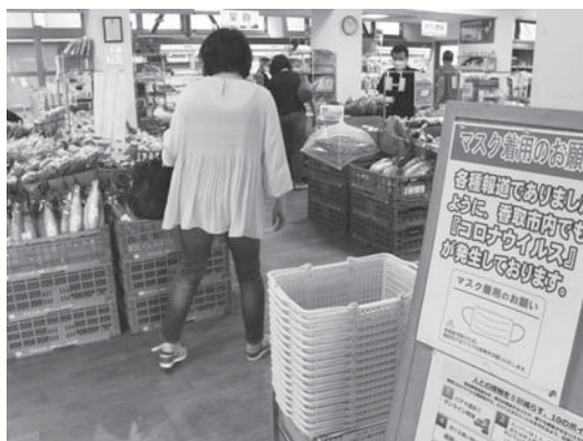
ステイホームにより需要が増えた直売所