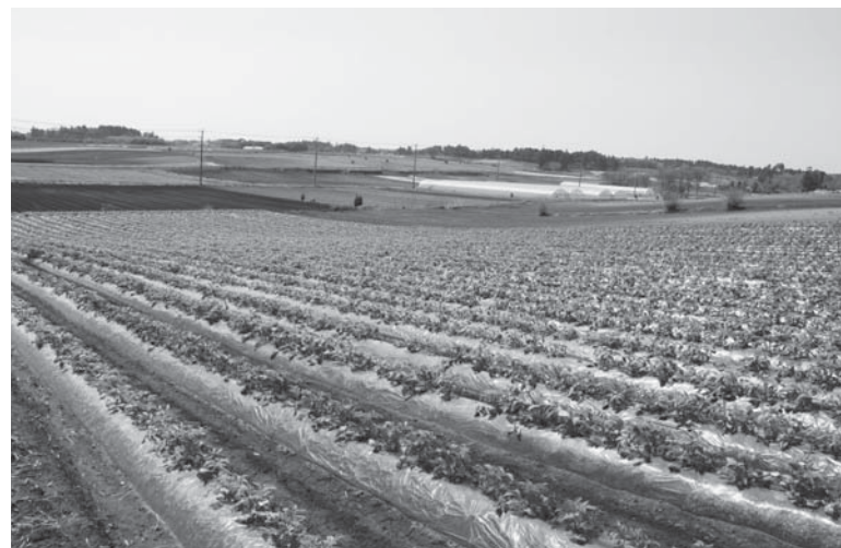
サツマイモの作付け風景

す。また、市民へは、マスク、手袋、体温計、ペーパータオルや消毒用シート、ごみ袋等の持参をお願いします。