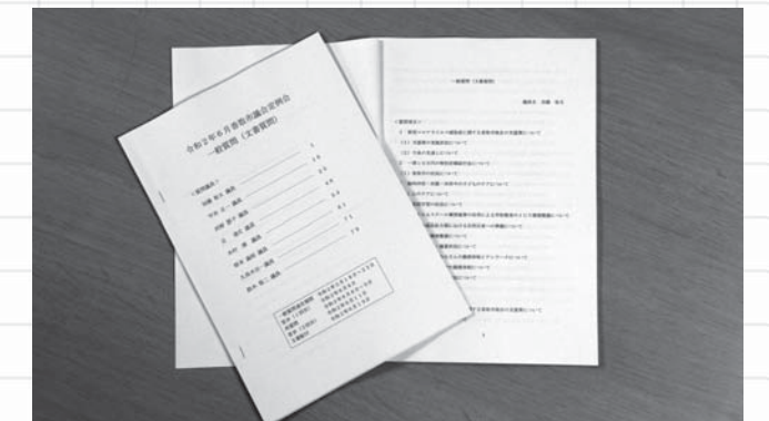
香取市議会では初の試みとなった文書による一般質問