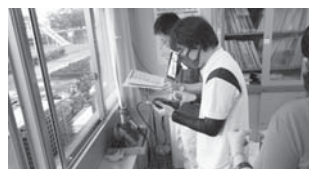
市職員による避難所開設訓練

A なるべく多くの避難所を開設し、感染防止策を講じた対応が取れるよう準備を進めています。また、車中避難を想定し、避難所の駐車スペースの確保やゴルフ場など民間施設の駐車場の活用を協議しています。