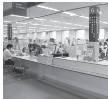
国民健康保険税減免申請窓口 (市役所1階税務課)

Q 子どもたちの教育格差解消、教育課程の遅滞に対する取り組み、またネット環境の整備等の方向性は。