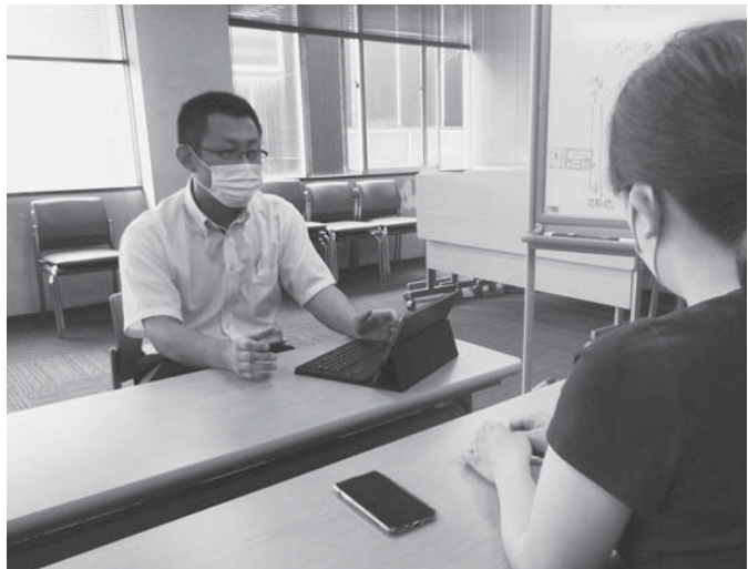
佐原商工会議所内の経営相談窓口

A 新しい生活様式が示される中、ITや観光資源を活用し、有能な人材が香取市に住んでいただけるような器を作るのは、今がチャンスと考えます。