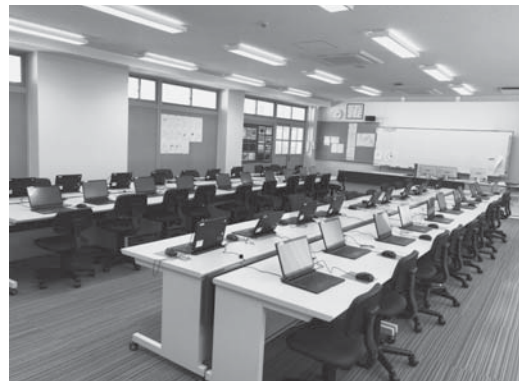
1人に1台の端末整備が進む小見川中学校

A 小学生から中学生まで1人に1台の端末を整備するもので、5月1日現在、4,561人の児童生徒に対して、既に1,048台を整備しており、不足する3,513台を整備します。