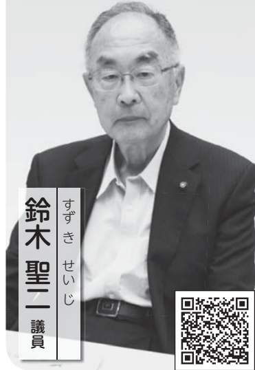
すずき せいじ 鈴木聖一 議員