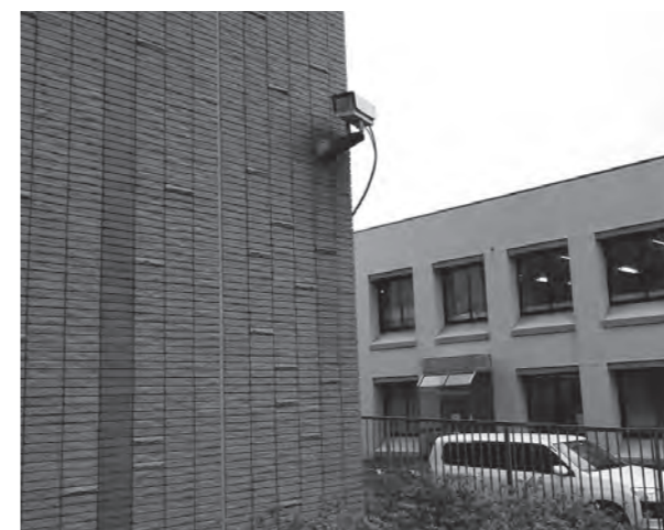
市役所駐車場内設置防犯カメラ

Q 就労継続支援事業の現状は。 A 平成30年度末で実利用者126人、延べ利用者1280人です。内訳としては、雇用契約を伴う就労支援に1事業所16人、雇用契約を伴わない就労支援に28事業所、そのうち市内に5事業所、利用者110人です。