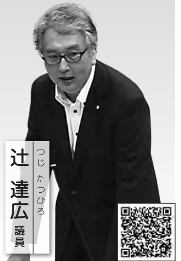
つじたつひろ 辻達広 議員