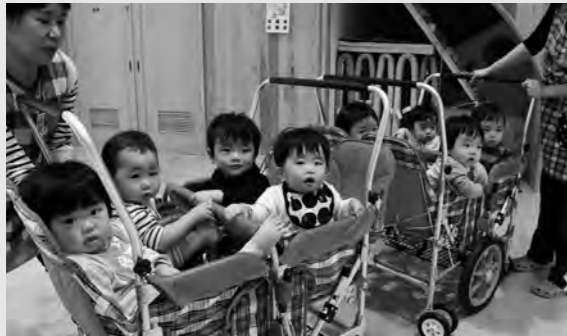
市内こども園第1号のおみがわこども園

Q 幼保一元化施設整備事業に関し、繰越額の内容は。 A 用地取得費と登記委託料を合わせた1億8097万7千円が繰越額です。これは、用地交渉が年度内に終了できなかったためです。 Q 用地取得費等は、補正で予算化されたもので、年度内に執行するべき。 A 平成30年度の見直しは、平成30年度中に執行できるように、現在、最大限努力しています。