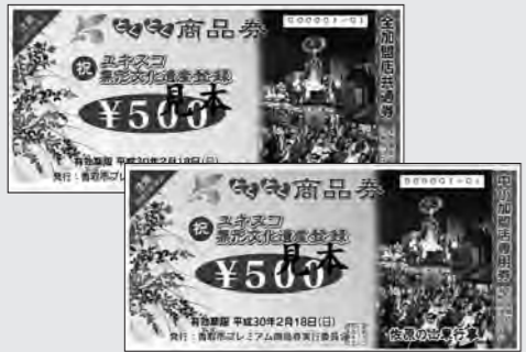
平成29年度まで発行していたプレミアム商品券(見本)

Q プレミアム商品券発行事業に関し、事業の成果と平成30年度中止の理由は。 A 事業は平成21年度から9年間実施し、総額34億9千万円を発行し、換金額は約34億8千万円です。市民への消費喚起と加盟店の売り上げ向上に一定の効果があつたと考えます。しかし、プレミアム商品券は、ある程度の発行部数を確保する必要があります。予算規模が大きいため、また、これまで長期間実施してきたことから、執行団体と協議し、新たな視点で商業の活性化を推進するため、本事業は実施しないことになりました。