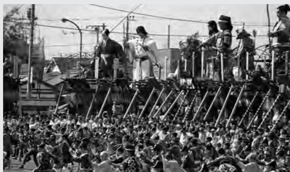
ユネスコ無形文化遺産登録記念事業での山車行事

Q ユネスコ無形文化遺産登録記念事業に関し、事業費の内訳は。 A 市の一般会計と佐原の大祭実行委員会から支出されています。佐原の大祭の実施主体となり、その歳入は、協賛金、県補助金、枚数席収入等で、2503万6千円。歳出は、枚数席の設置を含む会場設営費、警備費等で、1853万6千円。歳入から歳出を差し引いた金額650万円が余剰金となり、精算金として市の会計に戻しました。