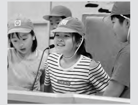
新島小学校3年生 (7月11日)

市議会では、開かれた議会を目指し議場見学を積極的に受け入れています。今年度も市内小学校の児童の皆さんが、社会科見学の 일환として議場を訪れました。議長席などに座りマイクで話すなどの体験をしながら議場を見学し、議会や議員について楽しく学習しました。