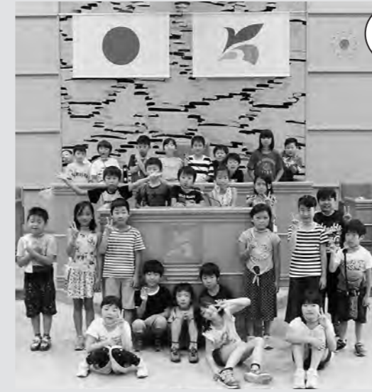
小見川西小学校3年生 (7月3日)