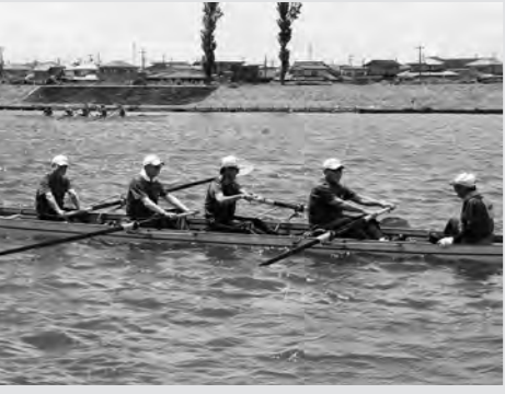
水面でも元気はつらつな議員クルー

7月8日に黒部川特設コースで「第13回香取市民レガッタ」が開催されました。熟年男子の部に出場した議員クルーは、惜しくも予選敗退となりましたが、水上スポーツの推進に役買いたいと力を合わせ漕ぎ進めました。9月15日、16日には滋賀県大津市で開催される全国市町村交流レガッタにも参加する予定です。