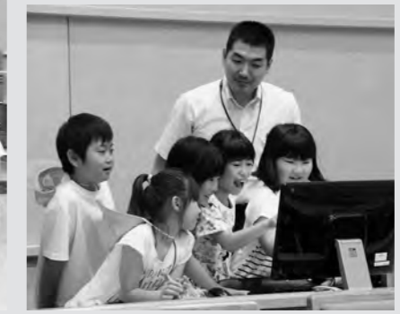
山倉小学校3年生 (6月1日)