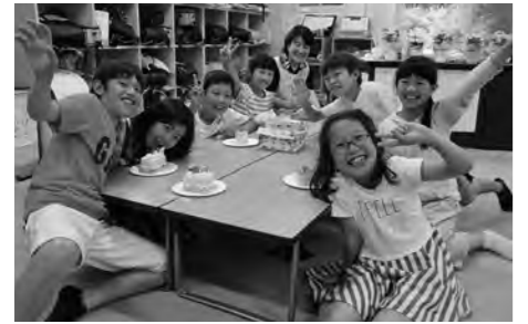
平成30年4月に移設した栗源児童クラブ

討論 子どもの安全を考慮した場合、本来なら更新した免許を持ち、より現職に近い資格を持つ放課後児童支援員を配置し、安全対策を適正に実施していく放課後児童クラブであってほしいが、賛成します。