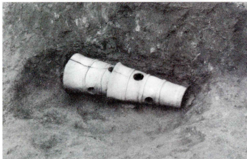
円筒埴輪棺本体 埋納状況