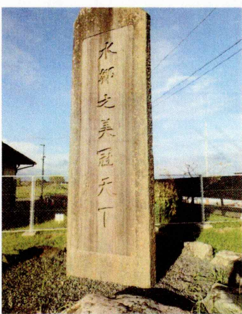
◀水郷乃美冠天下碑