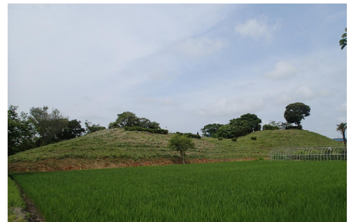
三ノ分目大塚山古墳

さんのわけめおおつかやまこふん 三ノ分目大塚山古墳（市指定史跡）からは円筒埴輪が出土しており、墳丘上には ながもちがたせっかん 長持形石棺が3枚残されています。全長123m、後円部径68m、同高さ9.5m、推定前方部幅62m、同7.5mです。千葉県内でも屈指の大きさで、利根川下流域最大の前方後円墳です。5世紀中ごろの築造と考えられます。