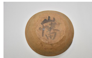
墨書土器 (古屋敷遺跡)