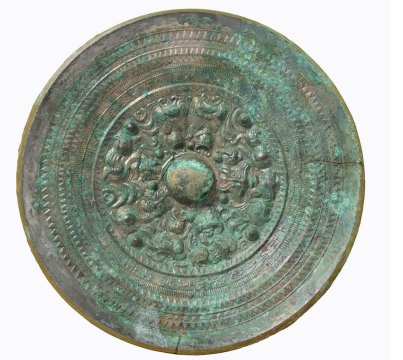
三角縁三神五獣鏡（城山1号墳）