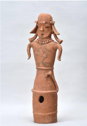
武人埴輪（城山1号墳）

鞍金具、轡、杏葉、雲珠、辻金具など馬具一式です。鉄地に金メッキした銅板を張り付けて装飾したものです。