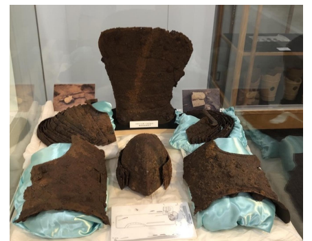
冑・甲（布野台古墳）

衝角付冑の一部が出土しました。衝角とは、冑の正面が軍艦の舳先に付けられた鋭い先端のように突き出していることから名づけられました。長方形の鉄板は小札といい、革紐でつないで甲や小手などを作ったものです。