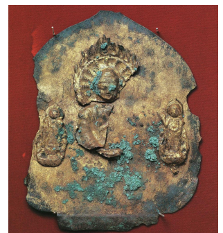
金銅製三尊押出仏（関峯崎3号墳）

せきみねさき 関峯崎3号横穴、 こんどうせいさんぞんおしだしぶつ 金銅製三尊押出仏（県指定文化財）。銅板を型の上に乗せ、敲き出して作った仏像で、一部に金メッキが残っています。東国への仏教伝播を知る上で、とても重要な資料です。