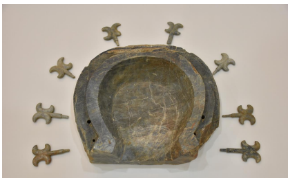
石枕（大戸宮作1号墳）