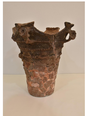
縄文土器（木内明神貝塚）

縄文時代は、草創期 そうそうき ・早期 そうき ・前期 ぜんき ・中期 ちゅうき ・後期 こうき ・晩期 ばんき と区分され、約1万年以上にわたり続いた時代です。旧石器時代から次第に温暖化が進み、台地上には豊かな森が広がり、海面上昇により現在の利根川や低地のところは大きな内海となっていました。（4頁の約1000年前の様子よりも更に大きな内海と考えられます）動植物、魚介類に恵まれ、多くの集落や貝塚が作られました。特に、黒部川 くろべがわ を囲む台地上には、阿玉台貝塚 あたまだい （国指定史跡）・良文貝塚 よしぶん （国指定史跡） しろのだい ・城ノ台貝塚など、全国的に著名な貝塚が多くあります。その他には下小野貝塚 しもおの （県指定史跡） いそはな ・鵜崎貝塚 ときざき （市指定史跡）などがあります。また集落では、磯花遺跡のような時期の異なる2つの環状集落が作られました。