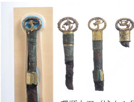
環頭大刀（城山1号墳）

装飾大刀（環頭大刀・頭椎大刀・円頭大刀など）は権力の象徴として古墳に埋葬されたのでしょう。金銅装の華麗な大刀です。環頭大刀は柄頭が丸い環になっていて、環の中には龍や鳳凰がデザインされています。また直刀の鍔の側面には、銀象嵌による装飾が見られます。