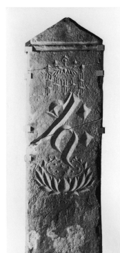
板碑正元元年八月廿二日在銘（長泉院跡出土）

板石状の供養塔婆の一種で、市内では しもうさがたいたび 下総型板碑と呼ばれる多数の板碑が見つかります。県内でも最古級の しょうか 正嘉 2（1258）年在銘 1 基（ 市指定文化財 ）、 しょうげん 次年の正元元（1259）年在銘 5 基（ 県及び市指定文化財 ）を始め、約 1000 基近くの板碑があります。いぶき館 1 階ガラスコリドー内には、正元元年の板碑が展示してあります。あわせてご覧ください。